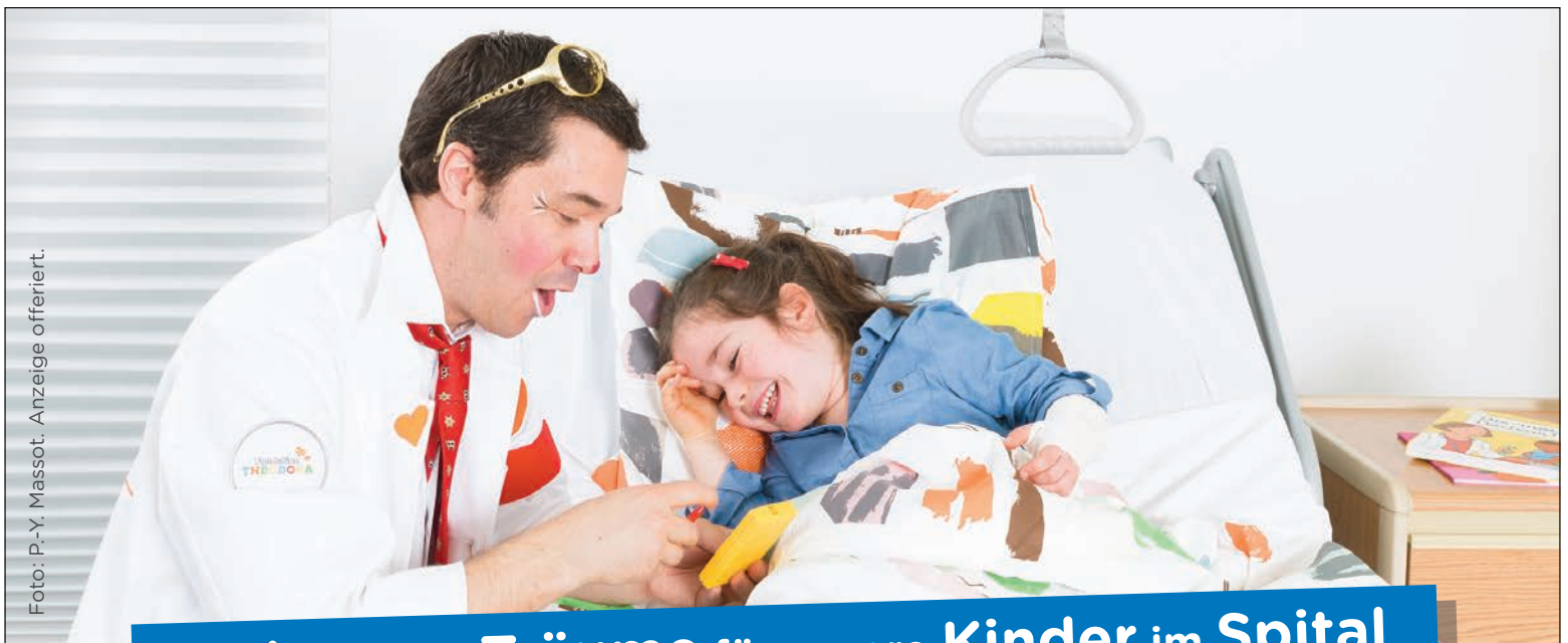
Anzeige offeriert.

Cavelti AG | Wilerstrasse 73 | 9200 Gossau | www.cavelti.ch | T 071 388 81 81