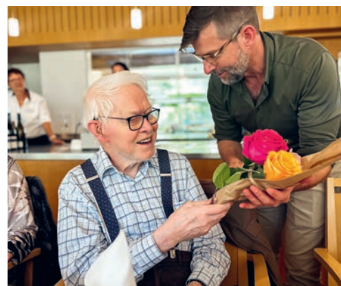
Die Jubilarenfeier im Tertianum Feldegg wird von den Jubilareinnen und Jubilaren sehr geschätzt.

ungsvolle Feier musikalisch umrahmt und so wesentlich zum geselligen Beisammensein und zur guten Stimmung beigetragen.