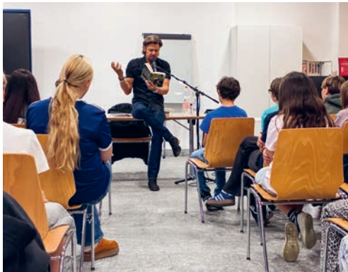
Nebst der Lesung bekamen die Kinder die Gelegenheit, selber aktiv zu werden und mitzugestalten.