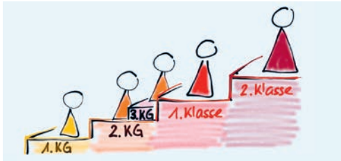
Die Klasseneinteilung ist für die Schule jedes Jahr eine spannende Herausforderung.

DEGERSHEIM Der Schuleintritt oder der Stufenwechsel sind sowohl für die Schülerinnen und Schüler als auch für deren Eltern gewichtige Ereignisse. Die Schule Degersheim ist sich dessen bewusst und legt darum viel Wert auf eine gute Einteilungsplanung. Die Reaktionen zeigen: offenbar ist es ihr auch in diesem Jahr gut geglückt.