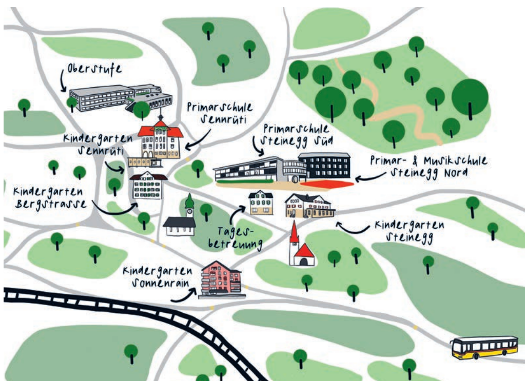
Der Kindergarten Sonnenrain verschwindet aus der Schullandkarte von Degersheim.

DEGERSHEIM Der Schulrat und der Gemeinderat haben entschieden, den Kindergartenstandort Sonnenrain aufzulösen und dafür den Standort Steinegg zu einem Doppelkindergarten zu erweitern. Der neue Standort bietet mit der Nähe zu den weiteren Schulstandorten und mit dem Synergiepotential grosse Vorteile für den Kindergartenbetrieb. Die Umsetzung erfolgt mit dem Schulstart 2026/2027.