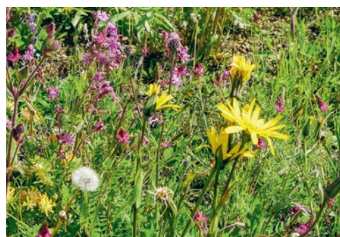
Wildblumenwiese im Botsberger Riet.

VEREIN Bereits im Herbst 2023 hat die Stiftung Naturschutzreservate Flawil und Umgebung mit der Saatbettvorbereitung für eine Wildblumenwiese am Oberen Botsbergweg begonnen. Die vollständige Entfernung der bestehenden Vegetationsschicht mit Bodenfräse und Striegel ist Voraussetzung für eine Erfolg versprechende Neuansaat. Im Frühjahr 2024 erfolgten dann weitere Bodenbearbeitungen und die Ansaat der Wildblumenwiese. Die wechselhafte Witterung erschwerte die Arbeiten immer wieder. Viele, teilweise intensive Regengüsse schwemmten einen Teil des bereits ausgebrachten Saatgutes weg,