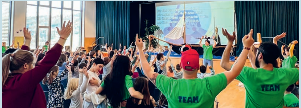
Kinderwoche 2025 Degersheim.

Im Mittelpunkt stehen oft biblische Geschichten, die kindgerecht erzählt und erlebbar gemacht werden. Ob bekannte Erzählungen wie die Arche Noah, David und Goliath oder Gleichnisse Jesu – die Inhalte werden durch Theaterstücke, Rollenspiele oder kreative Inputs lebendig. Mancherorts greifen die Kinderwochen auch thematische Schwerpunkte auf, etwa Freundschaft, Mut, Vertrauen oder den Umgang mit der Schöpfung. Neben den inhaltlichen Impulsen kommt der Spass nicht zu kurz: Spiele im Freien, spannende Geländespiele oder sportliche Aktivitäten sorgen für Bewegung und Begeisterung. Gemeinsames Singen – oft mit modernen, mitreissenden Liedern – schafft eine fröhliche Atmosphäre und stärkt das Gemeinschaftsgefühl.