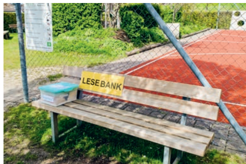
Schon bald finden sich in der ganzen Gemeinde wieder die Lesebänke.

Am 23. April ist der Weltbuchtage. Von der UNESCO wurde dieser Aktionstag für das Lesen, für Bücher, für die Kultur des geschriebenen Wortes und auch für die Rechte ihrer Autorinnen und Autoren 1995 ins Leben gerufen. Die Bibliothek Ludothek nimmt dieses Datum jeweils zum Anlass, um im Gemeindegebiet von Degersheim auf Park- und Wanderbänkli bis zu den Sommerferien gut gefüllte Kisten zu deponieren. Spannende Bücher, kurzweilige Zeitschriften und unterhaltsame Comics sind darin zu finden. Stöbern Sie in der Kiste und lassen Sie sich verführen. Entnehmen Sie der Kiste ein Sie ansprechendes Buch und lesen Sie es, vielleicht schon an Ort und Stelle am Fundort oder nehmen Sie den Lesestoff mit nach Hause. Sie dürfen die Lektüre behalten, einer anderen Person weitergeben oder das Buch wieder in die Kiste zurücklegen. Das Team der Bibliothek Ludothek freut sich,