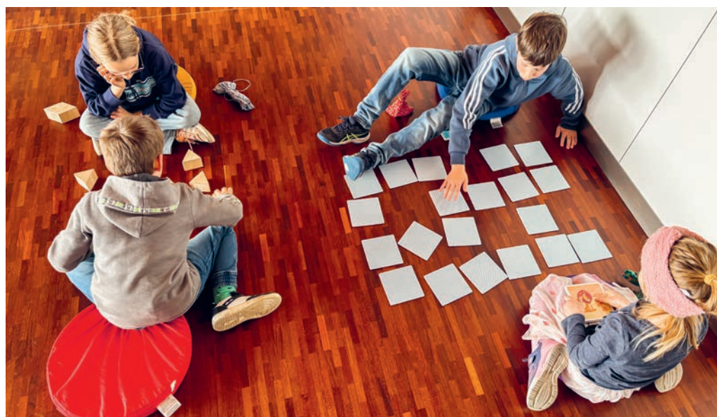
Beim BiblioWeekend in Degersheim standen Spiel und Spass im Mittelpunkt.

hiess es: «Auf zum Duell!» Gross und Klein folgten dieser Aufforderung und massen sich in verschiedenen Zweierspielen. Ob bei Memory, beim Jenga-Turmbau, beim Eimerstapeln (XXL Crazy Cup) oder beim Disc-Darts, die Auswahl war vielfältig und sorgte für spannende Spielkämpfe. Die Stimmung war ausgelassen und der Kampfgeist gross. Zu Beginn erhielt jede Person ein Säckli mit zehn Spielchips. Wurde ein Spiel verloren, musste der Verlierer dem Gewinner einen Chip abgeben. So wurden einige Säckli immer voller, während andere leerer wurden. Gewonnen haben an diesem Nachmittag alle Teilnehmenden und erhielten deshalb zum Abschluss ein Weggli und ein Bruggeli mit auf den Heimweg.