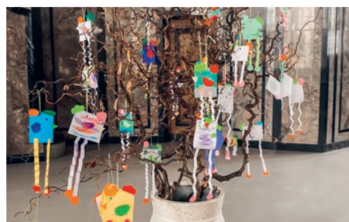
Osterbaum in der reformierten Kirche Feld.