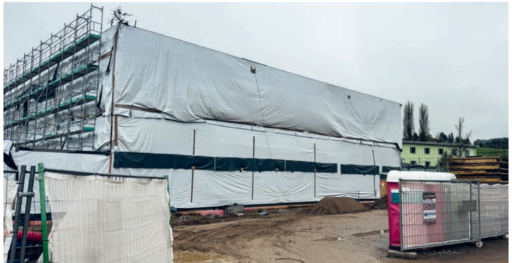
Die Bauarbeiten zur neuen Dreifachhalle ruhen seit fünf Monaten. Nun könnte bald ein Entscheid über das weitere Vorgehen vorliegen.

Die Bauarbeiten auf der Baustelle der neuen Dreifachhalle mit Musikschulzentrum Feld wurden am 12. November 2025 wegen Materialmängeln an den Holzverbundplatten eingestellt. Kurz darauf wurden mit juristischer Unterstützung Mängelrügen erstellt. Seither wurde nicht mehr viel kommuniziert. Dies hat zu mehrfachen Nachfragen durch Bürgerinnen und Bürgern geführt. Aufgrund der immer noch andauernden technischen Abklärungen konnte jeweils nicht viel Neues kommuniziert werden. Ende März fand bereits die dritte technische Sitzung mit den involvierten Unternehmen statt. Ziel dieser technischen Sitzungen ist es, Möglichkeiten wie Ertüchtigung oder Rückbau zu eruieren. Diese Abklärungen benötigen viel Zeit, braucht es doch immer wieder ausführliche Berechnungen durch Ingenieure. Aktuell zeichnet sich ab, dass eine statische Ertüchtigung ohne Rückbau möglich sein könnte. Für eine mögliche Umsetzung werden nun bis Ende April ein Kostenvoranschlag sowie ein Terminplan für eine statische Ertüchtigung erarbeitet. Darauf aufbauend werden dann bis Ende