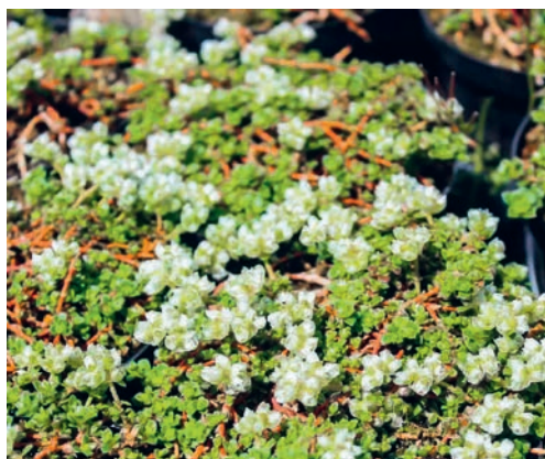
Die neue Kreisel-Innengestaltung wird in Anlehnung an das Chocolarium gestaltet.

Die Unterlagen liegen während 30 Tagen vom 22. April 2026 bis 21. Mai 2026 im Gemeindehaus Flawil, Bahnhofstrasse 6, im 3. Stock beim Anschlagbrett des Geschäftsfeldes Bau und Infrastruktur zur öffentlichen Einsichtnahme auf.