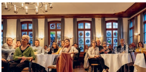
Über 70 Personen nahmen an der Hauptversammlung teil.