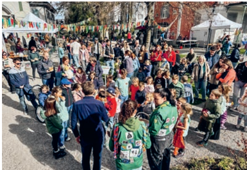
Eine fröhliche Schar Eier-Suchende fand sich im Lindengut-Park zusammen.

Alle Beteiligten, ob Gäste oder Organisierende, erlebten im lauschigen Lindengut-Park einen fröhlichen Nachmittag bei angenehmem Wetter. Sie dürften sich wohl bereits heute auf die nächste «Ei, Ei, Ei-Finderei» freuen. Marianne Bargagna