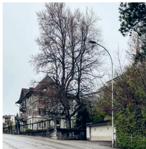
Die geschützte Blutbuche an der Hauptstrasse in Degersheim muss aus Sicherheitsgründen gefällt werden.

Die Blutbuche an der Hauptstrasse 54 in Degersheim ist schätzungsweise 100 bis 120 Jahre alt und prägt seit langer Zeit das Ortsbild. Aus diesem Grund ist sie in der Schutzverordnung der Gemeinde Degersheim als geschützter Einzelbaum aufgeführt. Bei einer Begutachtung im Oktober 2025 stellte ein Spezialist fest, dass der Baum geschwächt ist und Teile bereits absterben. Dies zeigt sich unter anderem durch vermehrte Astabbrüche. Aufgrund des Standorts direkt neben dem Wohngebäude, der Hauptstrasse und dem Trottoir stellt der Baum in seinem aktuellen Zustand eine Gefahr für Menschen und Sachwerte dar. In Zusammenarbeit mit dem Werkhof hat der Gemeinderat deshalb die Fällung des Baums beschlossen. Gleichzeitig wurde die Eigentümerschaft verpflichtet, eine Ersatzpflan-