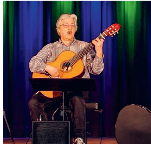
Der Sänger und Gitarrist beim Vorstellen der Chansons von Mani Matter.