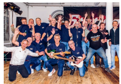
Die TCD-Senioren und die Musiker von «Station Quo» verstehen sich seit Jahren prächtig.