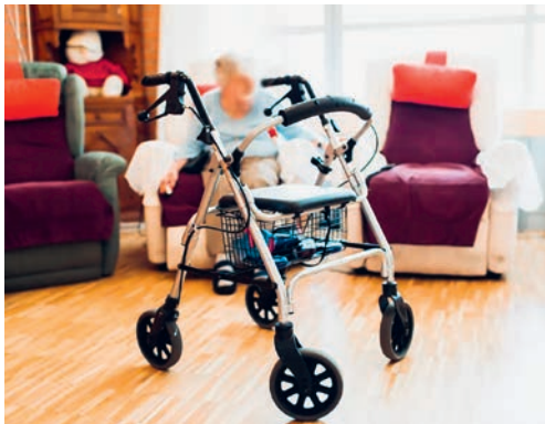
Personen im AHV-Alter mit finanziellen Engpässen haben möglicherweise Anspruch auf Ergänzungsleistungen.

FLAWIL/DEGERSHEIM Gemäss Pro Senectute gibt es Personen im AHV-Alter, die trotz schwierigen finanziellen Verhältnissen keine Ergänzungsleistungen (EL) beantragen, obwohl sie bezugsberechtigt wären. Die Gründe für diese Zurückhaltung sind vielfältig. Die Pro Senectute bietet für Betroffene Beratung und Unterstützung an.