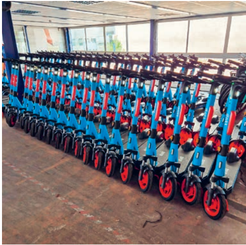
Die neuen E-Trottinets der Firma Dott werden auch in Kürze in Flawil einsatzbereit sein.

FLAWIL Die Firma Dott modernisiert ihre E-Trottinets. In Kürze ist man auch in Flawil mit den verbesserten Modellen unterwegs.