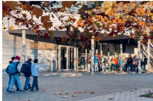
Die Primarschule Degersheim freut sich auf neue Begegnungen in Degersheim.

tiven kennenlernen und mit verschiedenen Menschen und Orten in Kontakt treten. Die Kinder und die Lehrpersonen der Schulhäuser Steinegg und Sennrüti freuen sich sehr auf diese besondere Woche und darauf, dass neue Begegnungen entstehen können.