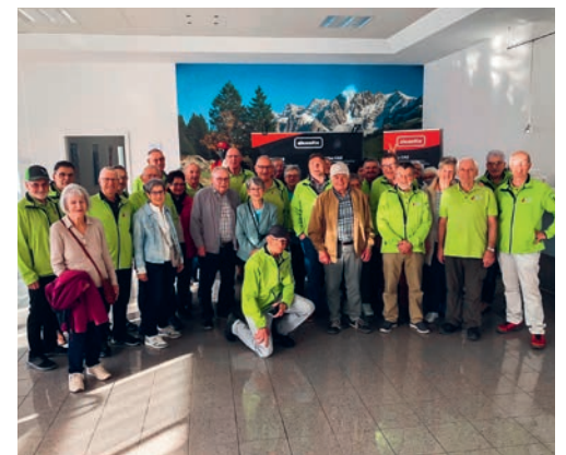
Im Schauraum der Cleanfix.