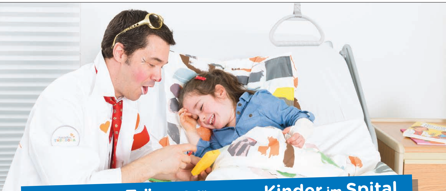
Anzeige offeriert.

Der Trauergottesdienst findet am Dienstag, 17. März 2026 um 10.00 Uhr in der der Kath. Kirche Degersheim statt.