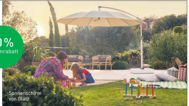
Sonnenschirm von Glatz

Wohnschreinerei Türmlihuus Lombriser AG Flawil & St. Gallen | tuermlihuus.ch