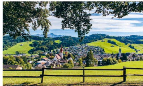
Die Tourismus-Abgaben tragen einen Beitrag zur Instandhaltung der touristischen Infrastruktur der Gemeinde Degersheim bei.

Jahren abgeschlossen haben, auf eine reglementarische Grundlage gestellt. Sämtliche Beherbergungsbetriebe sowie Anbieter von Ferienwohnungen bekamen Gelegenheit, sich zum neuen Reglement zu äussern. Das Reglement sowie der Gebührentarif unterlagen vom 21. November bis am 22. Dezember 2025 dem fakultativen Referendum. Der Gemeinderat stellte an seiner Sitzung vom 3. Februar 2026 fest, dass das Referendum nicht ergriffen wurde und setzt nun das neue Reglement per 1. März 2026 in Kraft (siehe Inserat auf Seite 4 dieser Ausgabe).