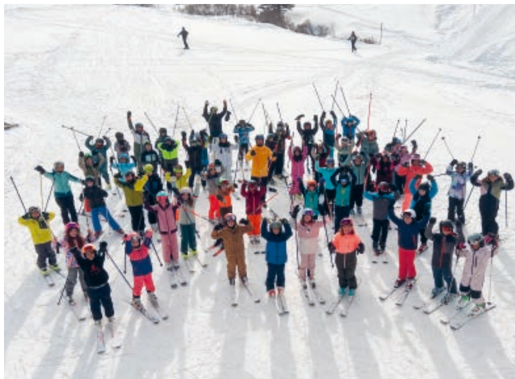
Über 270 Kinder besuchten das Ski- und Snowboardlager der Mittelstufe Flawil in Fideris.

Eine Wintersportwoche dieser Art ist nur dank dem grossen Einsatz der Lehrpersonen, der freiwilligen Wintersportleiterinnen und -leiter sowie der Köchinnen und Köche und einer Gemeinde möglich, die trotz Sparmassnahmen an der Woche festhält und diese unterstützt.