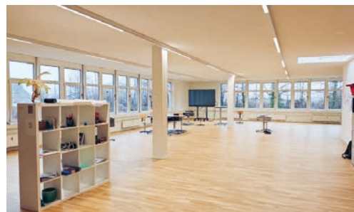
Flawiler Oberstufenschülerinnen und -schüler, welche ein schulisches Timeout benötigen, können neu die Perspektiven-Werkstatt Fürstenland in Oberuzwil besuchen.

Die Perspektiven-Werkstatt befindet sich im obersten Stock einer Gewerbeliegenschaft in Oberuzwil – mit einer Infrastruktur, die bewusst auf eine lernförderliche Atmosphäre ausgerichtet ist. Helle Räume, ruhige Arbeitsplätze sowie eine grosszügige Küche schaffen ideale Voraussetzungen für eine strukturierte Tagesgestaltung. Die Jugendlichen werden in einer klar organisierten Tagesstruktur begleitet, welche schulische Förderung, praktische Arbeiten und soziale Entwicklung verbindet.