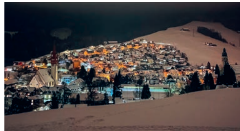
Das Glockengeläut zum Jahreswechsel hat eine lange Tradition.

die Ruhe um Mitternacht wird durch den Lärm des Feuerwerks gestört. Der Gemeinderat bittet die Bevölkerung deswegen darum, sich im Umgang mit Feuerwerk gegenüber Mensch, Tier und Umwelt respektvoll zu verhalten. Der Verzicht auf das Abfeuern von Feuerwerk zwischen 23.45 und 00.15 Uhr in der Silvesternacht erlaubt es den Bewohnerinnen und Bewohnern, die den Jahreswechsel als besinnlichen Moment erleben möchten, dies störungsfrei zu tun.