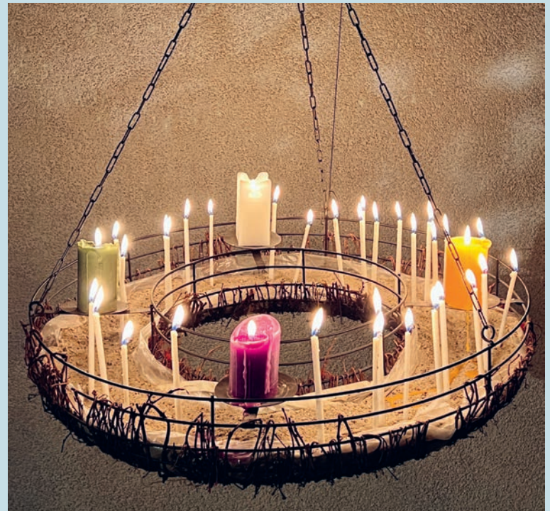
Adventskranz hängend (Kirche Degersheim 2024)