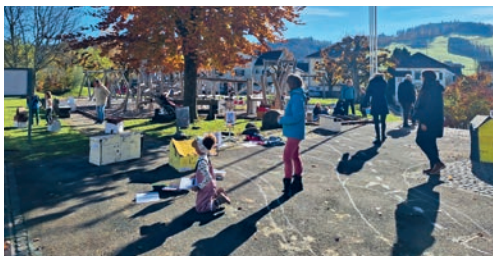
Die Kinder stellten Degersheim und Wolfertswil in Miniaturformat nach.

Im ersten Quartal dieses Schuljahres besuchten die Schulklassen und Lehrpersonen des Primarschulhauses Sennrüti im Rahmen des Themas Orientierung die Wohnorte der Kinder aus der ersten Klasse. Dabei haben sie die Häuser fotografiert und später nachgezeichnet. Als erste Herausforderung für ihren Orientierungssinn haben die Kinder anschliessend Degersheim im Schulzimmer mit Kaplas und Bausteinen nachgebaut. Danach folgte die grössere Herausforderung: Nach dem Bau des eigenen Wohnhauses aus Karton zeichnen die Kinder auf dem Schulhausplatz die Dorfstrassen mit Kreide und stellten Fotos von 14 Orientierungsmerkmalen wie den Kirchen, Schulhäusern, Wäldern und den Einkaufsmöglichkeiten auf. In das im Kleinformat erstellte Degersheim platzierten die Kinder ihr