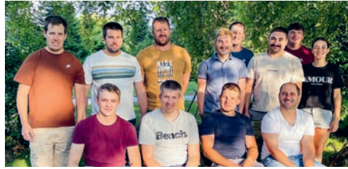
Das OK Degersheim 2026 freut sich auf das Schwingfestwochenende Ende April 2026.