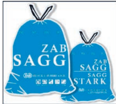
Der neue Kehrichtsack der ZAB-Region kommt in knalligem Blau daher.

terhin nutzen. Auch die Preise für die neuen Säcke bleiben gleich. Somit kostet ein 17-Liter-Sack weiterhin einen Franken, der 35-Liter-Sack zwei Franken, der 60-Liter-Sack drei Franken und der 110-Liter-Sack fünf Franken.