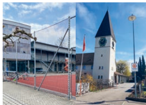
Die Notfalltreffpunkte in der Gemeinde Degersheim befinden sich beim Schulhaus Steinegg und bei der Kirche in Wolfertswil.

Beide Notfalltreffpunkte sind mit einer entsprechenden Tafel gekennzeichnet. Eine Broschüre zu den Notfalltreffpunkten, welche auch wichtige Hinweise für Notsituationen beinhaltet, kann auf der Website der Gemeinde in der Rubrik «Dienstleistungen → Im Notfall» eingesehen werden.