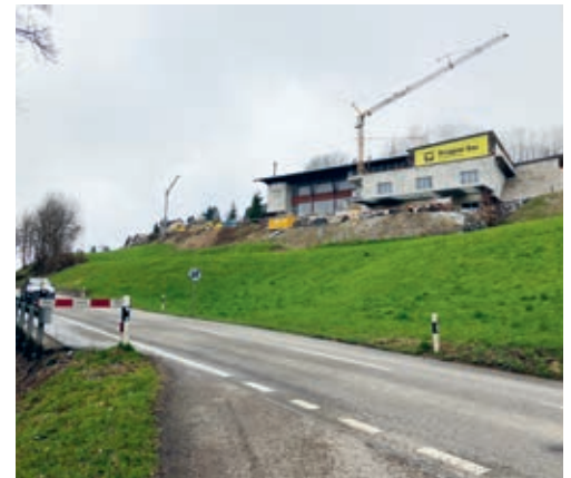
Der Seitenbach des Talbachs entsteht in der Grünau und kreuzt die Kantonsstrasse unterirdisch.

Sondernutzungsplan mit der Ausscheidung des Gewässerraums für den Seitenbach Talbach erarbeitet und den kantonalen Stellen zur Vorprüfung unterbreitet. Diese erachten den vorliegenden Sondernutzungsplan als genehmigungsfähig. Entsprechend hat der Gemeinderat an seiner Sitzung vom 5. März 2024 den Sondernutzungsplan erlassen und zur öffentlichen Auflage verabschiedet. Der Sondernutzungsplan Seitenbach Talbach und die zugehörigen Dokumente können vom 22. März bis zum 20. April 2024 in der Gemeinderatskanzlei oder auf der Website der Gemeinde, Rubrik «Politik → Sondernutzungsplan Seitenbach Talbach», eingesehen werden. Das dazugehörige Inserat finden Sie in dieser FLADE-Blatt-Ausgabe auf Seite 4.