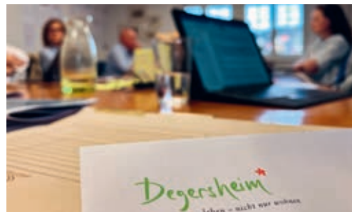
Für die Degersheimer Gesamterneuerungswahlen von Gemeinderat, Schulrat und GPK 2024 werden neue Behördenmitglieder gesucht.

kritisch beäugt wird. Die aktive Mitarbeit in der Gemeindepolitik ist jedoch auch bereichernd und lehrreich. Ein solches Amt gibt entsprechend viel Positives und Nützliches zurück. Nicht zuletzt erhalten Amtsträgerinnen und Amtsträger eine finanzielle Entschädigung für ihre zeitlichen Aufwände. Als wichtigste Voraussetzung gilt der Wille, sich für das Gesamtwohl der Gemeinde einzubringen. Dazu gehört eine gewisse Verbundenheit zum Wohn- und Lebensort Degersheim. Auch die