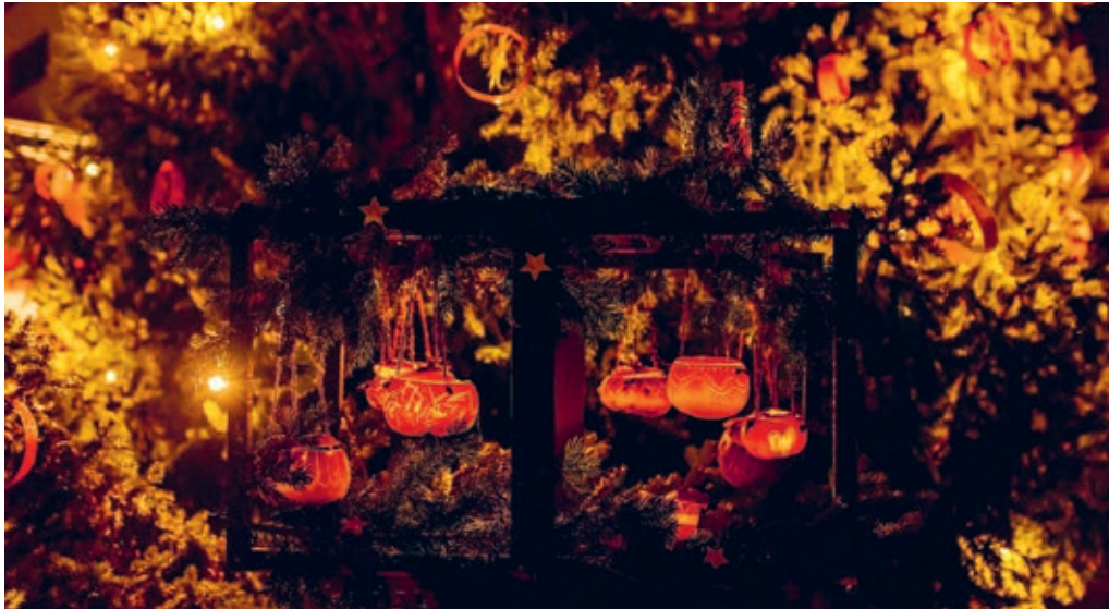
Der geschmückte Leiterwagen der Kita führte den Umzug an.

DEGERSHEIM Am Abend des Weihnachtsmarktfreitags erstrahlte Degersheim im warmen Licht des Räbäliächtliumzugs der Kita Kieselstein, der einen beeindruckenden Besucherstrom anzog. Die Kinder, voller Vorfreude und ausgestattet mit liebevoll selbstgebastelten Laternen und kunstvoll geschnitzten Räben, durchzogen in einem fröhlichen Zug das Dunkel des Dorfes.