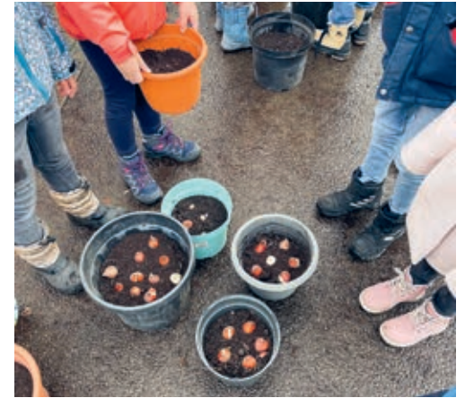
Über 1000 Tulpenzwiebeln wurden in Töpfe gepflanzt.

AG für die Spende von 400 Wildtulpenzwiebeln, beim Unterhaltsdienst der Gemeinde Flawil für die Lieferung der Erde, bei den Eltern der Schulkinder für die Blumentöpfe, bei Rosa Fiechter für die Spende von 40 Tontöpfen sowie bei Roger Gehrig der Firma Gehrig Gartenbau AG für die Spende von über 70 Töpfen.