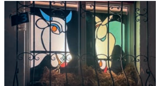
Auch dieses Jahr begleiten die Adventsfenster in Wolfertswil und Degersheim die Bevölkerung während der Adventszeit.