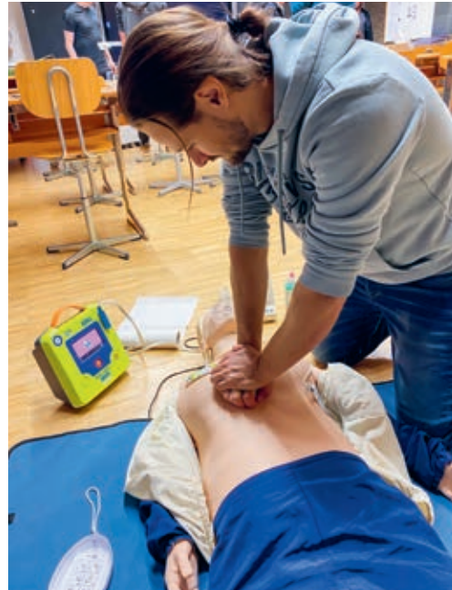
Die Herzmassage ist ein zentrales Element der Lebensrettung.