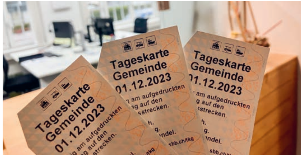
Der Verkauf der «Spartageskarte Gemeinde» erfolgt ausschliesslich über die Schalter des Einwohneramtes der Gemeinden Flawil und Degersheim.

Neu gibt es nur noch ein schweizweites Gesamtkontingent pro Tag. Sie kosten im ganzen Land gleich viel. Allerdings ist der Preis abhängig vom Zeitpunkt der Reservierung, der 1. oder 2. Klasse, und ob die oder der Reisende ein Halbtaxabonnement besitzt. Ist das schweizweite Kontingent aufgebraucht, werden für die jeweiligen Reisetage keine weiteren Tageskarten angeboten.