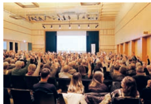
An der Bürgerversammlung nahmen 488 Stimmberechtigte teil.

An der Bürgerversammlung standen neben Zahlen vor allem drei Gutachten im Mittelpunkt. Die Stimmberechtigten haben über die Gutach-