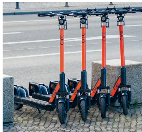
Die Gemeinde Degersheim verzichtet bis auf Weiteres auf das Vermieten von E-Scootern.

Wer regelmässig in Städten unterwegs ist, kennt es. Immer wieder muss man einen Umweg um ein mitten auf dem Trottoir abgestelltes E-Trottinett machen. Dementsprechend ist die Anzahl Personen, die sich über diese Gefährte ärgern, wohl ebenso hoch wie die derjenigen, die darin einen Nutzen sehen und Freude daran haben. Ungeachtet dessen, ob sie als Ärgernis oder als sinnvoller Beitrag zu einer nachhaltigen Mobilität betrachtet werden: In der Gemeinde Degersheim werden mietbare E-Trottinette in naher Zukunft nicht zum Thema. Versuchsbetriebe in anderen ländlichen Gemeinden haben aufgezeigt, dass sie nicht genügend genutzt werden, um rentabel betrieben werden zu können, und entsprechend von der Gemeinde subventioniert werden müssen.