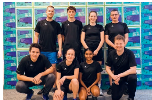
Die Grünstadt-Abholzer waren mit ihrer Turnierleistung sehr zufrieden.

aus dem Turnier. Somit war die Qualifikation für das Achtelfinale in trockenen Tüchern. Dort war dann aber gleich Endstation, der Gegner aus den Reihen des FCs zeigte dem Gemeindeteam rasch die Grenzen auf. Mit ihrer Turnierleistung waren die Grünstädter zufrieden: Mit dem Erreichen des Achtelfinals gelang ein respektables Ergebnis; Einsatz und Engagement haben gepasst, ausser ein paar Schrammen gab es keine grösseren Verletzungen und der Spass kam ebenfalls nicht zu kurz. Während und nach dem sportlichen Wettkampf nutzten die Abholzer gerne die Gelegenheit zum geselligen Beisammensein ausserhalb der Arbeitszeit.