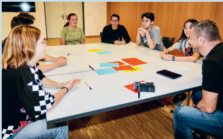
Auf dem Firmweg lernen junge Menschen Kirche als Gemeinschaft schätzen.