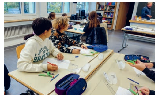
Auf dem Programm standen unter anderem Konstruktionen mit Geodreieck und Zirkel.

Ergänzend zum Besuchsmorgen erhielten auch die Eltern der aktuellen Sechstklässlerinnen und Sechstklässler Gelegenheit für einen Einblick in die Oberstufe. Am Tag nach ihren Kindern folgten über 50 interessierte Eltern der Einladung zum Austausch. Diese erfreulich grosse Gruppe wurde aufgeteilt. Während die eine Hälfte angeleitet durch Lehrpersonen die verschiedenen Gebäudetrakte und Zimmer des Oberstufenzentrums besichtigte, erhielt die andere Hälfte in der Bibliothek Informationen zu unterschiedlichen Themen rund um den Schulalltag an der Oberstufe. Nach einem Wechsel folgte am Ende der gemeinsame Abschluss, bei dem Platz für Fragen und Anliegen war. Die beteiligten Lehrpersonen und die Schulleitung blicken auf eine erfolgreiche Durchführung zurück. Das Format des Schulbesuchsmorgens samt Elternanlass soll als fixer Bestandteil in die Jahresplanung aufgenommen werden.