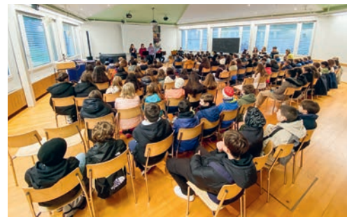
Musikalische Begrüssung am Morgen.

Dann ging es klassenweise in die Schulzimmer. Dort konnte in zwei Einzelektionen Oberstufenluft geschnuppert werden. Auf dem Programm standen unter anderem Konstruktionen mit Geodreieck und Zirkel, ein Sprachenquiz, Einblicke in den menschlichen Körper oder Guetzli-Bakken. Gestärkt mit einem Bürlü folgte nach der Pause ein abwechslungsreicher Postenlauf. Dabei wurden die Klassen durch ihre Lehrpersonen begleitet. Spielerisch lernten die Kinder Räume