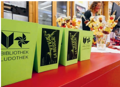
Zu einem richtigen Kinoabend gehört auch eine Portion Popcorn.

Die Schweizer Erzählnacht gibt es seit über 30 Jahren und sie gehört mit rund 750 Veranstaltungen zu einem der grössten Kulturanlässe der Schweiz. Auch die Bibliothek Ludothek Degersheim beteiligte sich mit einem Filmabend für Erwachsene am Anlass. Ein Film ist vielleicht nicht