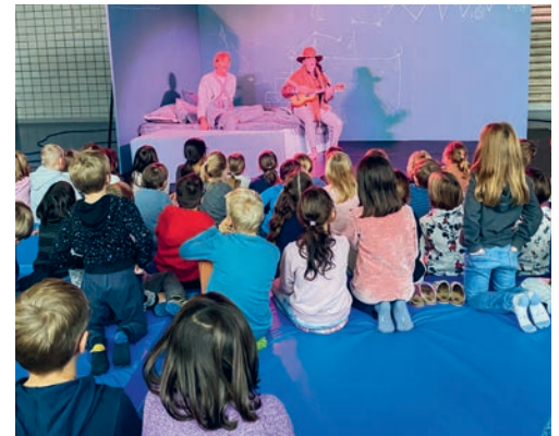
Das junge Publikum war beim mobilen Theaterstück hautnah dabei.

kommt? Wäre es nicht möglich, dass er es bis in die Stadt und dann bis an die Hasenstrasse und schlussendlich bis in die Wohnung schafft? Die Hasenmama zeigt geduldig alle Hindernisse auf, welche der Wolf überwinden müsste, und versucht so das Hasenkind zu beruhigen, damit es endlich einschlafen kann. Als der Wolf am Ende trotz aller Widrigkeiten überraschenderweise vor der Tür steht, freut sich das Hasenkind darüber. Es stellt sich nämlich heraus, dass das Häschen heute Geburtstag hat und der Wolf ihm ein tolles Geschenk mitgebracht hat. Die ganze Geschichte spielten die zwei Schauspielprofis mit einfachsten wechselnden Kostümen, Kreidebildern an den mobilen Theaterwänden und riesigen Schaumstoffbausteinen. Mit wenigen Handgriffen entstanden so im Nu Häschens Bett, Fahrzeuge aus dem Strassenverkehr in der Stadt oder ein Berg. Das Theater St.Gallen hat den Sennrüti-Kindern eindrücklich die Welt des Theaters vorgelebt. Mit einer interessanten Geschichte, wenig Requisiten und einem begeisterten Publikum haben es die Theaterleute geschafft, ein spannendes Theater-