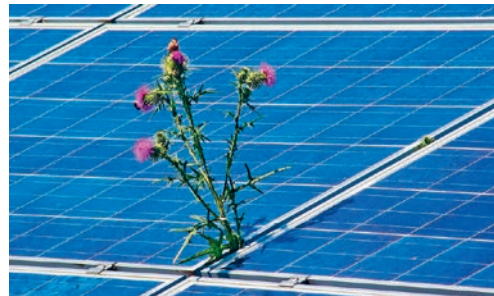
Das Energiemonitoring gibt einen Überblick über den Stand des Ausbaus der erneuerbaren Stromproduktion.

nahmen im Hinblick auf die kommunale wie aber auch nationale Energie- und Klimapolitik. Zu deren Zielen zählt es, die CO 2 -Emissionen zu reduzieren und einen starken Zubau von erneuerbarer Energie zu erreichen. Der Ausbau erneuerbarer Stromproduktion (vor allem Photovoltaik) und der Ersatz fossiler Heizsysteme (insbesondere durch Wärmepumpen) sollen schneller fortschreiten als bisher. Der Gesamtbericht der Energieagentur über das kommunale Energiemonitoring kann auf www.degersheim.ch in der Rubrik «Versorgung» eingesehen werden.