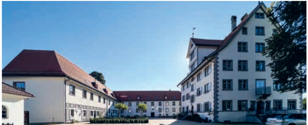
Das Schloss Hauptwil mit neuem Fassadenputz