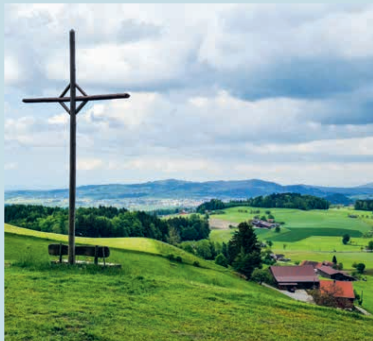
Ein Zeichen Gottes am Friedensweg Degersheim-Magdenau.