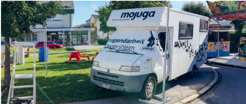
Das MOJUGA-Mobil wird auch weiterhin in der Gemeinde präsent sein.

DEGERSHEIM Die bestehende aufsuchende Jugendarbeit wird seit 2021 von der Stiftung MOJUGA im Auftrag der Gemeinde Degersheim betrieben. Diese Zusammenarbeit hat sich bewährt und soll entsprechend weitergeführt werden. Die Leistungsvereinbarung wird deswegen bis Ende 2026 verlängert.