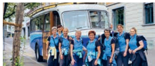
Die diesjährige Turnerreise führte die Frauen des DTV Flawil an den Ägerisee und nach Zug.