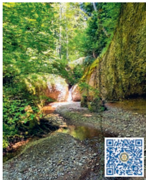
Der Necker wird am 16. September 2023 von Abfall befreit.

Der Clean-up-Day ist ein Aktionstag, bei dem engagierte Freiwillige die Umwelt von Müll befreien. Er findet jeweils am dritten Samstag im September statt. Das Ziel des Sammeltages ist es, das Bewusstsein und die Sensibilisierung für die Abfall-Problematik in der Schweizer Bevölkerung zu fördern und damit eine nachhaltige Veränderung im Denken und Handeln zu erreichen. Der Necker und seine Zuflüsse sind die wichtigsten Zulieferer für das Grundwasser der Gemeinden Neckertal und Degersheim. Für den Rotary Club Neckertal und die Oberstufe Neckertal ist dies Grund genug, anlässlich des Clean-up-Days am 16. September 2023 eine Neckerreinigung durchzuführen. Damit wollen die Initianten einen Beitrag zur Erhaltung der Wasserqualität leisten. Vor mittlerweile 15 Jahren fand bereits eine solche Aktion statt und es kam einiges an Abfall und Unrat zusammen.