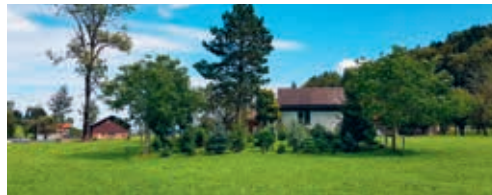
Die Grundwasserschutzzone im Buebental.

Auf Verlangen des Kantons St.Gallen wurde die Grundwasserschutzzone beim Pumpwerk Buebental II der Wasserversorgung Schauenberg im Jahr 2022 überarbeitet, da das dazumal geltende Schutzzonenreglement nicht mehr den gesetzlichen Vorgaben entsprochen hat. Das überarbeitete Reglement sowie der Schutzzonenplan wurden im August 2022 durch den Gemeinderat erlassen. Während der anschliessenden öffentlichen Auflage sind zwei Einsprachen eingegangen. In Verhandlungen mit den Einsprechenden