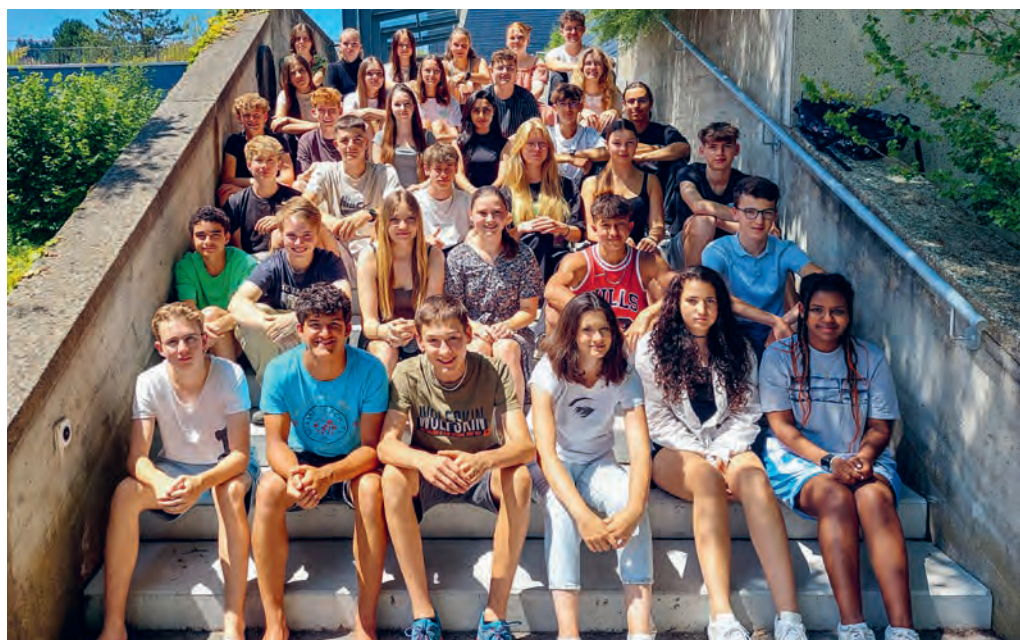
Die Schulabgängerinnen und -abgänger der Oberstufe Degersheim.

übertreten, zwölf werden eine Berufslehre im sozialen Bereich absolvieren, sechs erlernen einen handwerklichen, sechs einen gewerblichen und acht einen kaufmännischen Beruf. Weitere zwei Schülerinnen und Schüler werden ein Brückenangebot besuchen. Die Oberstufe Degersheim gratuliert den Abgängerinnen und Abgängern zum Bestehen der Aufnahmeprüfungen oder zum erfolgreichen Finden einer Anschlusslösung und wünscht allen eine erfüllende Zukunft.