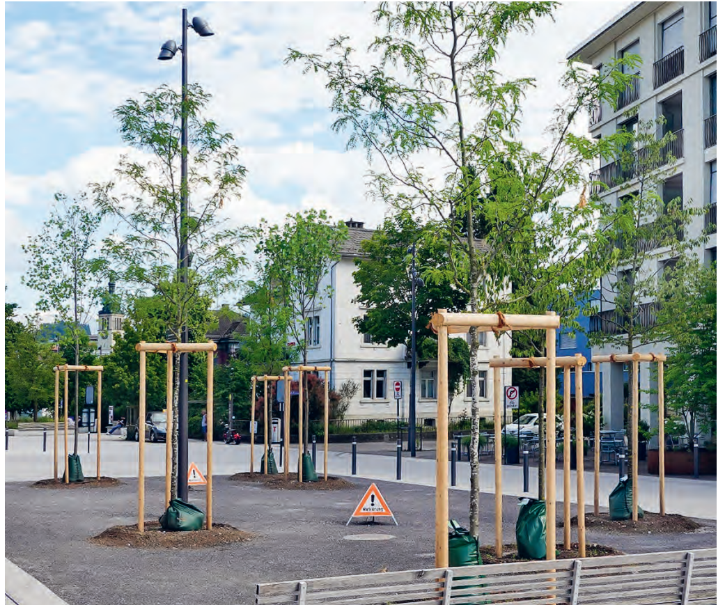
Am 10. August 2023 wird die «Baum-Oase» eingeweiht.

Die Flawiler Ortsgruppe der Grünen Wil-Land hat Ende September 2021 die Volksmotion «Idee Bahnhofplatz» eingereicht. Diese bezweckt, die Aufenthaltsqualität auf dem Bahnhofplatz Flawil durch das Platzieren von einladenden Sitzgelegenheiten und Bäumen zwischen Migrolino und 5egg aufzuwerten. Nachdem die Flawiler Stimmberechtigten an der Bürgerversammlung vom 26. April 2022 der Volksmotion zugestimmt hatten, erfolgte die Erarbeitung eines Gestaltungsprojekts. Mit der Genehmigung des Budgets 2023 an der Bürgerversammlung vom 29. November 2022 haben die Stimmberechtigten den Baukosten in der Höhe von 50 000 Franken zugestimmt. Ab Mitte Juni wurde das Platzgestaltungsprojekt umgesetzt. Nachdem die Arbeiten nun abgeschlossen sind, laden die Grünen Flawil und die Gemeinde Flawil die Bevölkerung zu einer kleinen Einweihungsfeier ein. Diese findet am Donnerstag, 10. August 2023, statt. Ab 18.30 Uhr umrahmt der Singer und Songwriter Richie Pavledis den Anlass mit Folk- und Bluesmusik. Gemeindepäsident Elmar Metzger überbringt um 19 Uhr ein Grusswort des Gemeinderats.