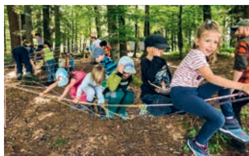
Das Kindswohl steht für alle Beteiligten im Vordergrund.

«Für die bestmögliche Förderung der Kinder und Jugendlichen braucht es eine gute Zusammenarbeit von Schule und Eltern. Dafür sind sowohl die Eltern als auch die Schule verantwortlich. Um diese wichtige Aufgabe gemeinsam wahrzunehmen zu können, ist es unabdingbar, sich ge-