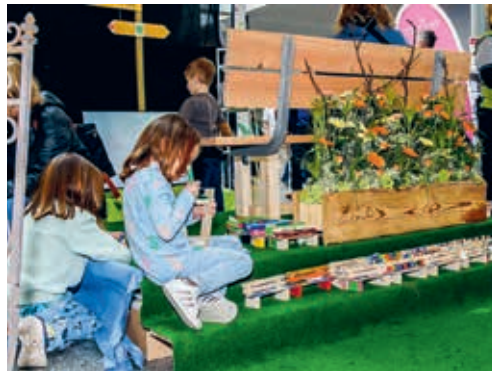
Gross und Klein malten um die Wette.

DEGERSHEIM Über 100 Kinder im Alter von einhalb Jahren bis zum Oberstufenschulalter verzierten mit Malstiften die hölzernen Mini-bänkli am Stand des Verkehrsvereins. Der Vorstand hat die Bänkli nach der Ausstellung in den fünf Kategorien prämiert und die Gewinnerinnen und Gewinner brieflich benachrichtigt. Die Auswahl war riesig. Der Vorstand des Verkehrsvereins bedankt sich ganz herzlich für die Teilnahme. Alle Bänkli zeigten ihrer Altersgruppe entsprechend grosse Kreativität und Ausdauer. Die Bänkli können am Mittwoch, 26. April 2023, 14.00 Uhr, beim Vereinskasten am Eingang der Migros abgeholt werden.