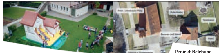
Projekt Belebung Kirchenareals

Degersheim/Mogelsberg Telefon/Fax 071 371 21 59 Mobile 079 698 60 58 E-Mail haroma.maler@gmx.ch