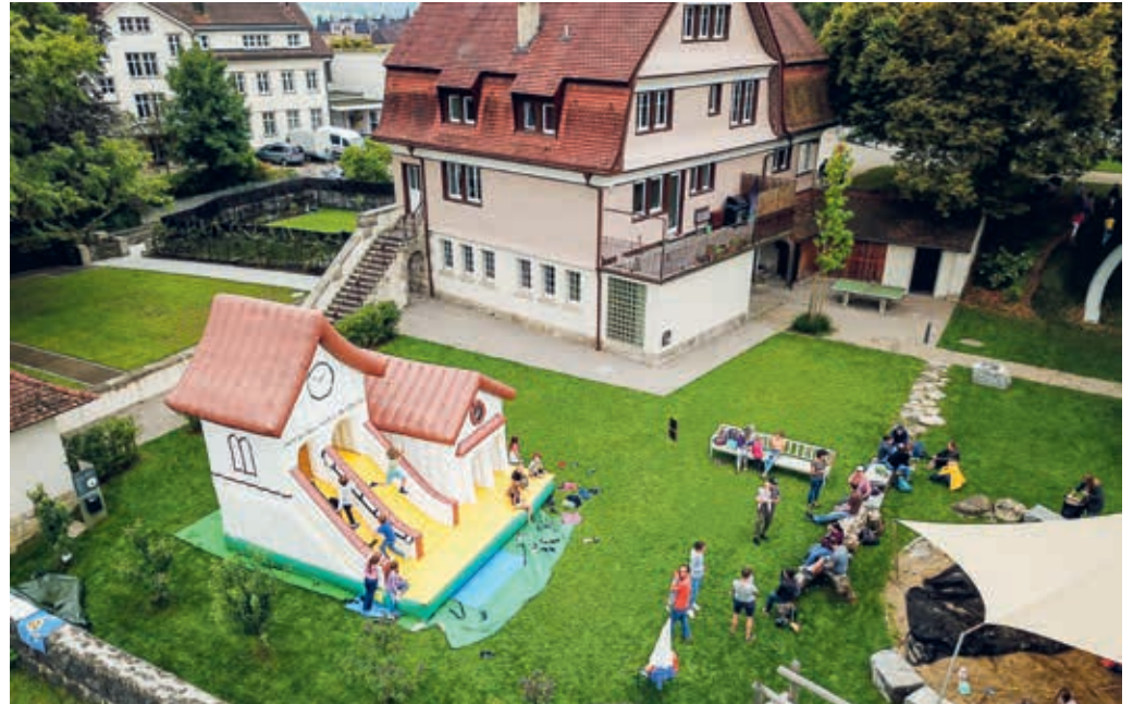
Für den Anlass zur Belebung des Kirchenareals ist die gesamte Bevölkerung herzlich eingeladen.

Seite 6). Dieser soll auch der Startschuss zu weiteren Aktivitäten sein. Die Projektgruppe freut sich deswegen sehr auf den Anlass und möglichst viele Teilnehmende. Besonders freuen sich André Eberle und das Projektteam auch auf die weitere Zusammenarbeit mit der Arbeitsgruppe, die weiterhin bestehen bleibt und fortlaufend Massnahmen entwickeln und umsetzen wird. «Der Arbeitsgruppe gebührt ein grosser Dank. Sie hat das Projektteam grossartig unterstützt.»