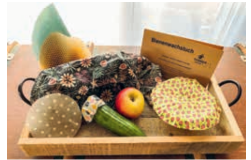
Die praktischen Frischhalte-Tücher mit Bienenwachs.