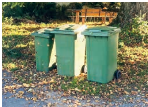
Die Sammlung von Bioabfällen erfolgt seit Anfang April wieder im Wochenrhythmus.

Mit dem Biogas aus Bioabfällen aus der Gemeinde Degersheim kann eine beträchtliche Menge an nachhaltiger Energie erzeugt werden. Die vom normalen Abfall getrennte Entsorgung von Bioabfällen spart nicht nur Kosten bei den Entsorgungsgebühren, sondern trägt ebenfalls zur Schonung der Umwelt bei. Aber nicht nur Gas wird aus den Bioabfällen produziert. Aus den Bioabfällen werden auch Humusersatz oder Startdünger produziert. Die wertvollen Nährstoffe in den Bioabfällen kommen so wieder in die Böden zurück und erhalten das Wachstum der Nutzpflanzen. Noch besteht aber Potenzial: Die gesammelte Menge von Bioabfällen pro Einwohner liegt in Degersheim nach wie vor unter dem Landesdurchschnitt.