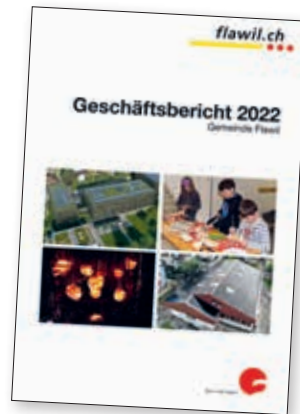
Die Frontseite des Geschäftsberichts 2022 der Gemeinde Flawil.

Der Geschäftsbericht 2022 dient als Grundlage für die Bürgerversammlung, die am Dienstag, 25. April 2023, um 20 Uhr im Lindensaal stattfindet.