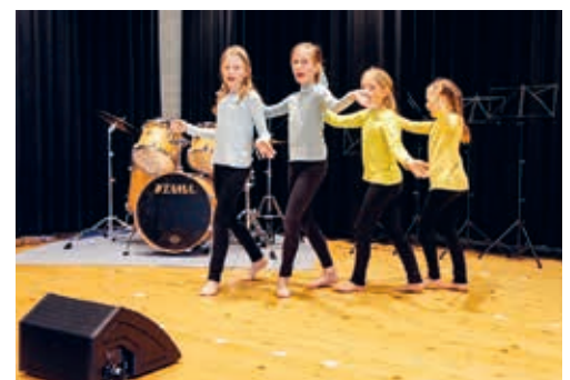
Erleben Sie lustige, leichte Melodien und viel kindliche Spielfreude.

DEGERSHEIM Am Samstag, 25. März 2023 werden mehrere Schülerinnen und Schüler der Musikschule Degersheim ein erstes Mal die Bühne betreten. Sie sind herzlich eingeladen, diesen Moment mitzuerleben. Kommen Sie dazu um 10 Uhr in den Singsaal der Oberstufe und erleben Sie eine neue Ausgabe von «Bühne frei». Lustige, leichte Melodien und viel kindliche Spielfreude werden Sie in die Frühlingstage begleiten.