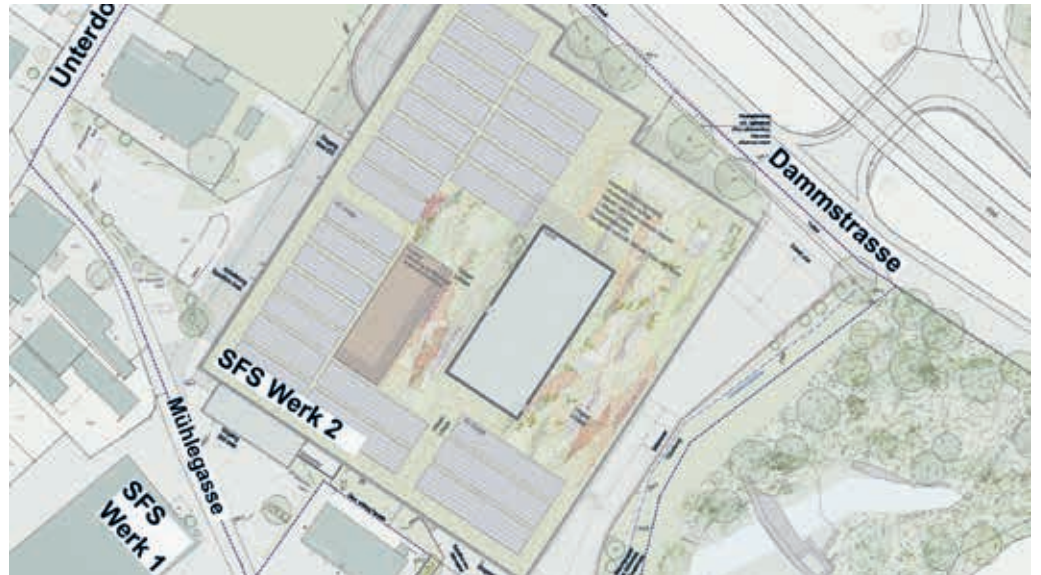
Die SFS plant an ihrem Flawiler Standort einen Erweiterungsbau.

Die geplante Erweiterung des bestehenden Werkes erfordert auch eine Anpassung des Zonenplans. Dadurch wird eine optimale Abstimmung mit dem Sondernutzungsplan erreicht. An der Unterdorfstrasse ist eine bauliche Entwicklung über ein Wettbewerbsverfahren und später über einen se-