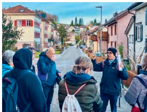
Am 1. April 2023 führt die Chronikstube nochmals eine Dorfführung durch.

DEGERSHEIM Aufgrund des grossen Interesses an den Dorfführungen im vergangenen Herbst bietet die Chronikstube Degersheim einen zusätzlichen Termin an: Am 1. April 2023 um 14 Uhr findet eine weitere Führung zu diesem Thema statt. Ausgangspunkt ist der Stand der Chronikstube an der Gewerbeausstellung in der Mehrzweckanlage Steinegg. Der Unkostenbeitrag zugunsten der Chronikstube beträgt 5 Franken und kann vor Ort beglichen werden. Die Teilnehmerzahl ist auf 20 Personen beschränkt. Interessierte können sich bei Silvan Locher anmelden: silvan.locher@bluemail.ch oder Tel. 071 371 19 60. Die Chronikstube freut sich auf viele Teilnehmende.