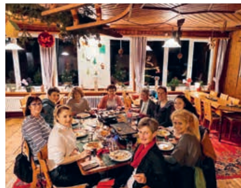
Auch das gehört zum Damenturnverein Flawil: der Weihnachtsanlass.