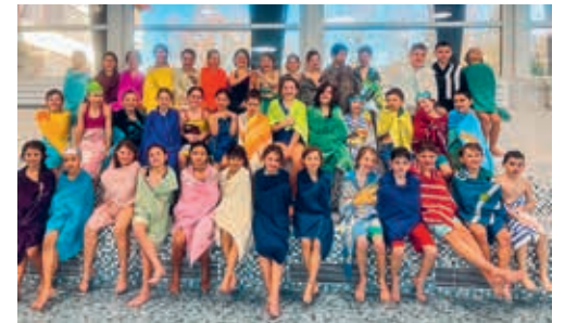
Die Klassen 3a und 3b von der der Steineggsschule haben den Wasser-Sicherheits-Check bestanden.

DEGERSHEIM Nach den Sportferien ging es für die jüngsten Klassen des Steineggschulhauses sportlich weiter. Hochmotiviert besuchten die beiden Klassen 3a und 3b sowie einzelne Repe-tenten aus den 4. Klassen während einer Woche das Schwimmbad in Oberuzwil. Ziel der Woche war es, den Wasser-Sicherheits-Check (WSC) zu bestehen. Zur grossen Freude aller Beteiligten bestanden alle teilnehmenden Schülerinnen und Schüler den Test – Gratulation!