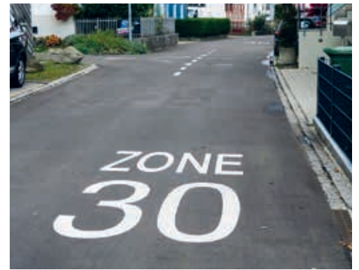
Der Gemeinderat hat eine weitere Tempo-30-Zone in Flawil genehmigt.

Das vom Gemeinderat freigegebene Projekt liegt im Gemeindehaus Flawil, Bahnhofstrasse 6, im 3. Stock beim Anschlagbrett des Geschäftsfelds Bau und Infrastruktur auf. Die Planunterlagen sind auch auf der Mitwirkungsplattform der Gemeinde Flawil, www.mitwirken-flawil.ch , aufgeschaltet. Das öffentliche Mitwirkungsverfahren dauert vom 27. Februar 2023 bis 13. März 2023. Daran können alle teilnehmen. Stellungnahmen