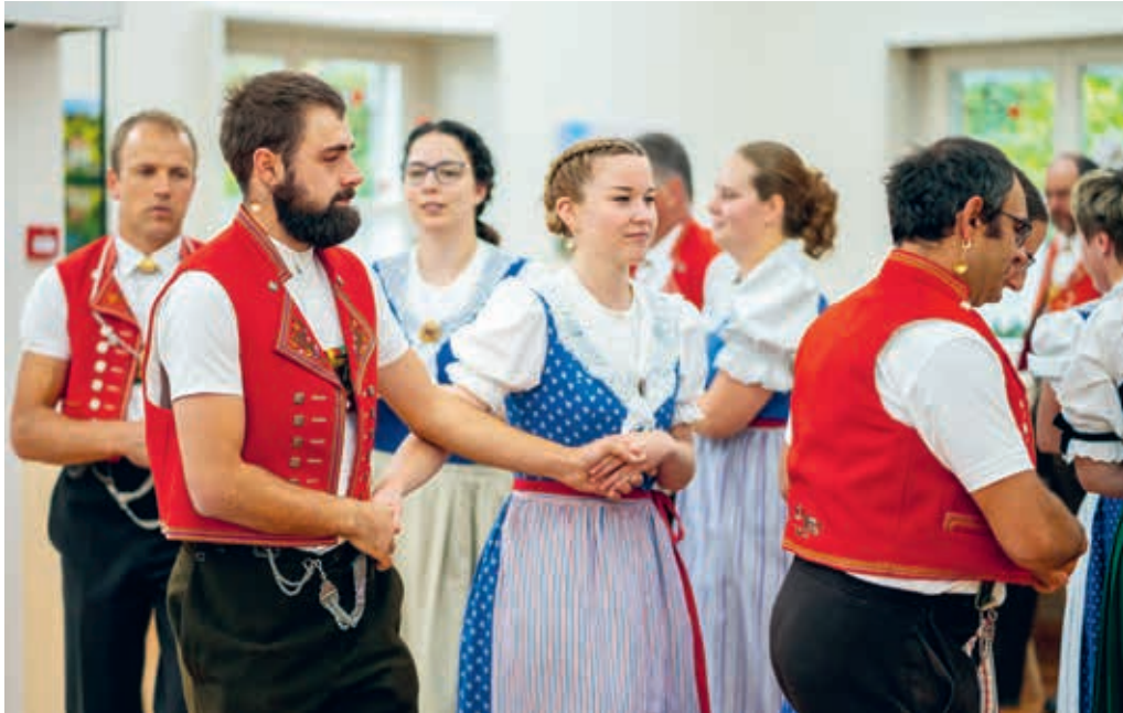
Die Trachtengruppe Degersheim trägt zum Erhalt von Volksbräuchen und Trachten bei.

DEGERSHEIM Mehrere Vereine sorgen in der Gemeinde Degersheim für den Erhalt der kulturellen Traditionen. Nebst dem Jodelchörl und dem Braunviehzuchtverein ist auch die Trachtengruppe in Degersheim in diesem Bereich aktiv und trägt ihren Teil zum gesellschaftlichen Leben bei. Am Samstag, 4. März 2023, führt sie ihren Unterhaltungsabend durch.