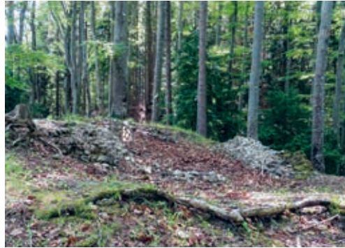
Mauerüberreste der Burg «Landegg»