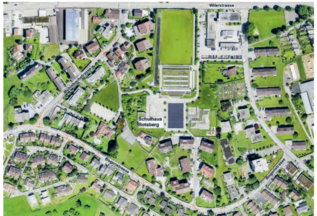
Zur Tempo-30-Zone «Botsberg» gehören die Bogenstrasse und die Mühlebachstrasse.

sind bis spätestens 13. März 2023 via Mitwirkungsplattform ( www.mitwirken-flawil.ch ), per E-Mail an bau-infrastruktur@flawil.ch oder auf dem Postweg an Gemeinde Flawil, Geschäftsfeld Bau und Infrastruktur, Bahnhofstrasse 6, 9230 Flawil, einzureichen. Im Anschluss an das Mitwirkungsverfahren wird die Tempo-30-Zone «Botsberg» nochmals bearbeitet, durch den Gemeinderat genehmigt und anschliessend während 30 Tagen öffentlich aufgelegt.