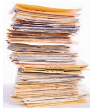
Die Steuererklärung kann vollständig digital eingereicht werden.

Verfügung, wo Steuerfragen von Expertinnen und Experten beantwortet werden.