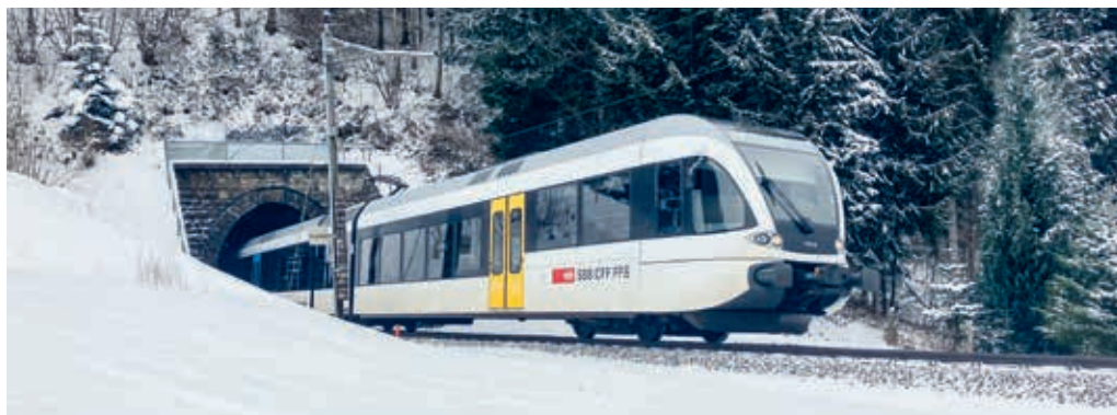
Der Bühlbergtunnel zwischen Degersheim und Schachen soll umfassend saniert werden.

DEGERSHEIM Der Bühlbergtunnel auf der Strecke der SOB zwischen Degersheim und Schachen ist mittlerweile 112 Jahre alt und soll nun umfassend saniert werden. Für das Plan genehmigungsverfahren liegen die Unterlagen vom 30. Januar bis 28. Februar 2023 in der Gemeinderatskanzlei zur Einsicht auf.