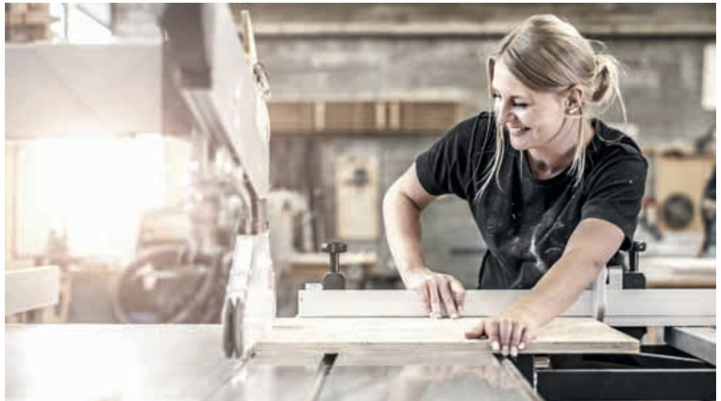
In den vier Jung-Unternehmer-Zentren Flawil, Wil, Gossau und Wattwil werden die Firmengründenden kostenlos beraten.

Selbst die beste Geschäftsidee ist zum Scheitern verurteilt, wenn in der Vorbereitungs- oder Startphase fundamentale Fehler begangen werden. Es ist deshalb von zentraler Bedeutung, dass Existenzgründer frühzeitig und auch in den ersten fünf Jahren nach der Gründung auf ein leicht zugängliches Beratungsangebot zurückgreifen können. In den vier Jung-Unternehmer-Zentren Flawil, Wil, Gossau und Wattwil werden die Firmengründenden kostenlos beraten und können vom grossen Netzwerk für den Start in ihre Selbständigkeit profitieren. Zum Schulungsangebot gehören Themen aus den Bereichen Verkauf, Marketing, Social Media, Werbung, Jahresabschluss sowie Finanzplanung und Controlling. Nebst der Know-how-Vermittlung ist der Austausch unter den Teilnehmenden ein wichtiger Bestandteil der Veranstaltungen. Netzwerkpflege und Firmenbesichtigungen sind ebenfalls wichtige Elemente des Beratungsangebots, welche das Jung-Unternehmer-Zentrum ermöglicht. Das Jung-Unternehmer-Zentrum ist mittlerweile in den sozialen