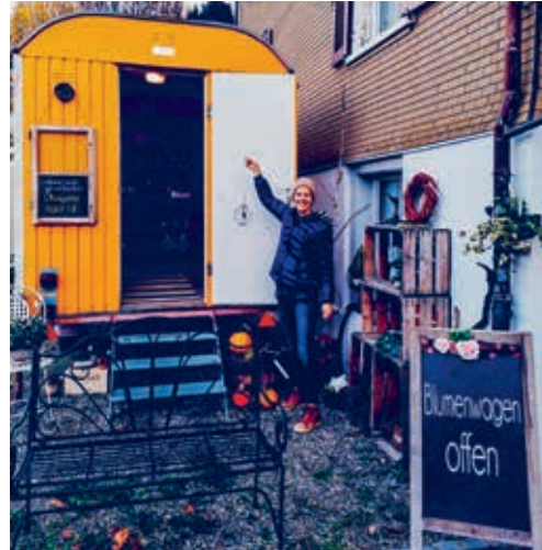
Die Bäckerei «Doris & Dölf» sowie der «Bluemewage» bereichern das Wolfertswiler Dorfleben.

in Wolfertswil seit längerer Zeit keine Einkaufsmöglichkeiten mehr vorhanden waren, sind diese beiden neuen Angebote umso erfreulicher.