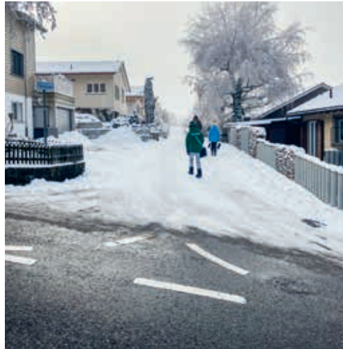
Je nach Klassierung der Strasse erfolgt eine Schwarz- oder Weissräumung.

Schwarzräumung bedeutet, dass eine Strasse vollständig von Schnee und Eis geräumt ist. Diese erfolgt auf den Hauptstrassen nach Flawil, Herisau und Mogelsberg, auf Strassen mit öffentlichen Verkehrsmitteln und Zufahrten zum Bahnhof