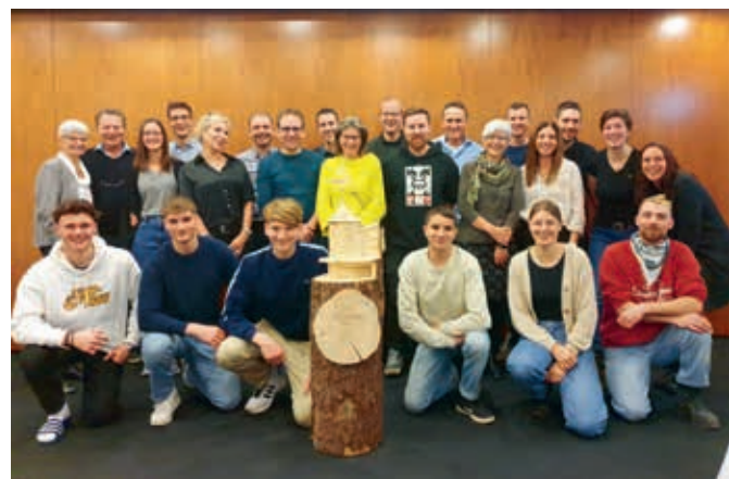
Die ganze Belegschaft war beim zweitägigen Abschlussevent mit dabei. Ein Video der erlebnisreichen Tage finden Sie auf dem Instagramprofil des Türmlihuus, auch via unten aufgeführtem QR Code.