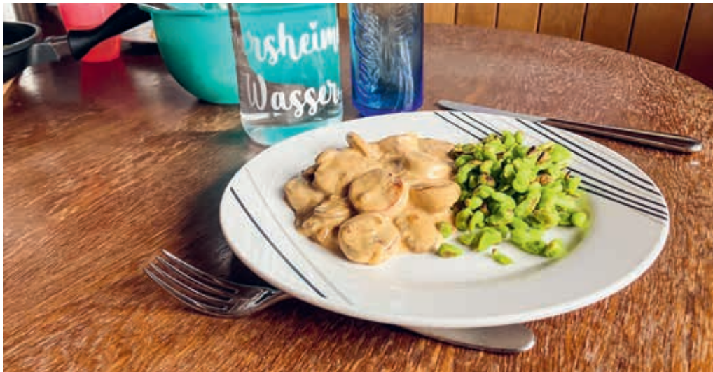
Die Tagesfamilie ist eine alternative Betreuungsmöglichkeit zur Kita oder zum Mittagstisch.

Tarife auch für einkommensschwache Familien erschwinglich. Aktuell ist jedoch ein Rückgang der Nachfrage nach Tagesfamilien zu beobachten: Während für das Jahr 2022 noch rund 3693 Betreuungsstunden in der Gemeinde Degersheim vorgesehen waren, sind es für das Jahr 2023 noch rund 2969 Betreuungsstunden. Somit ist der Bedarf gegenüber dem Vorjahr um rund 20 Prozent gesunken. Ein möglicher Grund für den Rückgang ist die Einführung des Mittagstischangebotes im August 2021. Interessierte finden unter www.tagesfamilien-region-uzwil.ch weitere Informationen zum Angebot.