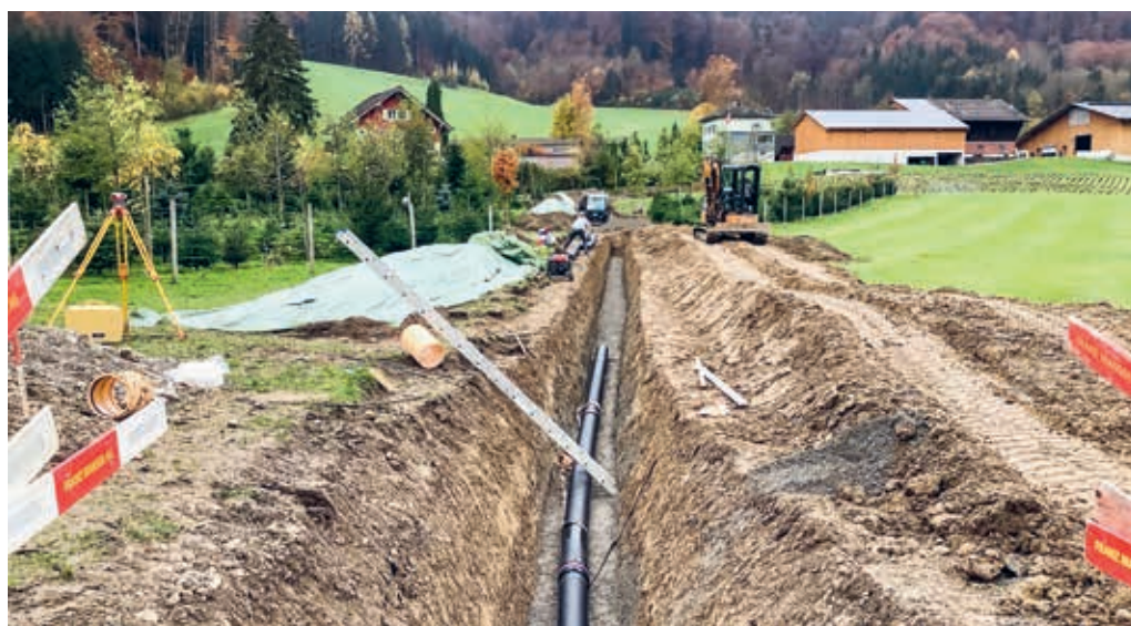
Die Abwassersanierungsarbeiten im Buebental waren aufwendiger und teurer als erwartet.

wände und Verzögerungen hatten Mehrkosten zur Folge, die sich in der Schlussabrechnung nun zeigen. Mit 669 777 Franken liegen die Gesamtkosten rund 36 Prozent über dem ursprünglichen Kostenvoranschlag von 490 000 Franken. Gegenüber dem erweiterten Kostenvoranschlag betragen die Mehrkosten knapp 16 Prozent.