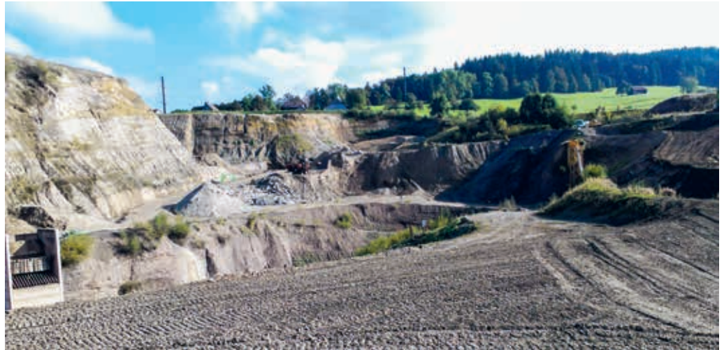
Bis im Jahr 2055 soll die Kiesgrube Tal/Büel wieder vollständig renaturiert werden. Der entsprechende Kiesabbauplan liegt nun öffentlich auf.

Nordöstlich von Degersheim, im Gebiet Tal, baut die Grob Kies AG seit 1982 Kies ab und betreibt das Kies- und Betonwerk Tal, welches die regionalen Bauunternehmungen mit Kies und Beton versorgt. Nach dem Abbau von Kies muss das Gelände mit sauberem Aushub wieder aufgefüllt und anschliessend rekultiviert werden. Deponieraum in den bewilligten Auffüllstellen und Deponien in der Region ist knapp geworden, der diesbezügliche Bedarf ist in den letzten Jahren jedoch stetig gestiegen. Die Endgestaltung im Abbaugebiet Tal wurde deshalb zu einer Vollauffüllung überarbeitet. Dabei soll das Gelände so gestaltet werden, dass es den landwirtschaftlichen, ökologischen und landschaftsgestalterischen Interessen bestmöglich entspricht. Waldflächen werden aufgeforstet, Hecken und Magerwiesen angepflanzt sowie Trockenstandorte angelegt. Die Projektänderung zielt ausschliesslich auf die erwähnte Anpassung der Endgestaltung mit Vollauffüllung ab. Die bewilligte Abbaumenge bleibt gleich, es wird also nicht mehr Material abgebaut,