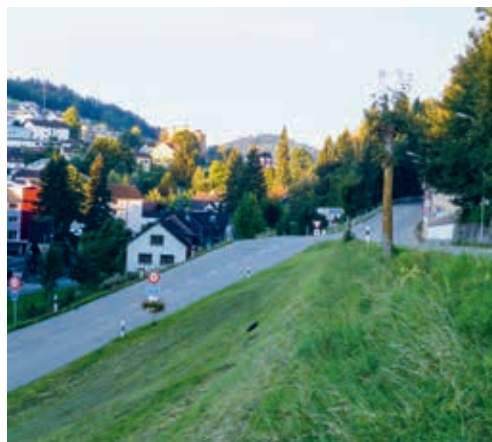
Entlang der Degersheimer Kantonsstrassen sind keine Massnahmen zur Reduktion der Lärmbelastung nötig.

wie sie ist. Aus der Gemeinde Degersheim ging im Rahmen des durchgeführten Mitwirkungsverfahrens vom 11. April bis 11. Mai 2022 (siehe FLADE-Ausgabe vom 8. April 2022) keine Stellungnahme ein. Das Baudepartement hat das Lärmsanierungsprojekt mittlerweile beschlossen und sich von der Lärmsanierungspflicht erleichtert. Der Entscheid des Baudepartementes wird vom 18. Januar bis 17. Februar 2023 öffentlich aufgelegt.