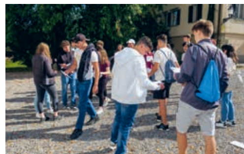
Jugendliche beim Starttag