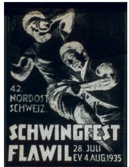
Plakat des Schwingfestes von 1935.