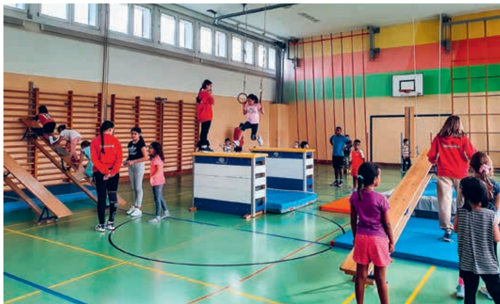
Das Hallenteam bietet den Primarschulkindern abwechslungsreiche Bewegungs- und Spielmöglichkeiten.

Nach der Weihnachtspause startet das «OpenSunday» Flawil am Sonntag, 15. Januar 2023, in die zweite Saisonhälfte. Bis Anfang April 2023 können sich Primarschulkinder mit oder ohne Beeinträchtigung wieder an Sonntagnachmittagen in der Turnhalle Enzenbühl treffen und sich gemeinsam sportlich betätigen. Die Halle ist jeweils von 13.30 bis 16.30 Uhr geöffnet. Ein gesunder Zvieri rundet das Angebot ab. Eine Anmeldung ist nicht erforderlich. Mitzubringen sind Turnkleidung, Sportschuhe, Trinkflasche sowie die Telefonnummer der Eltern. Auch in der zweiten Saisonhälfte gibt es den einen oder anderen Höhepunkt. So findet am Sonntag, 5. Februar 2023, ein Spezialanlass mit dem Tennisclub Flawil statt.