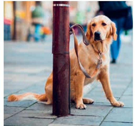
Die jährliche Hundetaxe beträgt Fr. 120.00 pro Hund.

DEGERSHEIM Hunde, die älter als fünf Monate sind, müssen bei der Hundekontrolle gemeldet werden. Bitte melden Sie sich innerhalb von 14 Tagen beim Einwohneramt (Hundekontrolle), sofern Sie noch nicht als Hundehalter oder Hundehalterin im AMICUS registriert sind.