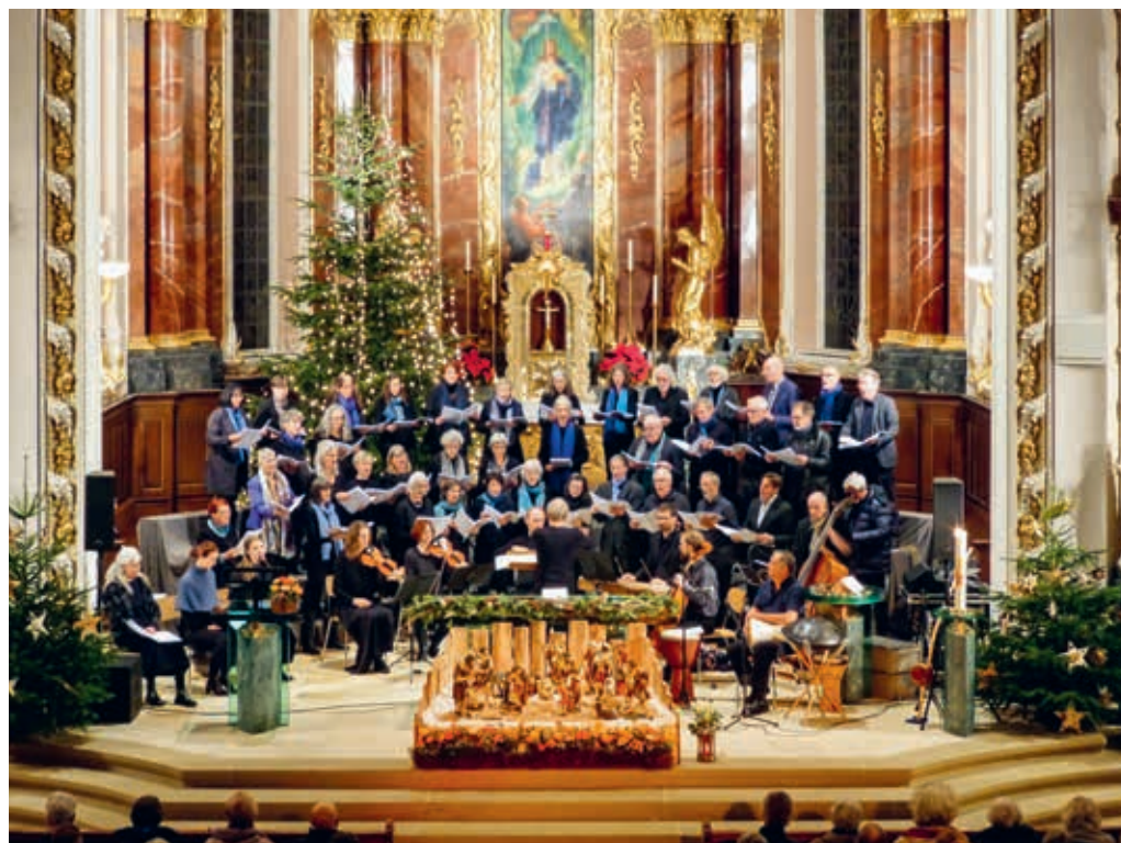
Die Aufführenden überzeugten das Publikum mit einer beeindruckenden Darbietung der «Missa Gaia».