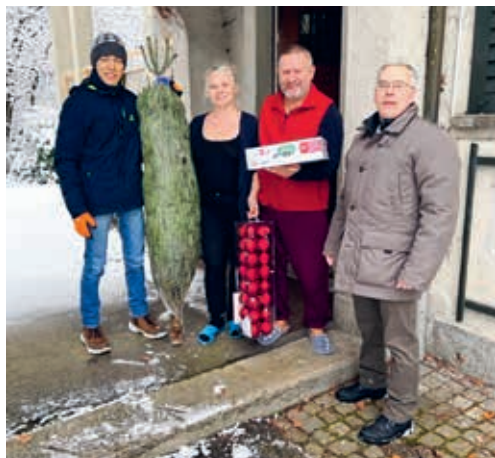
Grosse Freude am Tannenbaum mit Baumschmuck.