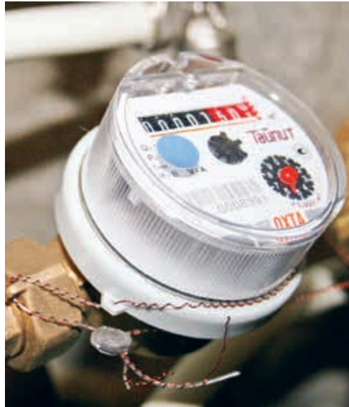
Das Degersheimer Trinkwasser hat im Jahr 2022 stets den Anforderungen entsprochen.

Inspektionen im Bereich Trinkwasser werden regelmässig durchgeführt, wobei jeweils an unterschiedlichen Stellen innerhalb des Trinkwasser-netzes Proben entnommen werden. Im Labor des Amtes für Verbraucherschutz und Veterinärwesen in St.Gallen wird das Wasser auf die bakteriologische Qualität hin untersucht. Sämtliche im Jahr 2022 durchgeführten Kontrollen des Degersheimer Trinkwassers zeigen, dass es bedenkenlos getrunken werden kann und es stets den gesetzlichen Anforderungen entspricht.