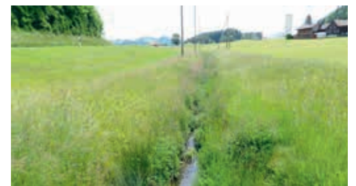
Sämtliche kontrollierten Landwirtschaftsbetriebe haben die Abstandsvorgaben eingehalten.

Wenn Gülle oder Pflanzenschutzmittel in Gewässern oder Mooren gelangen, sind Fische und andere Wasserlebewesen gefährdet. Zudem bleibt das Gewässer für lange Zeit vergiftet. Auch in anderen wichtigen Lebensräumen für Wildpflanzen und Kleintiere wie Uferbereichen, Waldrändern oder Hecken hat Dünger nichts verloren. Deshalb müssen beim Bewirtschaften von Landwirtschaftsland die Abstände zu Gewässern, Hecken, Feld- und Ufergehölzen oder Waldrändern eingehalten werden. Wer innerhalb dieser sogenannten Pufferstreifen gegen die Düngevorschriften verstösst, nimmt Bussen und Kürzungen von Direktzahlungen in Kauf. Für die Kontrolle der Pufferstreifen sind die Gemeinden zuständig. Der Gemeinderat Degersheim hat mit der spezialisierten Kontrolldienst KUT AG eine Vereinbarung zur Ausführung der Kontrollen abgeschlossen. Diese hat nun ihren Kontrollbericht für das Jahr 2022 vorgelegt. Der Gemeinderat ist erfreut darüber, dass bei allen kontrollierten Betrieben in der Gemeinde Degersheim keine Mängel festgestellt wurden. Ihm ist es jedoch ein Anliegen, dass nicht nur Landwirtschaftsbetriebe einen vorsichtigen Umgang mit Düngemitteln und Herbiziden pflegen. Auch im Privatbereich sollten solche Mittel nur zurückhaltend und gemäss Anweisung erfolgen.