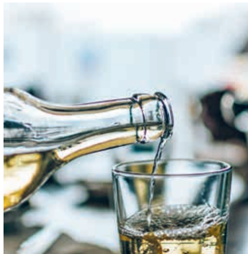
Der Jugendschutz im Alkohol- und Tabakverkauf ist wesentlicher Bestandteil der Suchtprävention.

Verkaufspersonen jedoch ein Rechnungsfehler, weshalb dennoch Alkohol an eine minderjährige Person verkauft wurde. In sämtlichen anderen Betrieben wurden die Jugendschutzbestimmungen tadellos umgesetzt.