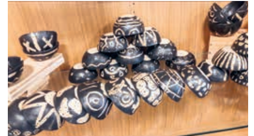
Die handgetöpferten und mit heisser Suppe gefüllten Schalen können am Samstag, 17. Dezember, gekauft werden.

DEGERSHEIM Vor über 20 Jahren starteten Töpfer das Projekt «Empty bowls». Handgetöpferte Schalen werden mit Suppe gefüllt, verkauft und der Erlös wird für Menschen, die Hunger leiden, eingesetzt. Die 3. Realklasse der Oberstufe Degersheim hat sich intensiv mit dieser Idee auseinandergesetzt. Mit viel Elan haben sich die Jugendlichen an die Arbeit gemacht. Sie haben sich zum Ziel gesetzt, 100 Schalen herzustellen. Nun sind die Schalen getöpfert, glasiert und für den Verkauf bereit. Am Samstag, 17. Dezember, von 11.00 bis 14.00 Uhr können Interessierte die mit heisser Suppe gefüllten Schalen zum Preis von 15 Franken kaufen. Der Gesamterlös wird für die Sternenwoche vom Unicef gespendet. Der Verkauf findet vor dem Café Marion statt. Es bietet sich die Möglichkeit, die Suppe im Wintergarten des Cafés zu geniessen. Die Jugendlichen freuen sich auf viele Besucherinnen und Besucher.