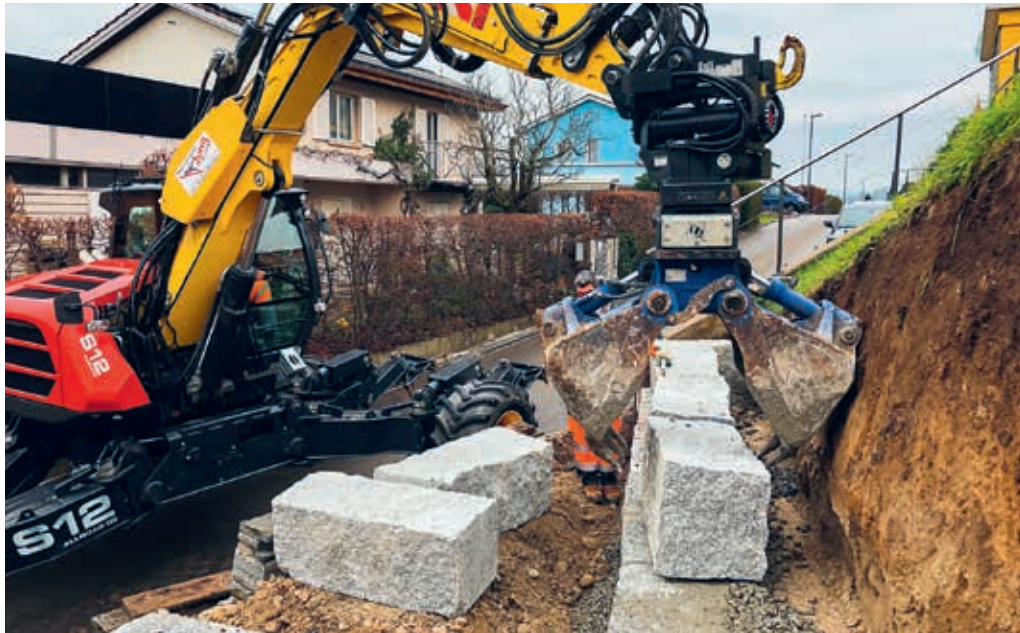
Zur Verbesserung der Sichtzone wurde eine Böschung abgetragen und eine zurückversetzte Stützmauer errichtet.

Entscheid über die Einsprachen zur Tempo-30-Zone «Obere Weidegg» aufgeschoben. Aufgrund der guten Erfahrungen in den anderen Sektoren wird nun auch der letzte übrig gebliebene Sektor 6 dem Flawiler Parkplatzreglement unterstellt. Die Verfügung der Erweiterten Blauen Zone in Sektor 6 wurde durch das Polizeikommando des Kantons St. Gallen Anfang Oktober 2022 erlassen. Die Markierungen und Signalisationen der EBZ in Sektor 6 werden im neuen Jahr angebracht.