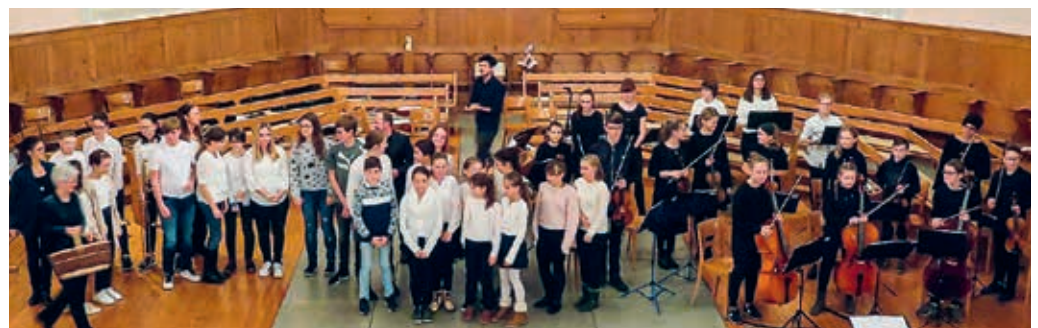
In der Kirche Oberglatt bieten verschiedene Ensembles der Musikschule ein stimmungsvolles Adventskonzert.

ensemble, das Blechbläser- und das Blockflötenensemble, der Kinder- und Jugendchor, Harfe und Consuono, das junge Orchester Flawil Degersheim. Das Publikum ist eingeladen zum Geniessen der schönen Musik und auch zum gemeinsamen Singen. Die Schülerinnen und Schüler mit ihren Lehrpersonen bereiten sich intensiv auf das Konzert vor. Sie freuen sich auf einen vorweihnächtlichen Konzertabend und laden die Flawiler Bevölkerung herzlich ein in die schöne Kirche Oberglatt.