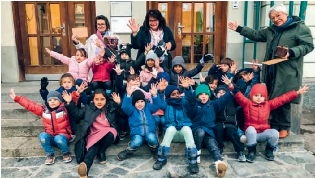
Die stolzen Schülerinnen und Schüler des Einschulungsjahres nach der Übergabe des Erlöses aus dem Weihnachtsverkauf.

FLAWIL Die Schülerinnen und Schüler des Einschulungsjahres im Schulhaus Hinterer Grund haben am Weihnachtsmarkt im Lindengut teilgenommen. Aus dem Verkauf von vielen kleinen Kostbarkeiten und feinen Überraschungen kam eine stolze Summe zusammen.