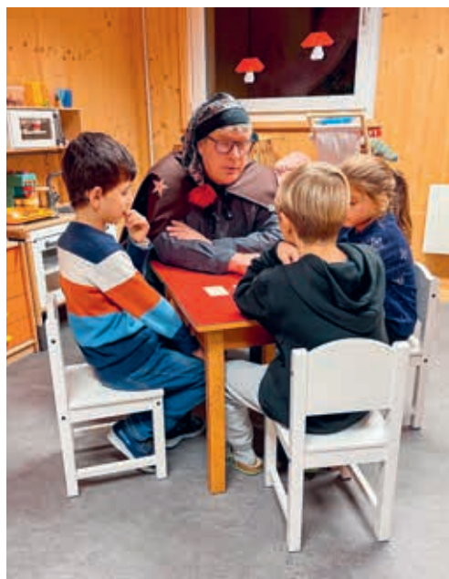
Die Kinder konnten bei verschiedenen Aktivitäten zum Thema Verwandlung teilnehmen.

Die Schülerinnen und Schüler des Schulhauses Sennrüti kamen anlässlich der Erzählnacht abends zur Schule. Sie fanden zum Thema Verwandlung verschiedene Posten vor, die sie im Laufe des Abends besuchen durften. Sogar der Estrich des Schulhauses war geöffnet und die mutigen Kinder machten sich mit Taschenlampen auf die Suche nach der Fledermaus und ihren Freunden. In den unteren Etagen wurde gezaubert, Geschichten gelauscht, gebastelt, gemalt, geknetet und getanzt. Die Kinder konnten sich auch nach eigenen Wünschen schminken lassen und verkleiden. Für das leibliche Wohl sorgte nebst dem mitgebrachten Znacht die Verwandlung von Maiskörnern zu Popcorn und die Verwandlung vom Wasser zum Süssgetränk an der Sirupbar.