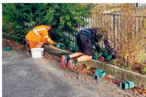
Für die Instandhaltung der Anlagen ist gut ausgebildetes Personal nötig.

Beurteilung war positiv und deshalb ist Degersheim die erste Gemeinde des Kantons St.Gallen, welche die Ausbildungsbewilligung für die Fachrichtung Sportanlagen erhalten hat. Die Ausschreibung der Lehrstelle für den Sommer 2023 ist in der aktuellen FLADE-Ausgabe ersichtlich.