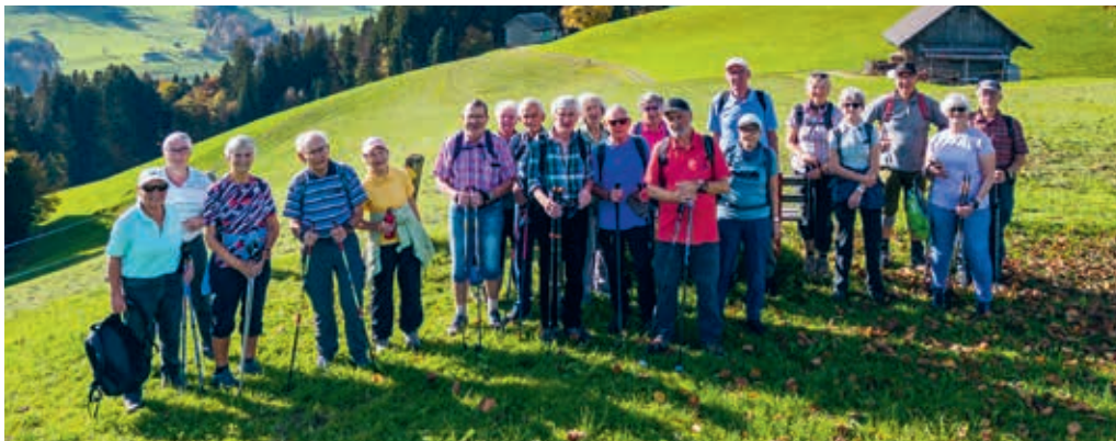
Gruppe «60 plus Aktive» der Reformierten Kirchgemeinde Flawil.