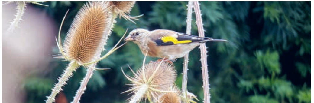
Junger Distelfink ohne rote Kopfplatte.

Um im FLADE-Blatt zu werben, gibt es so viele Möglichkeiten wie Schals für die kalte Jahreszeit.