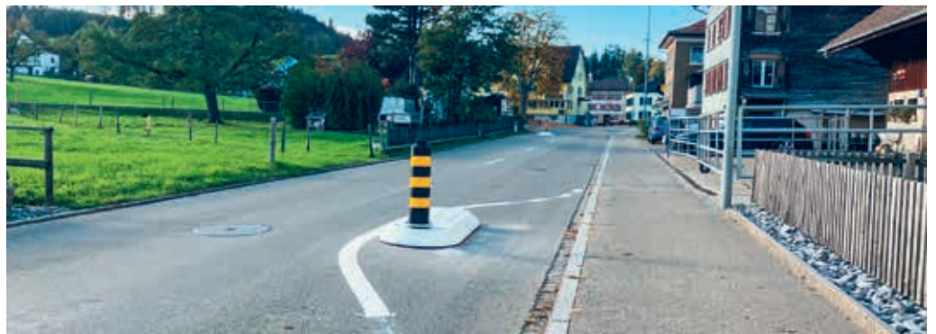
Die Verkehrsinseln sorgen für mehr Sicherheit an der Postautohaltestelle Wolfertswil.

WOLFERTSWIL Die angekündigten Massnahmen zur Erhöhung der Sicherheit an der Postautohaltestelle Wolfertswil wurden während der Herbstferien umgesetzt. Die beiden neu installierten Inseln bei der Bushaltestelle bezwecken, dass das stehende Postauto nicht mehr überholt werden kann. Auch ist damit sichergestellt, dass sich nähernde Fahrzeuge ihre Fahrgeschwindigkeit reduzieren müssen. Für die Überquerung der Hauptstrasse sind an der sichersten Stelle neu farbige Flächen auf beiden Strassenseiten eingezeichnet. Dank dieser Massnahmen ist das Unfallrisiko an der Postautohaltestelle markant reduziert.