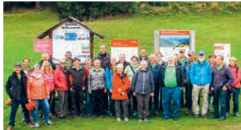
Reisegesellschaft auf Brambrüesch

Das nächste Reiseziel nach dem Mittagessen im Alten Bad Pfäfers war Chur. Beim kurzen Fussmarsch zur Talstation der Brambrüeschbahn