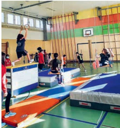
An 18 Sonntagnachmittagen steht allen Primarschulkindern die Turnhalle Enzenbühl für Spiel, Sport und Spass zur Verfügung.

Die Tage werden kälter, draussen ist es oft nass und neblig: Der Herbst ist da – und damit auch wieder das Bewegungsprojekt «OpenSunday» Flawil. Nach einer erfolgreichen ersten Saison startet «OpenSunday» am 30. Oktober 2022 in die zweite Saison. Bis Anfang April 2023 können