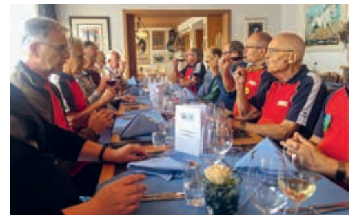
Kameradschaftspflege beim Mittagessen im Gasthof Brücke in Hagneck.

Am Folgetag besuchte die Männerriege die beispielhaft in die Natur eingegliederten Fischtreppen beim neuen Wasserkraftwerk Hagneck. Die Anlage bietet unterschiedliche Wassermengen und Wassergeschwindigkeiten. Diese ermöglichen es den 23 beobachteten Fischarten, naturgerecht aus dem Bielersee in der Aare aufwärtszuwandern und Laich ablegen zu können. Zum Abschluss der Reise wurde das Weinfest in Ligerz besucht, wo nach kundiger Führung im Museum eine Verkostung des jung getrunkenen Schafis unumgänglich war. Thomas Gebert