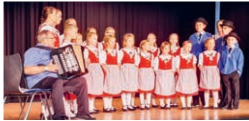
Kindertrachtenchor Fürstenland am Seniorenachmittag.

Jodelfest in Appenzell besucht hätten. Mit «Lass Sorge Sorge si!» boten sie nun das gut bewertete Festlied dar. Vor der Pause ertönte «Tue dini Seel lo bambele lo». Jedes Lied wurde mit kräftigem Applaus bedacht. Die Kinder sangen fröhlich und mit bemerkenswert deutlicher Aussprache. Zum Abschluss boten sie ältere und neuere bekannte Lieder dar. Die Anwesenden genossen den Nachmittag in vollen Zügen. Rosmarie Keil-Neuhaus