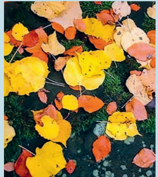
Bild: Basalt, Moos und Herbstlaub. Rhön, 11.10.2008

Ich wünsche Ihnen so bereichernde Gespräche!