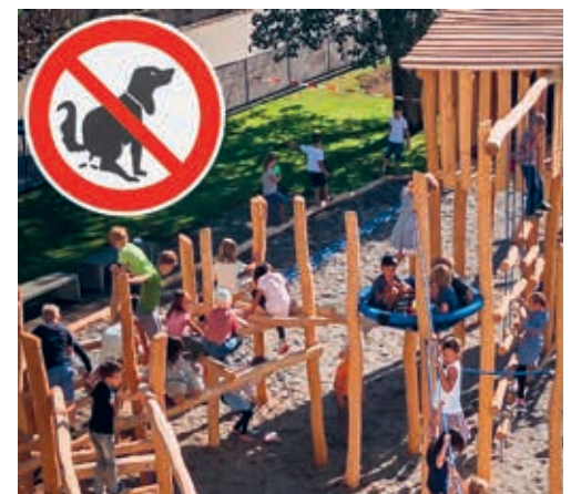
Die Spielplätze sollen frei von Hundekot bleiben.

chen, welche die Reinigungsteams der Schulhäuser auf den Pausenplätzen zusammenlesen müssen. Die Gemeindeverwaltung bittet alle Hundehalterinnen und Hundehalter, sich an die geltenden Regeln zu halten und mit ihren Hunden Schulhaus-, Spiel- und Sportplätze möglichst zu meiden sowie den Hundekot zu beseitigen.