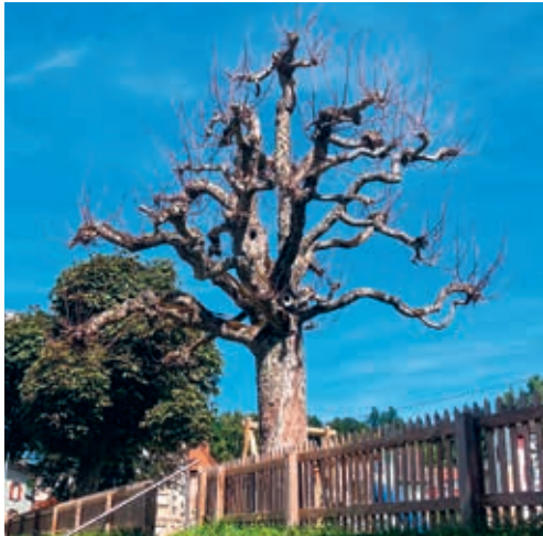
Die abgestorbene Rosskastanie wird während der Herbstferien durch einen jungen Baum ersetzt.

DEGERSHEIM Eine Rosskastanie auf der Schulanlage Sennrüti in Degersheim ist während des Sommers leider abgestorben. Nun wird sie gefällt und durch einen passenden Jungbaum ersetzt.