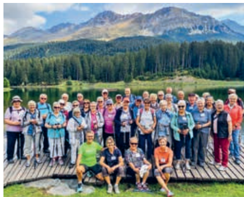
Die Flawiler Seniorengruppe verbrachte eine wunderschöne Ferienwoche in der Lenzerheide.