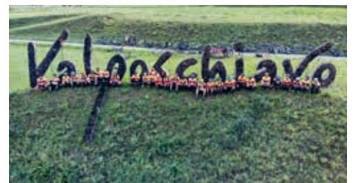
Krüger Radteam im Val Poschiavo (Puschlav).