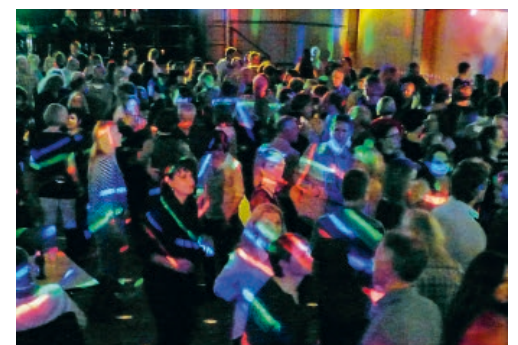
Die Flawiler Oldies Disco wechselt ins Werk 1 der Flawa.