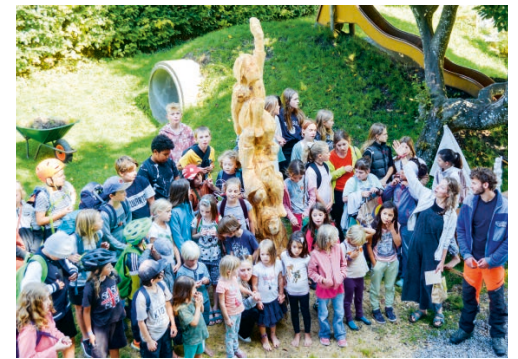
Die Schulkinder mit der neuen Holzskulptur.