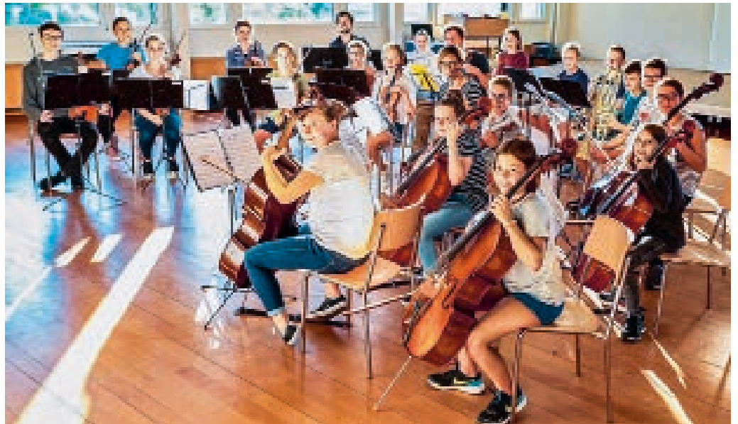
Die Musikerinnen und Musiker des Jugendorchesters freuen sich auf ihren Auftritt.

Für sein neuestes Konzertprogramm hat das Orchester Werke aus dem Bereich der Filmmusik ausgewählt. Zur Aufführung kommen Klassiker genauso wie selten gespielte Titel. Auf dem Programm steht beispielsweise Musik zu «Cinema Paradiso», «Schindler's List», «Die Kinder des Monsieur Mathieu», «Wie im Himmel», «Chocolat» oder zu «The greatest Showman». Das Orchester präsentiert Solisten aus den eigenen Reihen. Es wird aber auch wieder mit zahlreichen Gästen ergänzt. Mit dabei sein werden Bläser-Solistinnen, Perkussion, Harfe und das Gitarrenensemble der Musikschule Flawil. Ein