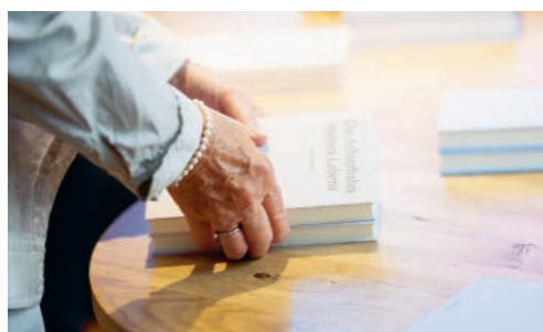
Edition Unik sucht Autorinnen und Autoren aus Flawil und Degersheim.

Das Schweizer Kulturprojekt «Edition Unik» befähigt Menschen dazu, Erinnerungen aus ihrem Leben in einer eigens entwickelten Software aufzuschreiben und daraus ein eigenes Buch zu gestalten. Das Projekt wurde im Jahr 2015 gestartet und verläuft sehr erfolgreich: Seit Beginn sind bereits 655 Bücher entstanden. Das Ziel des Projekts ist es jedoch, dass aus jeder der 1402 Deutschschweizer Gemeinden ein Buch erscheint. Aus den Gemeinden Degersheim und Flawil ist noch kein Beitrag dabei. Deswegen ruft Edition Unik Interessierte dazu auf, sich für das Projekt zu melden. Das Projekt verläuft in drei Etappen. Zuerst sammeln oder erstellen die Teilnehmerinnen und Teilnehmer Notizen über den Inhalt. Danach beginnt die Formulie-