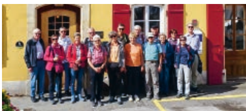
Die Kiwanis-Wanderer vor dem Hôtel de l'Aigle in Couvet.