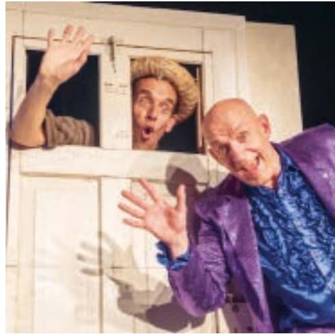
Das Duo «Oropax» präsentiert seine neue Show.