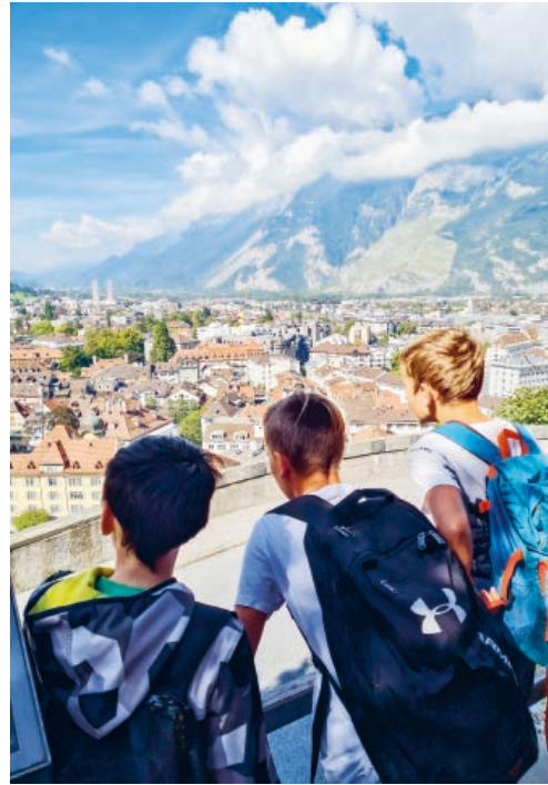
Die Schülerinnen und Schüler verbrachten eine Woche in der Umgebung von Chur.

gewünscht, sanft mit Musik geweckt, bevor sie müde, aber zufrieden zurück nach Degersheim reisten. Die Klasse blickt auf ein gelungenes und erlebnisreiches Klassenlager zurück.