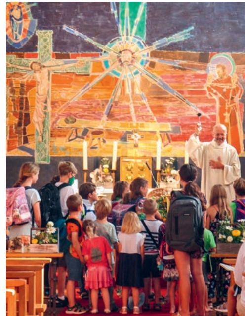
Schulanfangsgottesdienst in Wolfertswil 2021