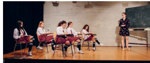
Mit der Krimikomödie «Falscher Ort – falsche Zeit» begeisterten die Schülerinnen und Schüler der 3. Oberstufe das Publikum.

Testpublikum zur Hauptprobe ein und durften eine gelungene Aufführung miterleben. Nun stand den beiden öffentlichen Aufführungen im Singsaal nichts mehr im Weg. Die Beteiligten sorgten nicht nur auf und hinter der Bühne für gute Unterhaltung, sondern sorgten auch für das leibliche Wohl der Gäste bei einem Apéro in der Pause. Ganz besonders genossen die Schauspielerinnen und Schauspieler jedoch die Reaktionen der zahlreichen Zuschauerinnen und Zuschauer während des Stücks. Diese brachten sie dazu, ihre Rollen noch überzeugender zu spielen. So zeigten sich alle Beteiligten noch ein letztes Mal von ihrer besten Seite, bevor sie nach den Sommerferien ihren eigenen Weg gehen. Nicht nur die prägenden Aufführungen werden den Schülerinnen und Schülern in Erinnerung bleiben, sondern auch der gewachsene Zusammenhalt kurz vor Schulabschluss.