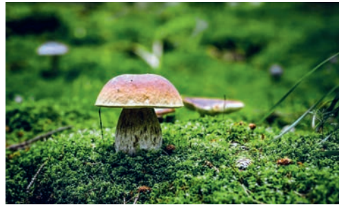
Am 21. August 2022 beginnt für die Pilzsammlerinnen und Pilzsammler die Hauptsaison.