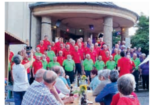
Spontan gebildete Formationen von Sängerinnen und Sängern gaben auf der Treppe der Kirche Feld noch einige Lieder zum Besten.