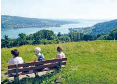
Die Frauen genossen die herrliche Weitsicht in die Bodenseeregion.

VEREIN Mitte Juni war es so weit: 44 frohge-launte Frauen starteten den Jahresausflug der Frauengemeinschaft (FG) Flawil bei schönstem Wetter. Via Wuppenau und Müllheim ging es mit dem Reisebus durch den schönen Thurgau zum Restaurant Klingenzellerhof oberhalb Eschenz. Die Frauen genossen dort die Kaffeepause und auf dem nahen Aussichtspunkt die herrliche Weitsicht über die Bodenseeregion. Das Mittagessen mundete sehr in Keller's Winzerstube in Hallau, bevor es weiter nach Neuhausen am Rheinfall ging. Dort konnten die Teilnehmerinnen wählen zwischen einem Besuch der Miniaturwelt Smilestones oder der Rhyality Show «Der Rheinfall in vier Jahreszeiten». Auch hier gab es genug freie Zeit zur Verfügung, um nach Lust und Laune diesem schönen Flecken Erde zu fröhnen. Danach ging es zurück nach Flawil. Die FG Flawil dankt an dieser Stelle dem freundlichen Chauffeur herzlich für die angenehme Fahrt.