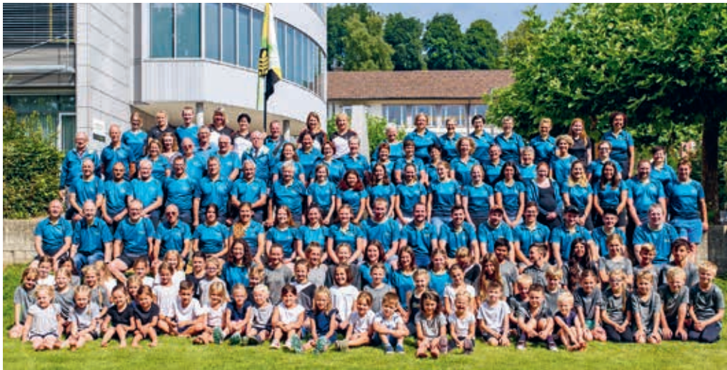
Der TV Degersheim besteht aus über 250 Mitgliedern und wurde nun zum vierten Mal mit dem Label «Sport-Verein-t» ausgezeichnet.

Auszeichnung Ende April 2022 zum vierten Mal in Serie erhalten. Der Verein besteht aus über 250 Mitgliedern und leistet seit vielen Jahren einen wertvollen Anteil an das Vereinsleben in der Gemeinde. Der Gemeinderat ist über die erneute Auszeichnung sehr erfreut. Er ist sich bewusst, dass das Erfüllen der hohen Anforderungen eine Herausforderung für den Turnverein darstellt und bedankt sich bei allen Involvierten ganz herzlich für die geleistete Arbeit.