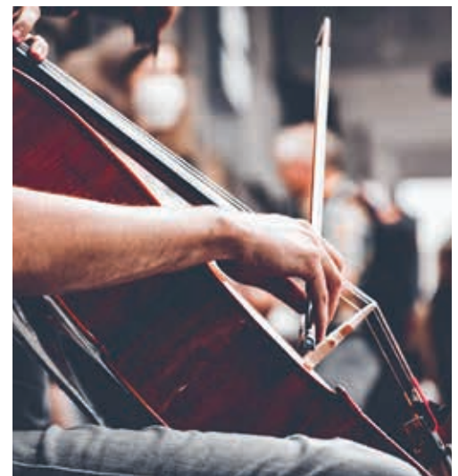
Das Cello-Ensemble nimmt am Musikschulkonzert vom 17. September 2022 teil.

Während dreier Proben leitet Marianne Leuenberger das kammermusikalische Musizieren an. Die Teilnehmenden erlernen ein Repertoire, welches am 17. September 2022 an einem Musikschulkonzert zur Aufführung kommt. Der Kurs richtet sich an Personen jeden Alters, die Lust auf ungezwungenes Zusammenspiel haben und über ausreichend Spielerfahrung auf dem Cello verfügen, damit sie die Stücke vor den Proben individuell einüben können. Der Kurstarif beträgt für Schulpflichtige der Gemeinde Degersheim 33.60 Franken, für Auswärtige und Erwachsene 78.40 Franken. Details zum Kurs und Anmeldebögen finden Sie unter www.schule-degersheim.ch → Musikschule → News. Anmeldeschluss ist der 15. August.