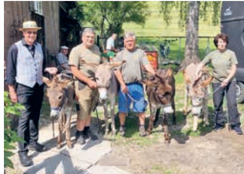
Die Turngruppe besuchte die Esselfarm im Bootsbergerriet.

haltung. Schon brutzelten die feinen Würste über der Glut und die eisgekühlten Getränke löschten den Durst hervorragend. Hans Künzler dankte den vielen Helfern für ihren Einsatz. Nur durch ihr Engagement konnten die Ü60-Turner diesen gelungenen Abschluss vor den Sommerferien geniessen. Ernst Werner