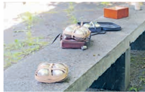
Warten im lichten Schatten – Boules, bereit für den Einsatz.