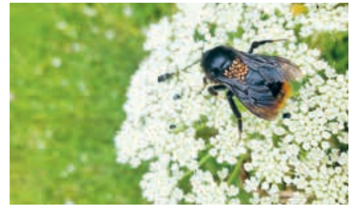
Die Blauschwarze Holzbiene.

VEREIN Jeder kennt die Honigbiene. Doch nur wenige wissen, dass sie nur eine von etwa 600 einheimischen Bienenarten ist. Die Wildbienen nehmen in der Natur eine Schlüsselrolle ein, denn sie sind sehr effiziente Bestäuberinnen und sorgen dafür, dass Kultur- und Wildpflanzen Samen bilden können. Für die Biodiversität sind sie damit unersetzlich und so sollte es uns nachdenklich stimmen, dass aktuell jede zweite Wildbienenart gefährdet ist. Dass es den Bienen so schlecht geht, hat vor allem mit dem fehlenden Nahrungsangebot und dem Verschwinden von geeigneten Strukturen für die Eiablage zu tun. Alle können einen Beitrag leisten, um den Wildbienen zu helfen: Einerseits durch möglichst viele blühende einheimische Pflanzen in den Gärten und auf dem Balkon. Andererseits, indem Sand-linsen für die Eiablage angelegt werden. Weitere Infos unter www.nvflawil.ch .