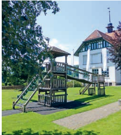
Der Spielplatz Sennrüti wird bis im September neu gestaltet und mit neuen Spielgeräten versehen.

Die Spielgeräte auf der Sennrütiwiese haben das Ende ihres Lebenszyklus erreicht und erfüllen die Sicherheitsanforderungen nicht mehr. Aus diesem Grund nahm eine Arbeitsgruppe, bestehend aus Kindergarten- und Primarschullehrpersonen, die Neugestaltung des Spielplatzes in Angriff. Sie definierte die Anforderungen, die ein zeitgemässer, kindgerechter Spielplatz erfüllen muss, und holte die entsprechenden Offerten ein. Nach der Planungsphase wurde diese Woche die Bauphase an die Hand genommen. Diese wird noch bis Ende September 2022 andauern. Erst dann wird der Spielplatz vollständig erneuert sein. Während der Erneuerungsarbeiten muss der Spielplatz leider gesperrt bleiben.