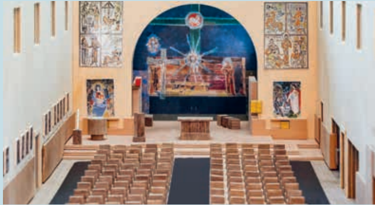
Modell der neugestalteten Kirche.

Projektgruppe vertieft mit der Sanierung auseinandergesetzt und ein Projekt erarbeitet. Die Bürgerschaft wird am 10. April 2022 schriftlich darüber abstimmen.