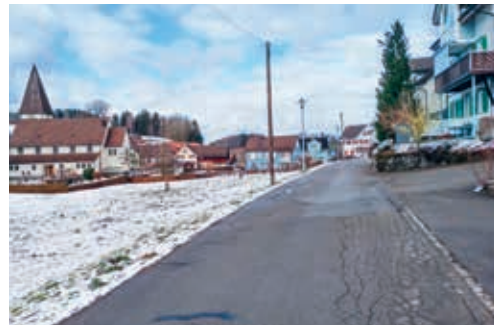
Im Rahmen der öffentlichen Mitwirkung zur Sanierung der Böhlstrasse liessen sich vier Parteien vernehmen.

signalisation, zum Tempo und zur Beleuchtung. In der Folge hat der Gemeinderat dem planenden Ingenieurbüro den Auftrag erteilt, das Projekt in verschiedenen Punkten anzupassen. Sobald das überarbeitete Projekt vorliegt, wird der Gemein- derat über dieses entscheiden und im Falle seiner Zustimmung für das Einspracheverfahren öffent- lich auflegen. Die Parteien, die sich an der Mit- wirkung beteiligt haben, werden mit separatem Schreiben informiert.