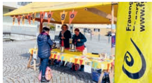
Für einmal gab es beim Suppenzmittag Suppe to go.

rem Einsatz und Wohlwollen leisteten sie einen Beitrag an die Fastenaktion 2022. Ein herzliches Dankeschön und Vergelts Gott an dieser Stelle allen Beteiligten. Frauengemeinschaft Degersheim