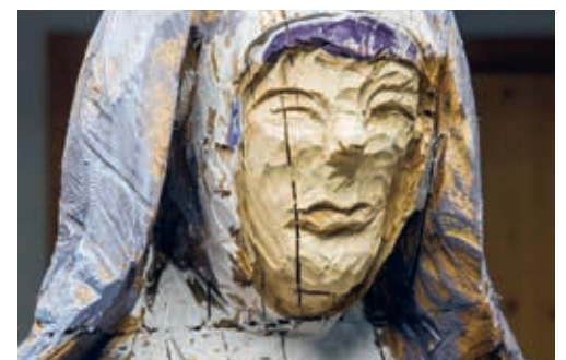
Die heilige Wiborada – eine mutige Frau.