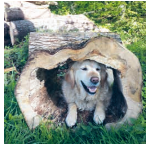
Die Wanderrallye macht Mensch wie Hund viel Spass.