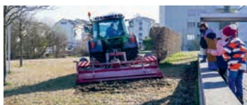
Auch beim Schulhaus Botsberg entsteht eine Wildblumenwiese. Als Erstes wurde die oberste Vegetationsschicht abgehobelt.

nachwachsende Gräser und Kräuter am weiteren Wuchs zu hindern, sind zwei weitere Arbeitsgänge mit einer Kreiselegge vorgesehen. Im Mai sollen die Flächen – insgesamt rund 3300 Quadratmeter – mit einer Wildblumenwiese angesät werden. Dabei werden Samen mit einem sehr hohen Wildblumenanteil eingesetzt. Wildblumenwiesen blühen jedoch erst nach einer Überwinterung. Deshalb ist im Aussaatjahr noch wenig sichtbar. Ob die Anstrengungen zur Erhöhung der Biodiversität erfolgreich sind, wird sich erst im Frühjahr 2023 zeigen.