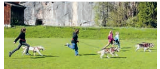
Die Städtereise nach Luzern beinhaltet auch die Begegnung mit Huskys.