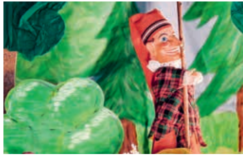
Spannende Geschichten mit dem Kasperli gibt es beim «Spatzenhöck».

VEREIN Am Montag, 28. März 2022, wartet der Kasperli mit neuen spannenden Abenteuer-geschichten auf die Kinder beim «Spatzenhöck» im katholischen Pfarreiheim Flawil. Die Vorstellungen beginnen um 14.15, 15.15 und 16.15 Uhr und dauern jeweils 30 Minuten. Der Eintritt beträgt drei Franken pro Person. Ab 14 Uhr steht ein reichhaltiges Kuchenbuffet bereit. Der Familientreff freut sich auf einen unterhaltsamen Nachmittag und heisst alle Besucherinnen und Besucher herzlich willkommen. Nina Loser