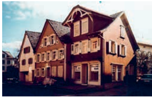
Kronenstrasse 4 einst und heute. Links die Häuserreihe früher, mit der inzwischen abgebrochenen Tonhalle im Hintergrund. Rechts der neu gebaute Hausteil, der sich optimal einordnet.

Am 3. März 2022 informierte der Gemeinderat über seine Absichten mit dem Projekt «Lebendiges Stickerquartier». Das Interesse der Quartierbewohnerinnen und Quartierbewohner sowie weiterer interessierter Personen aus der ganzen Region war riesig. So musste der Anlass aus Platzgründen kurzfristig in den Saal des Restaurants Rössli verlegt werden. Und selbst dieser Saal war mit rund 75 Personen bis auf den letzten Stuhl besetzt. Nach dem einleitenden Referat von Gemeindepräsident Elmar Metzger wurde ausgiebig diskutiert. Es gab viele kritische Wortmeldungen zum Richtplan «Stickerquartier», welchen der Ge-