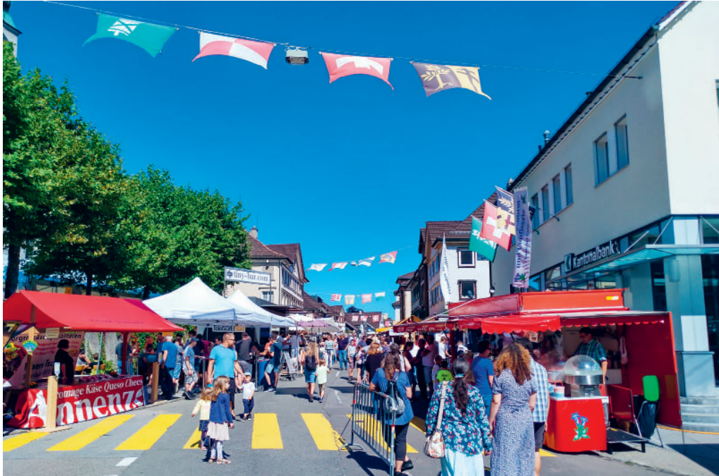
Der Ostschweizerische Marktverband unterstützt die Gemeinde Degersheim künftig bei der Durchführung des Jahrmarktes.

DEGERSHEIM Die Gemeinde Degersheim organisiert jährlich am ersten Montag im September und am Sonntag davor den traditionellen Degersheimer Jahrmarkt. Neu wird die Gemeinderatskanzlei bei der Organisation des Marktes durch den Ostschweizerischen Marktverband unterstützt.