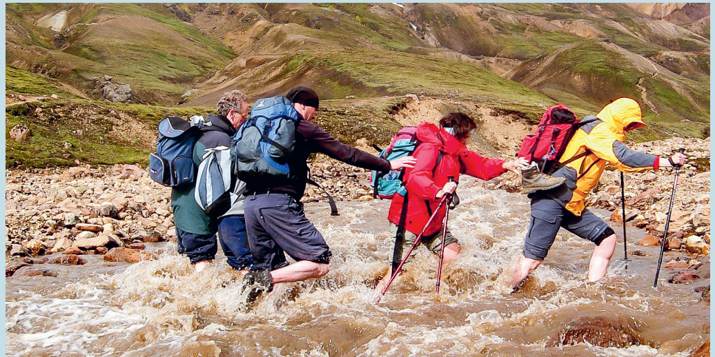
Hindernisse zwingen uns zu einem neuen Weg, einer neuen Sichtweise der Dinge.

Die ökumenische Fastenwoche vom 27. März bis 1. April 2022 möchte diese Thematik aufgreifen: