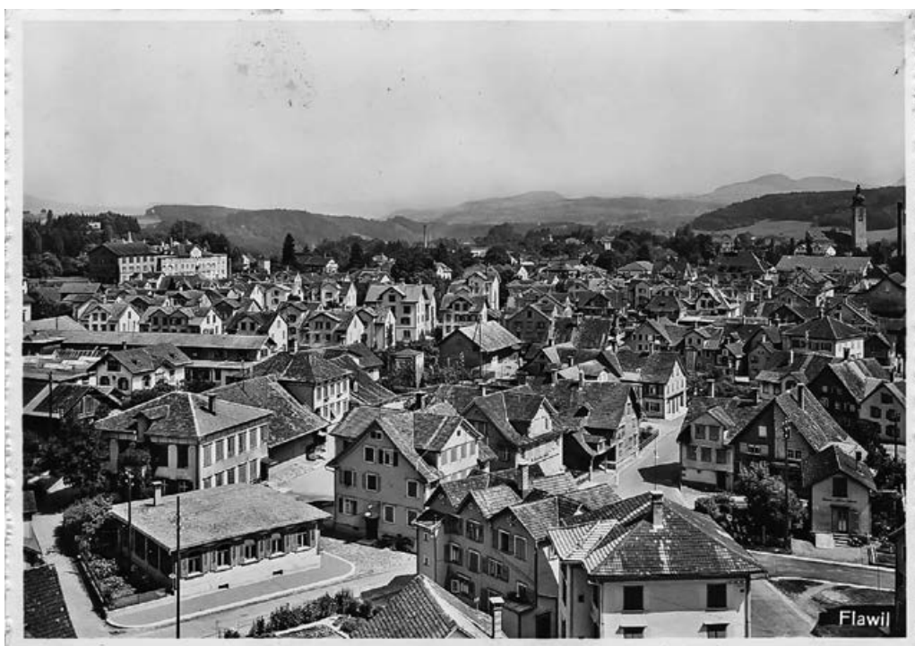
Eindrückliche Aufnahme des Stickerquartiers um 1935 von Westen.

FLAWIL Der Gemeinderat hat verschiedene Massnahmen beschlossen, um dem Stickerquartier Rückenwind zu geben. Ab März 2022 soll eine Gruppe interessierter Flawilerinnen und Flawiler zusammen mit Fachpersonen die Frage bearbeiten, wie Stickerhäuser fachgerecht saniert werden können. Im April kommt eine zweite Gruppe dazu, welche im Dorf die Auseinandersetzung mit diesem Quartier und der historischen Bausubstanz fördern soll. Damit will der Gemeinderat die Gründung einer Wohn- und Baugenossenschaft «Lebendiges Stickerquartier» anstossen. In diesem Interview beleuchtet Gemeindepräsident Elmar Metzger die Hintergründe.