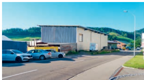
Der Teilzonenplan Hintertschwil Ost tritt per 11. Februar 2022 in Kraft.

wurde ein Teil des Grundstückes Nr. 943, das sich in der Wohn-Gewerbezone WG3 befindet, ausbezont. Der Gemeinderat unterbreitete den Teilzonenplan Hintertschwil Ost im Sommer 2021 einer Mitwirkung und erliess diesen in der Folge am 17. August 2021. Mit Verfügung vom 1. Februar 2022 hat das Amt für Raumplanung und Geoinformation (AREG) den Erlass nun genehmigt. Der Gemeinderat hat die Inkraftsetzung auf den 11. Februar 2022 festgelegt.