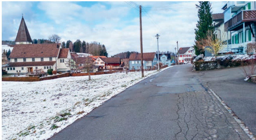
Das Sanierungsprojekt Böhlstrasse und der entsprechende Teilzonenplan liegen zur Mitwirkung auf.

zugeben. Der Gemeinderat hat das Sanierungsprojekt und den Teilstrassenplan Böhlstrasse zur Mitwirkung verabschiedet. Die Projektunterlagen und der Teilstrassenplan liegen vom 11. Februar bis zum 13. März 2022 in der Gemeinderatskanzlei zur Einsichtnahme auf. Ebenfalls können sie auf der Website der Gemeinde in der Rubrik «Politik → Sanierungsprojekt Böhlstrasse» eingesehen werden. Eingaben können bis am 13. März 2022 schriftlich an den Gemeinderat, Hauptstrasse 79, 9113 Degersheim, oder per E-Mail an gemeinde@degersheim.ch eingereicht werden. Fragen zum Projekt werden von Bauverwalter Armin Fässler, 071 372 07 90, gerne beantwortet.