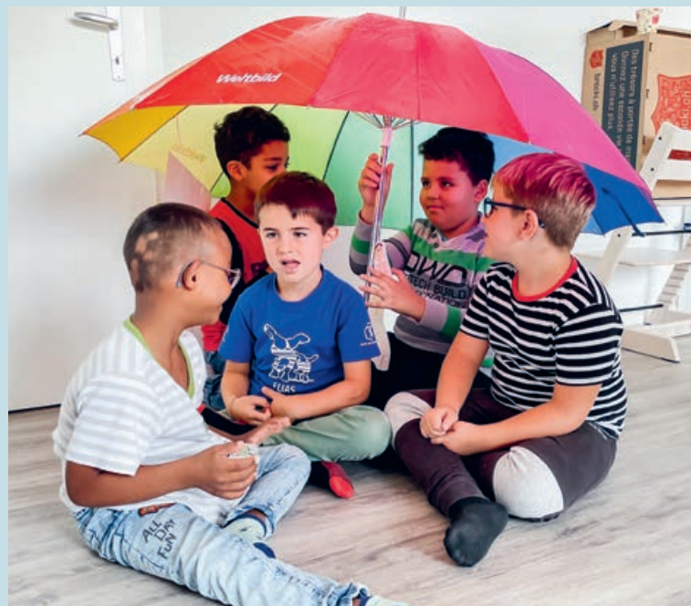
Auch Kinder dürfen sich unter dem Schirm Gottes geborgen fühlen.