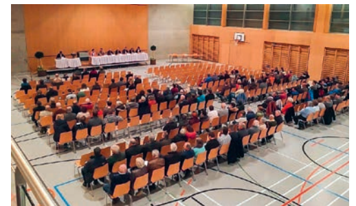
Der Gemeinderat hat beschlossen, die Bürgerversammlung trotz der Pandemiesituation durchzuführen.

Solange das Budget nicht durch die Stimmberechtigten der Gemeinde genehmigt ist, können die darin aufgenommenen Investitionen und Projekte nicht an die Hand genommen werden. Eine Aufschiebung der Bürgerversammlung war daher kein Thema. Zu beurteilen galt es entsprechend in erster Linie das Risiko, ob eine Verschärfung der Massnahmen eine kurzfristige Absage der Bürgerversammlung zur Folge hätte. Der Gemeinderat erachtet es in der aktuellen