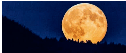
So hat sich die Frauengemeinschaft den Vollmond vorgestellt!

Teilnehmerinnen mit einem Orangenpunsch. Mit herrlichem Blick über das nächtliche Flawil wurde beim Trinken unter den Frauen das eine oder andere ausgetauscht. Munter bewegte sich die Schar wieder zurück ins Dorf, wo sich dann alle in Richtung Zuhause wieder trennten. eing.