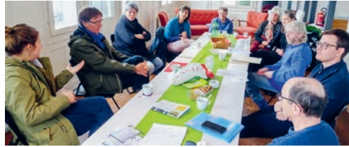
Gipfel-i-Treff der Grünen im Kulturlokal Bitzgi.

nisiert. Anfang September folgt dann die zweite City-Oase auf dem Bahnhofplatz und am 24. September das Revival der seit drei Jahren überfälligen Flawiler Oldies-Disco des Greenteams im Dance-Beat Studio des Werk 1 der Flawa. eing.