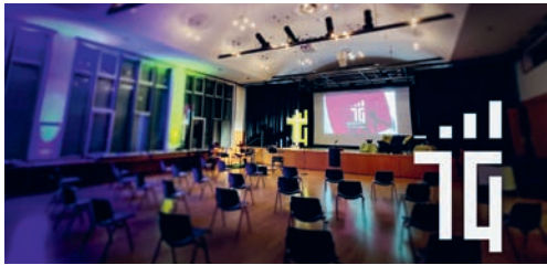
Eine neue Art Jugendgottesdienst.