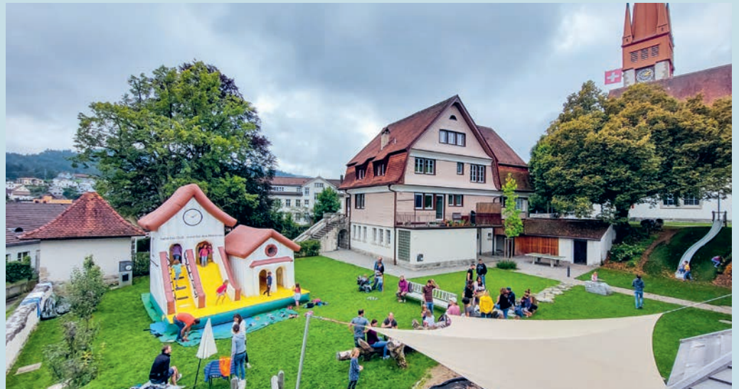
Ehrenamtliche Arbeit in der Kirche darf Freude machen.

Im Alltag ehrenamtlicher Arbeit (und hauptamtlicher genauso) rückt das manchmal ein wenig in den Hintergrund – gerade dann, wenn Meinungsverschiedenheiten ausgehalten werden müssen oder man den Eindruck hat, dass das eigene Engagement nicht genug gewürdigt wird. Die freiwillige Mitarbeit ist in den Kirchgemeinden wichtig – und macht Freude, weil ich etwas mitgestalten kann, weil ich gefragt bin mit meinen Kenntnissen, Erfahrungen und Begabungen, weil ich darin die Sinnhaftigkeit meines Tuns erleben darf. Gott sei Dank sind die Interessen und Begabungen nicht bei allen gleich: Während der eine gerne Menschen besucht, möchte eine andere lieber ihre Kompetenzen im Vorstand einbringen, eine weitere Person singt begeistert im Chor oder in der Band, während jemand anderes lieber zum Akkubohrer greift und eine Bühne für das Weihnachtsmusical aufbaut. Schon Paulus schreibt in seinem Brief an die Gemeinde in Korinth über die verschiedenen Menschen und ihre Begabungen, die erst zusammen in einer Gemeinde ein Ganzes ergeben und in ihrer Ver-