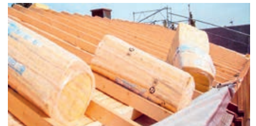
Die Gemeinde Degersheim bietet in Zusammenarbeit mit der Energieagentur St.Gallen kostenlose Erstberatungsgespräche an.

www.energieagentur-sg.ch/beratungstermine oder unter der Telefon 058 228 71 71 reserviert werden.