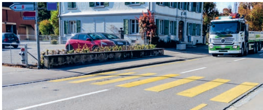
Die Fussgängerquerung der St.Gallerstrasse, Höhe Lindenstrasse, soll sicherer werden.

Die beiden Projekte wurden vom kantonalen Tiefbauamt für die öffentliche Mitwirkung freigegeben. Das Mitwirkungsverfahren dauert bei beiden Projekten vom 17. Januar 2022 bis 17. Februar 2022. Weitere Informationen sind auf www.sg.ch/tba-mitwirkung zu finden. Zur Einsicht und zur Stellungnahme an das kantonale Tiefbauamt sind alle eingeladen, die sich für das Projekt interessieren und gerne zur Entwicklung einer optimalen Lösung beitragen möchten.