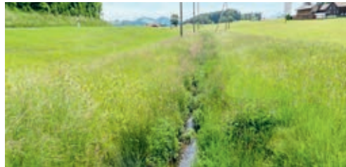
Der Pufferstreifen mit dem hochstehenden Gras darf nicht gedüngt werden und wird idealerweise extensiv bewirtschaftet.

alisierten Kontrolldienst KUT AG eine Vereinbarung zur Ausführung der Kontrollen abgeschlossen. Diese hat nun ihren Kontrollbericht für das Jahr 2021 vorgelegt. Der Gemeinderat ist erfreut darüber, dass bei allen kontrollierten Betrieben in der Gemeinde Degersheim keine Mängel festgestellt wurden. Ihm ist es jedoch auch ein Anliegen, dass nicht nur Landwirtschaftsbetriebe einen vorsichtigen Umgang mit Düngemitteln und Herbiziden pflegen. Auch im Privatbereich sollten solche Mittel nur zurückhaltend und gemäss Anweisung eingesetzt werden.