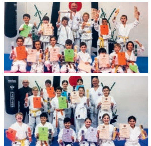
Absolventinnen und Absolventen der Karateschule Flawil nach der Prüfung.