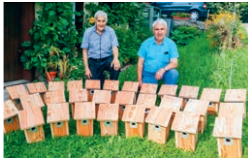
Insgesamt 30 alte und defekte Nistkästen wurden anlässlich der Reinigung gleich durch neue ersetzt.