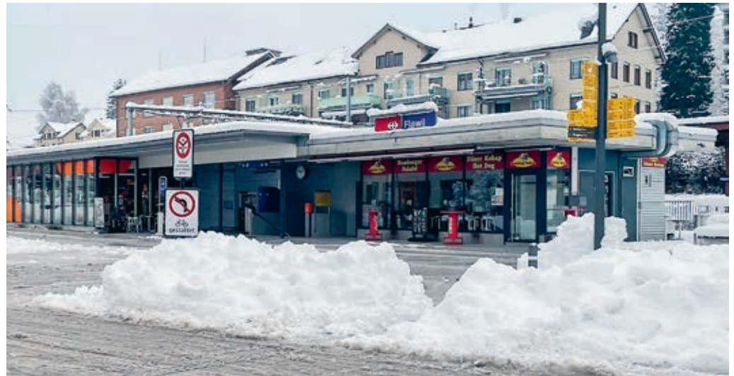
Der Gemeinderat hat die Sicherheitssituation am Bahnhof Flawil zusammen mit den Sicherheitsorganen beurteilt.

Dennoch gibt es Flawilerinnen und Flawiler, die sich am Bahnhof Flawil nicht sicher fühlen. Es besteht eine Abweichung zwischen den objektiven Feststellungen der Sicherheitsorgane und