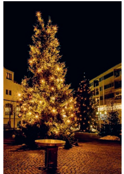
Es weihnachtet im Dorf der Gemeinde Degersheim.