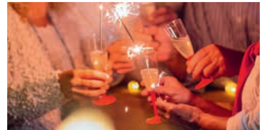
Ob die Silvesterfeier an der Bahnhofstrasse stattfindet, ist noch ungewiss.

VEREIN Das Jahr 2021 neigt sich dem Ende zu. Ein Jahr, das wegen der Coronapandemie viele Einschränkungen für alle mit sich brachte. Und diese Pandemie beschäftigt auch den Verkehrsverein Flawil, der jeweils in der Silvesternacht die Bevölkerung an die Bahnhofstrasse einlädt, um gemeinsam auf das neue Jahr anzustossen. Auch dieses Jahr? Das ist noch ungewiss und abhängig davon, wie sich die Lage entwickelt. Wie sich der Verkehrsverein entscheidet, das erfahren Interessierte auf der Website des Verkehrsvereins, www.verkehrsverein-flawil.ch . Der Vorstand des Verkehrsvereins wünscht auf jeden Fall schon an dieser Stelle allen ein glückliches, hoffentlich weniger virengeplagtes neues Jahr. Marianne Bargagna