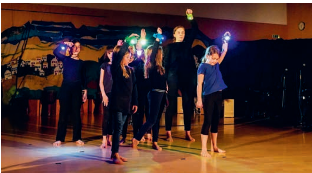
Weihnachtsmusical der reformierten Kirchgemeinde Degersheim

KIRCHE Selber Hoffnung schöpfen und diese weitergeben, obwohl alles dunkel erscheint. Diese Erfahrung macht ein Kind, indem es mit vier Engeln in die biblische Weihnachtsgeschichte eintaucht. Es beginnt zum Schluss des Stückes zu erahnen, was es bedeutet, dass Jesus heute noch Hoffnung schenkt und alltäglich in unserem Leben wirken möchte. Das diesjährige Weihnachtsmusical der reformierten Kirchgemeinde Degersheim wurde am Samstag, 4. Dezember 2021,