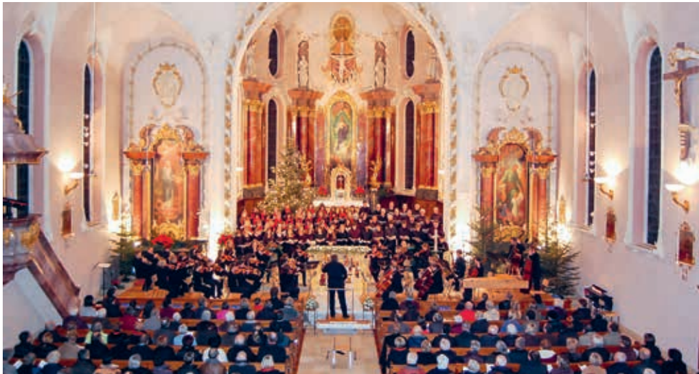
Am 9. Januar 2022 soll endlich wieder ein Konzert stattfinden.

DEGERSHEIM Konzerte haben in Degersheim eine lange Tradition. Seit 1961 haben sie einen festen Platz im Kulturleben des ehemaligen Stickerdorfes. Nachdem in den letzten Monaten das kulturelle Leben aufgrund der Pandemie grundsätzlich eingeschränkt war, soll mit dem Dreikönigskonzert am 9. Januar 2022 endlich wieder ein Konzert stattfinden können.