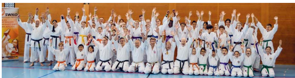
Ein SWKO-Lehrgang zog Mitte November viele Karatekas nach Flawil.