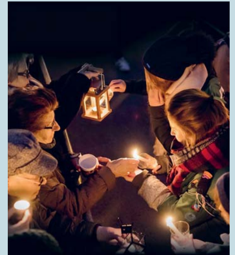
Das Friedenslicht ist ab dem 24. Dezember in den Kirchen der Seelsorgeeinheit Magdenau zum Abholen bereit. Bitte ein geeignetes Gefäss dafür mitbringen.