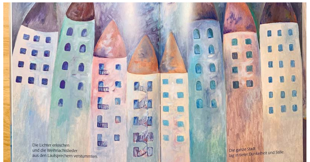
Zauberhafte Bilder entlang der Bahnhofstrasse sollen Kinder und Erwachsene erfreuen.