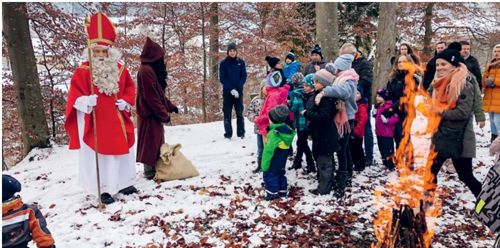
Höhepunkt am Weihnachtsmarkt – der traditionelle Besuch vom Samichlaus und Schmutzli im Böhlwäldchen.