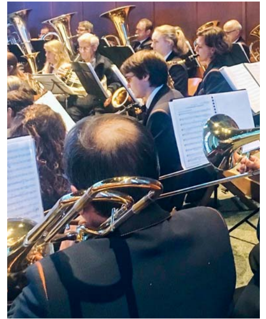
Die Harmoniemusik Flawil am Spielen.

KIRCHE Die Seelsorgeeinheit Magdenau (SEMA) lädt ein zu einem Gottesdienst, bei dem die Harmoniemusik Flawil (HMF) für einen wunderbaren musikalischen Rahmen sorgt: Sonntag, 12. Dezember 2021, um 10.15 Uhr in der katholischen Kirche in Flawil. eing.