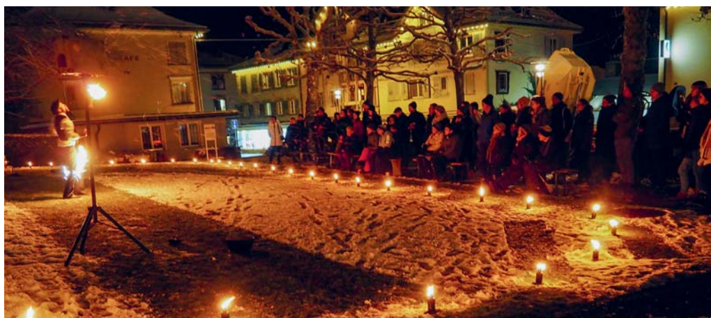
Feuer und Flammen auf der Kirchenwiese