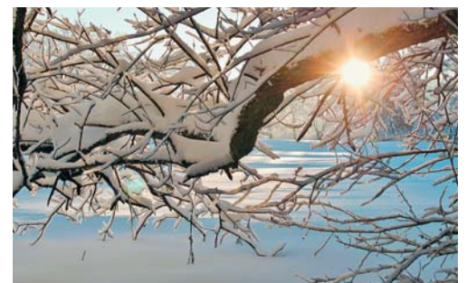
Das Betreten von Wäldern birgt immer eine gewisse Gefahr, welche sich im Zusammenhang mit dem Schnee noch erhöht.

Im Februar des letzten Jahres lag im ganzen Kanton St.Gallen so viel Schnee, dass die Bäume die Schneelast kaum mehr tragen konnten. Die kantonalen Stellen erliessen daraufhin eine Warnung und rieten vom Betreten von Wäldern ab. Auch wenn keine solche Warnung besteht, ist beim Betreten des Waldes Vorsicht geboten. Die Natur ist unberechenbar und im Gegensatz zu Eigentümern von Gebäuden und anderen Werken besteht für die Waldeigentümer keine Pflicht zur Bewirtschaftung. So muss jederzeit damit gerechnet werden, dass Bäume umstürzen oder Äste abbrechen können. Neben den ohnehin teilweise tragischen Auswirkungen eines solchen Unglücksereignisses kann zudem nicht davon ausgegangen werden, dass jemand für die Unglücksfolgen haftet. Mangels der Bewirtschaftungspflicht liegt keine Kausalhaftung vor. Die Waldbesuchenden sind daher aufgefordert, insbesondere bei speziellen Wetterverhältnissen wie Gewittern, Stürmen oder viel Schnee besondere Vorsicht walten zu lassen oder den Wald gar nicht erst zu betreten.