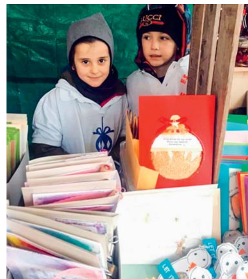
Die Schülerinnen und Schüler des Einschulungsjahres übten sich fleissig im Verkauf.

Die Schülerinnen und Schüler verkauften am Weihnachtsmarkt ihre in den Wochen zuvor mit grosser Kreativität hergestellten Sachen. Diesmal drehte sich alles um das Thema «Kugel». Dabei reichte das Angebot von verschiedenen Karten und Adventskalendern bis hin zu Köstlichkeiten. Aus dem Verkauf kamen 2600 Franken zusammen. Der Erlös wird der Tagesstruktur Grund, den Flawiler Spielgruppen sowie der Kindertagesstätte «Karussell» gespendet. Die Schülerinnen und Schüler sowie die Lehrpersonen bedanken sich bei den Besucherinnen und Besuchern des Weihnachtsmarktes, welche sie so grosszügig unterstützt haben.