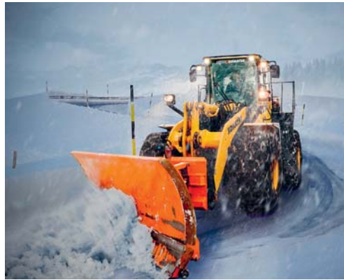
Bitte gehen Sie den Winterdienstfahrzeugen grossräumig aus dem Weg.

KIRCHE Kürzlich waren die freiwillig Engagierten der katholischen Pfarrei Degersheim eingeladen, sich auf der Kirchenwiese zu treffen. Sie wurden von vielen Laternen empfangen, die den frisch verschneiten Platz in ein warmes Licht tauchten. Mit heissem Glühmost und feurigen Marronis gestärkt und gewärmt, genossen sie die flammenreiche Feuershow von «herz-feuer». Danach ging der Abend im gut geheizten evangeli-