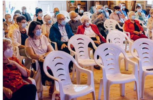
Zu jeder Veranstaltung kamen zwischen 50 und 100 Gäste.

Im nächsten Jahr wird die Harmoniemusik Flawil zu Gast sein im Ortsmuseum. Sie feiert dort im September das 150-Jahr-Jubiläum mit Anlässen und einer Ausstellung. Und die Museumsverantwortlichen selber werden sich Gedanken machen über die Neugestaltung der Dauerausstellung. Sie sehen vor, die Öffnungstage jeweils am ersten Sonntag im Monat einem bestimmten Thema zu widmen. Man darf also gespannt sein auf die nächste Museumssaison. Marianne Bargagna