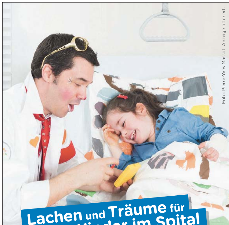
Anzeige offeriert.