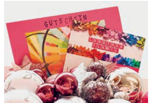
Geschenksidee: Gutschein der Ludothek Flawil.