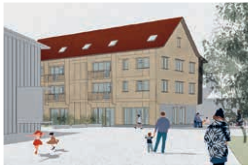
Die reformierte Kirchgemeinde plant an der Landbergstrasse ein Mehrfamilienhaus.

Um ein zukunftsorientiertes und nachhaltiges Projekt zu realisieren, strebt die Bauherrin ein Minimum an Parkplätzen beim Haus an. Das Areal rund ums Haus soll Ort der Begegnung sein und deshalb möglichst autofrei. Mietende sollen grundsätzlich auf ein eigenes Auto verzichten. Es sollen lediglich ein Parkplatz für ein Elektro-Sharing-Auto sowie ein Besucherparkplatz realisiert werden. Falls Bewohner oder Gewerbenutzer auf einen Parkplatz angewiesen sind, kann dieser auf dem Lindensaalplatz gemietet werden.