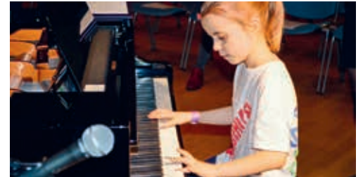
An-/Abmeldungen für Musikschulunterricht bis 10. Dezember 2021.

Die An- und Abmeldeformulare finden Sie unter www.schule-degersheim.ch → Musikschule → An- / Abmeldungen