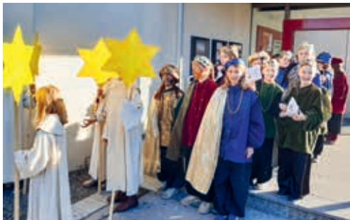
Anfang Januar sind die Sternsinger wieder unterwegs.