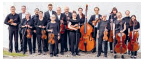
Flawiler Kammerorchester – von Musizierlust und Spielfreude getragen.