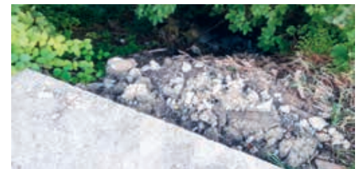
Das Ablagern von Grünabfällen ausserhalb von dafür vorgesehen Deponien ist verboten.

Gemäss Umweltschutzgesetz des Bundes dürfen Abfälle nur in dafür vorgesehen Deponien abgelagert werden. Auch biologisch abbaubares Grüngut oder Aushubmaterial ist gemäss Bundesgesetzgebung Abfall und darf entsprechend nicht einfach irgendwo entsorgt werden. Wer dies dennoch tut, macht sich strafbar und muss mit einer Busse rechnen. Für die fachgerechte Entsorgung von kleineren Mengen an Grüngut ist die kostenpflichtige, regelmässige Grünabfuhr bestens geeignet. Grössere Mengen an Grüngut können bei der Brunner Umweltservice AG in Flawil oder bei der Axpo Biomasse AG in Uzwil deponiert werden. Durch die fachgerechte Entsorgung von Grünabfällen ist auch gewährleistet, dass diese optimal wieder in den Kreislauf eingeführt werden.