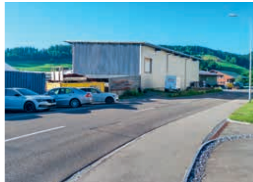
Gegen den Teilzonenplan «Hintertschwil Ost» wurde kein Referendum ergriffen.

war kein Widerstand gegen das Vorhaben spürbar und bis zum Ablauf der Referendumsfrist wurden keine Unterschriften eingereicht. Damit der Teilzonenplan «Hintertschwil Ost» Rechtsgültigkeit erlangt, ist nun noch die Genehmigung durch das Baudepartement des Kantons St. Gallen erforderlich. Dieses prüft abschliessend, ob der Teilzonenplan keine Bestimmungen aus den übergeordneten Gesetzen von Bund und Kanton verletzt. Zu diesem Zweck wurden die Unterlagen mittlerweile an das Baudepartement übermittelt.