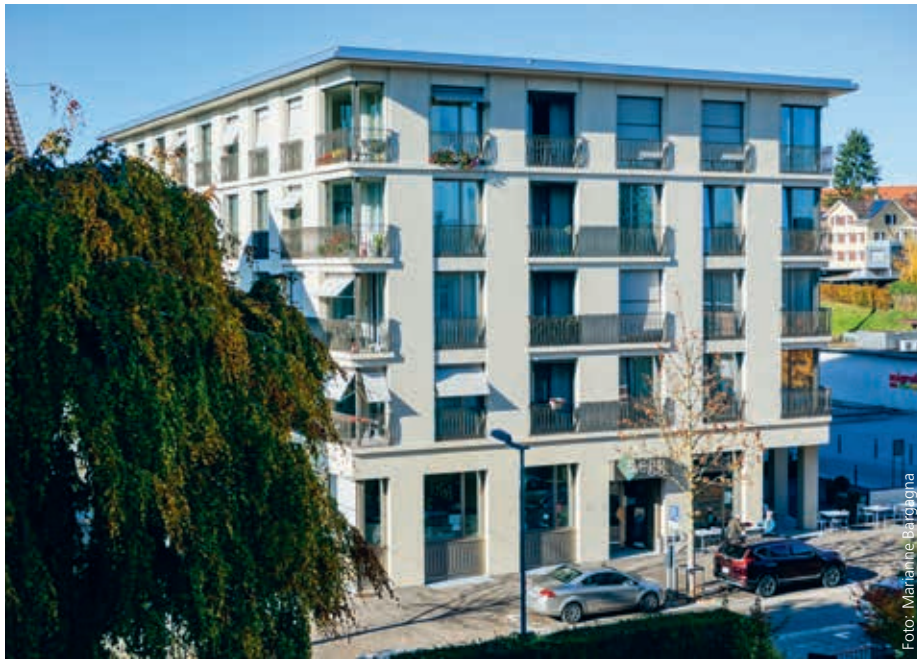
Das 5egg mitten im Dorf Flawil ist ein beliebter Wohn- und Arbeitsort und ein beliebter Treffpunkt.

Seit zwei Jahren wird im Haus 5egg im Flawiler Dorfzentrum gelebt, gelacht, gearbeitet und getafelt. Und alle, ob Bewohnerinnen und Bewohner, Pflegendе, im Service oder in der Küche Tätige, sind sich einig: Das 5egg ist eine gute Sache. Denn im 5egg finden nicht nur Personen der Generation 65plus, die ihren Haushalt noch eigenständig erledigen, ein neues Zuhause, sondern auch jüngere Personen, die wegen einer chronischen Krankheit auf regelmässige Pflegeleistungen angewiesen sind. Und sollte sich die gesundheitliche Situation verschlimmern, brauchen die Betroffenen nicht mehr in ein Pflegeheim umzuziehen, sie können in ihren eigenen vier Wänden im 5egg bleiben. Ihre Wohnung wird dann ein Pflegeheimplatz, der vom Wohn- und Pflegeheim Flawil betreut wird. Ein Konzept, das breite Anerkennung findet. Das weiss auch Cornelia Fischbacher. Sie ist für die Verwaltung des 5egg zuständig. Sie führt eine Warteliste mit über 30 Namen von Interessenten. «Wir könnten nochmals ein gleich grosses Haus füllen.»