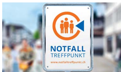
Die Notfalltreffpunkte sind mit einer Tafel gekennzeichnet.

Eine Broschüre zu den Notfalltreffpunkten, welche auch wichtige Hinweise für Notsituationen beinhaltet, ist auf der Website www.flawil.ch unter der Rubrik «Gemeindehaus → Dienstleistungen → Notfallbroschüre» zu finden.