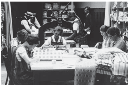
Im Musterzimmer der Weberei Habisreutinger AG, 1927.

VEREIN Unter dem Titel «Frisch aus dem Labor 2021» zeigt der Verein Lichtspiel/Kinemathek Bern im Rahmen des UNESCO-Welttages des audiovisuellen Kulturerbes am Mittwoch, 20. Oktober 2021, unter anderen die Filme, die vergangenen Herbst in Flawil gefunden wurden. «Die Baumwolle in unserer Nationalen Industrie» aus den Fabriken der Habisreutinger AG, «Mittagsstündchen» von 1927 sowie der älteste Film des Kantons St.Gallen «Arbeiterschaft verlässt die Weberei Ottiker Flawil» von etwa 1905 werden ab 20 Uhr im Internet als Livestream zu sehen sein. Urs Schärli kommentiert die Filme live vor Ort und Wieslaw Pipczynski begleitet ebenfalls live am Piano. Der Livestream ist unter https://lichtspiel.ch/de/agenda/aktuelles-programm/ zu finden. eing.