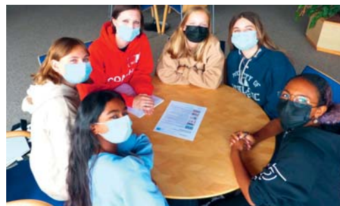
Im Oberstufenrat diskutieren die Schülerinnen und Schüler ihre Bedürfnisse und Ideen.

erfolgreichen Etablierung des Oberstufenrats sollen im zweiten Semester dann auch die ersten Oberstufenklassen in den Rat eingebunden werden.