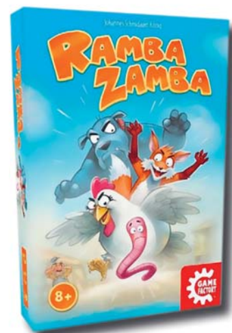
«Ramba Zamba» und viele weitere neue Spiele stehen zur Ausleihe bereit.