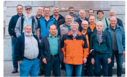
Der Männerchor Alterschwil vor dem Telldenkmal in Altdorf.