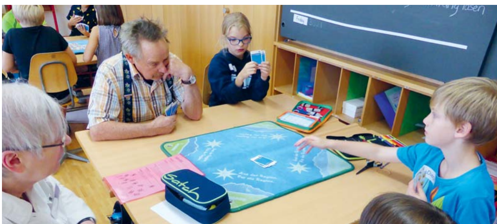
Drei Generationen, ein Spiel. Im Rahmen eines Generationenaustausches lernten die Kinder der 4. Klasse das Jassen.

eine Herausforderung darstellte, bereitete die Abwechslung im Schulalltag grosse Freude. Voller Stolz zeigten die Schülerinnen und Schüler am dritten Nachmittag ihre neu erlernten Fähigkeiten beim gemeinsamen Kartenspiel auch ihren Eltern. Dieses Gemeinschaftsprojekt hatte einerseits zum Ziel, eine Schweizer Tradition aufrecht zu erhalten, und andererseits, den Generationenaustausch zu fördern.