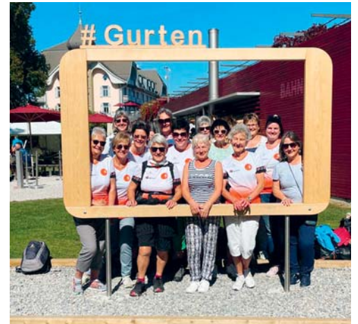
Die Turnerinnen auf dem Berner Hausberg Gurten.