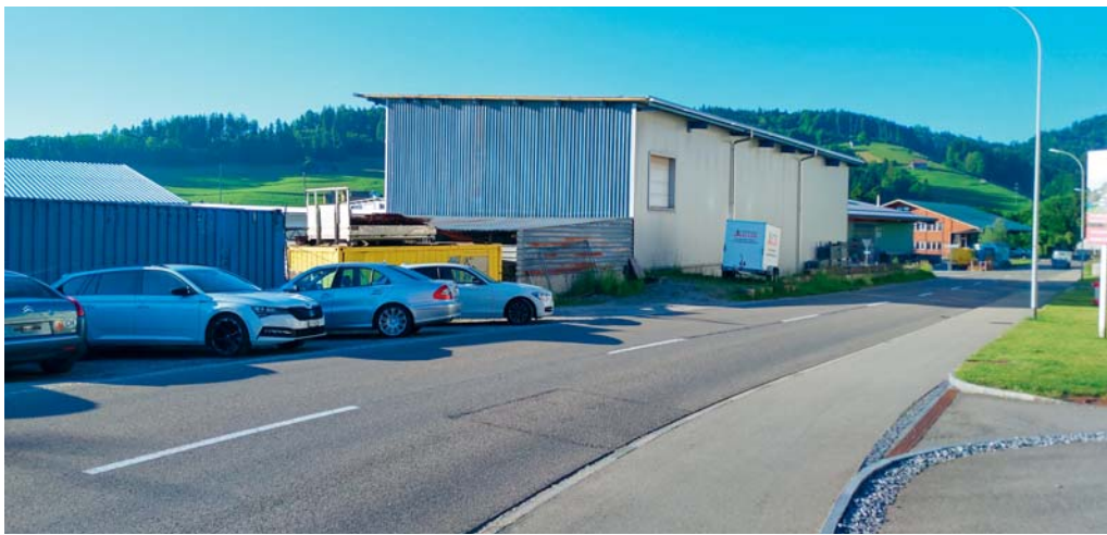
Der Teilzonenplan Hintertschwil Ost liegt für das Referendumsverfahren auf.

DEGERSHEIM Am 17. August hat der Gemeinderat den Teilzonenplan Hintertschwil Ost erlassen und in der Folge vom 20. August bis 19. September öffentlich aufgelegt. Während der Auflagefrist sind keine Einsprachen eingegangen. Es erfolgt nun vom 15. Oktober bis 14. November 2021 die Referendumsvorlage.