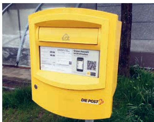
Der Post-Briefkasten an der Magdenauerstrasse 10 wird in Zukunft am Samstag nicht mehr geleert.

In unten stehender Tabelle sind die bisherigen und die neuen Leerungszeiten ersichtlich.