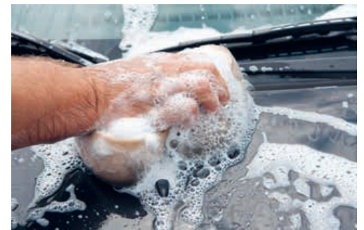
Motorfahrzeuge sollten nicht auf privaten Plätzen gereinigt werden.

Professionelle Waschanlagen hingegen arbeiten sehr viel umweltschonender. Sie unterliegen strengen behördlichen Auflagen und werden regelmässig überprüft. Bei einer professionellen Autowäsche werden, dem Lack zuliebe, bis zu 500 Liter Wasser eingesetzt. Dieses für jede Wäsche neu aus dem Trinkwassernetz zu entnehmen, wäre eine Vergeudung wertvoller Ressourcen. Deshalb kommen heute in den meisten Waschanlagen effiziente Abscheide- und Wasserrückgewinnungsanlagen zum Einsatz. Das gebrauchte Wasser wird gereinigt und anschliessend wiederverwendet. Im gebrauchten Waschwasser enthaltene Schmutzpartikel und Chemierückstände (Reinigungsmittel, Lackschutz usw.) werden herausgefiltert und ordnungsgemäss entsorgt. Sie gelangen also gar nicht erst in die Umwelt. Die Recyclingquote der professionellen Waschanlagen liegt bereits bei 90 Prozent – mit weiter steigender Tendenz.