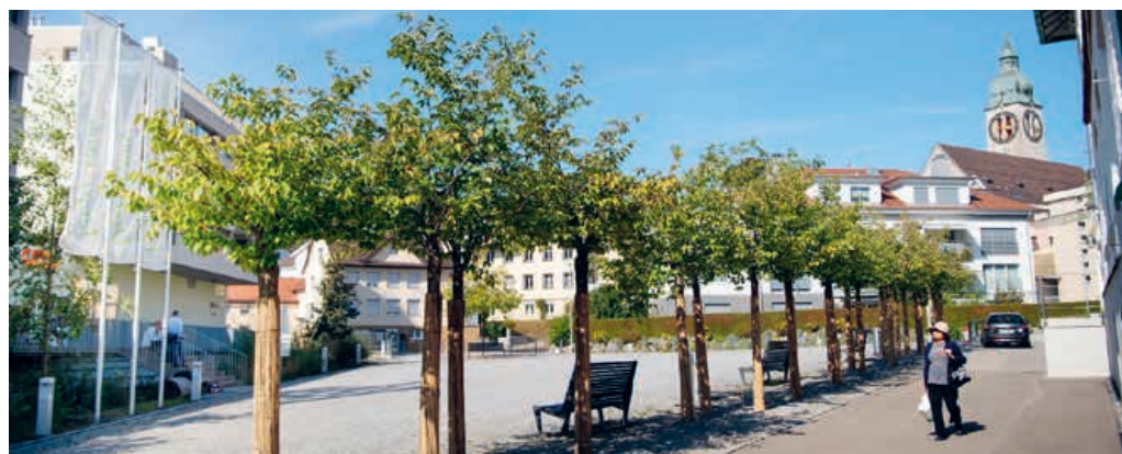
Das nächste «Platzgespräch» findet zum Thema «Abstimmungsvorlagen» statt.