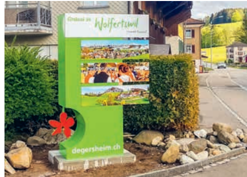
Die neu errichtete Infotafel in Wolfertswil informiert über bevorstehende Anlässe.

der Veranstaltungen selber veranlasst werden. Alle Informationen über die genaue Vorgehensweise und die Preise sind auf der Website der Gemeinde in der Rubrik «Tourismus/Verkehrsverein» abrufbar.