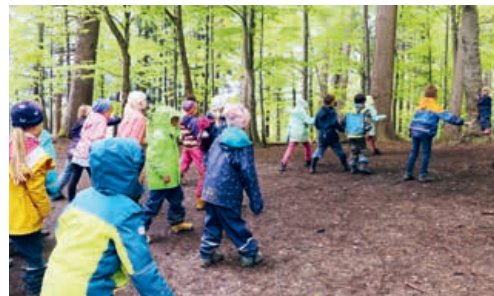
Am Jubla-Nachmittag sammelten die Kinder Zutaten für einen Zauberspruch.