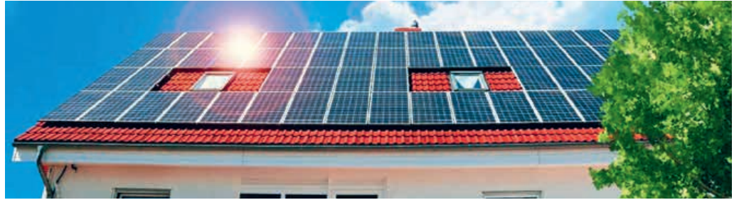
Die Photovoltaik-Aktion Fürstenland richtet sich an alle energiebewussten Hausbesitzerinnen und Hausbesitzer.

Die Photovoltaik-Aktion Fürstenland bietet in Zusammenarbeit mit lokalen Anbietern eine betriebsbereite, ans Netz angeschlossene Photovoltaik-Anlage für ein Einfamilienhaus zu einem attraktiven Fixpreis an. Damit setzen die Hausbesitzerinnen und Hausbesitzer einerseits auf nachhaltige Sonnenenergie. Andererseits müssen sie nicht verschiedene Systeme und Angebote vergleichen. Der lokale Anbieter ist der einzige Ansprechpartner, welcher zusammen mit der Energieagentur St.Gallen alles organisiert. Die Photovoltaik-Aktion wird durch die Gemeinden Flawil und Degersheim unterstützt.