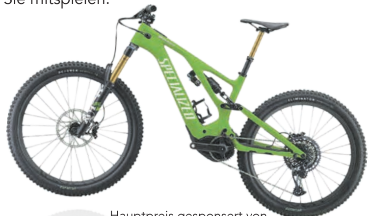
Hauptpreis gesponsert von