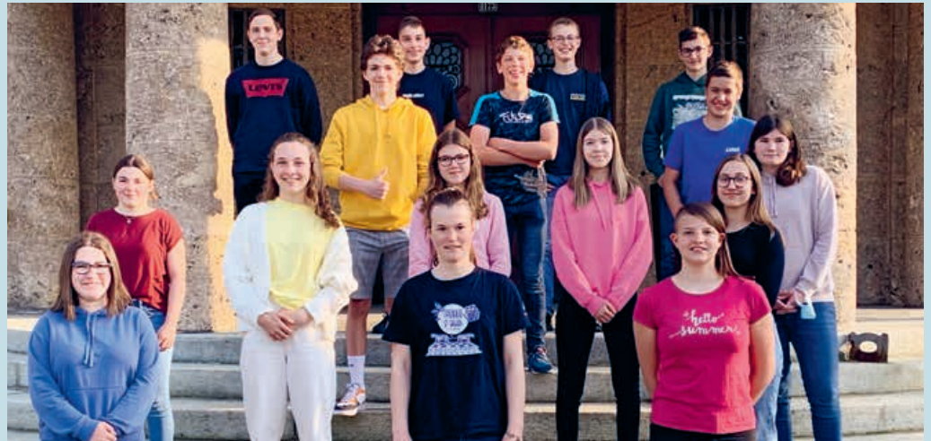
16 Jugendliche aus Flawil und Niederwil haben sich seit dem letzten Sommer auf ihre Konfirmation vorbereitet.

«Seid allezeit fröhlich, seid dankbar in allen Dingen; denn das ist der Wille Gottes in Christus Jesus für euch.» Von Fröhlichkeit und Dankbarkeit sprechen diese Zeilen aus dem 1. Thessalonicherbrief. Und fröhlich geht es jeweils auch im Konf-Unterricht zu und her, der am Dienstagabend im Kirchgemeindezentrum in Flawil stattfindet. 16 Jugendliche aus Flawil und Niederwil haben sich seit dem letzten August auf ihre Konfirmation vorbereitet, die Ende Mai beziehungsweise Anfang Juni stattfinden wird. Die Konfirmandinnen und Konfirmanden haben sich in den vergangenen Monaten viele Gedanken über sich selbst, über ihr Leben und über ihren Glauben gemacht. Anfang Mai wurde es dann Zeit, die Konfirmationsgottesdienste vorzubereiten. An einem Samstagmorgen trafen sich die Jugendlichen, um sich ein Thema für die Gottesdienste auszusuchen und mit den Vorbereitungen zu beginnen. Schnell fiel die Wahl auf das Thema «Dankbarkeit». Mit Feuereifer machten sich die Jugendlichen daran, passende Musikstücke auszusuchen, Fürbitten zu formulieren und Gebete zu schreiben. Sie machten sich ebenfalls Gedanken darüber, wofür sie denn dankbar sind. Diese Gedanken werden sie in den Gottesdiensten präsentieren.