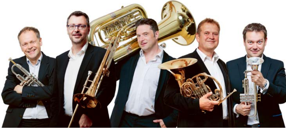
Das Sonus Brass Ensemble spielt unter anderem Werke von Telemann und Grieg.

39 und per E-Mail sekretariat.amz@gmail.com. Abonnenten des Abendmusikzyklus haben Vorrang. Das Kinderkonzert «Die Blecharbeiter», das am Nachmittag mit denselben Musikern hätte stattfinden sollen, musste leider verschoben werden und wird nächstes Jahr stattfinden. eing.