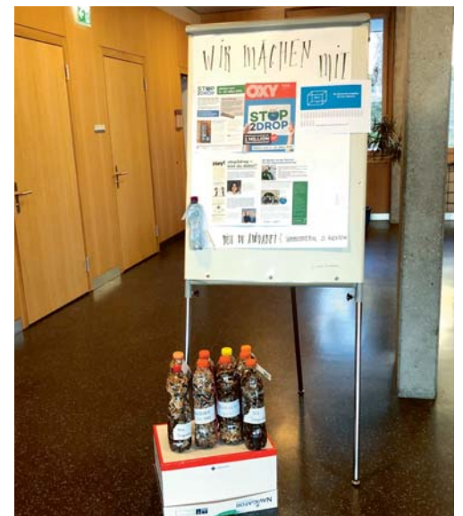
Auch die Oberstufenschüler/-innen von Degersheim haben sich an der Aktion «stop2drop» beteiligt.

Die Idee ist bei den Oberstufenschülerinnen und Oberstufenschülern auf offene Ohren gestossen. So wurden im Zeitraum vom 9. bis 22. März Zigarettenstummel auf den Strassen von Degersheim gesammelt. Die Jugendlichen waren erstaunt, wie viele Stummel am Strassenrand liegen. Am Ende der Sammelperiode wurden die in PET-Flaschen gesammelten Stummel nach Burgdorf geschickt. Die Jugendlichen der Oberstufe Degersheim konnten ihren Kolleginnen und Kollegen in Burgdorf neun PET-Flaschen weiterleiten. In einer 1,5-Liter-PET-Flasche befinden sich rund 450 Stummel. Am 30. März 2021 wurde das Ergebnis dieser Aktion in Burgdorf öffentlich präsentiert.