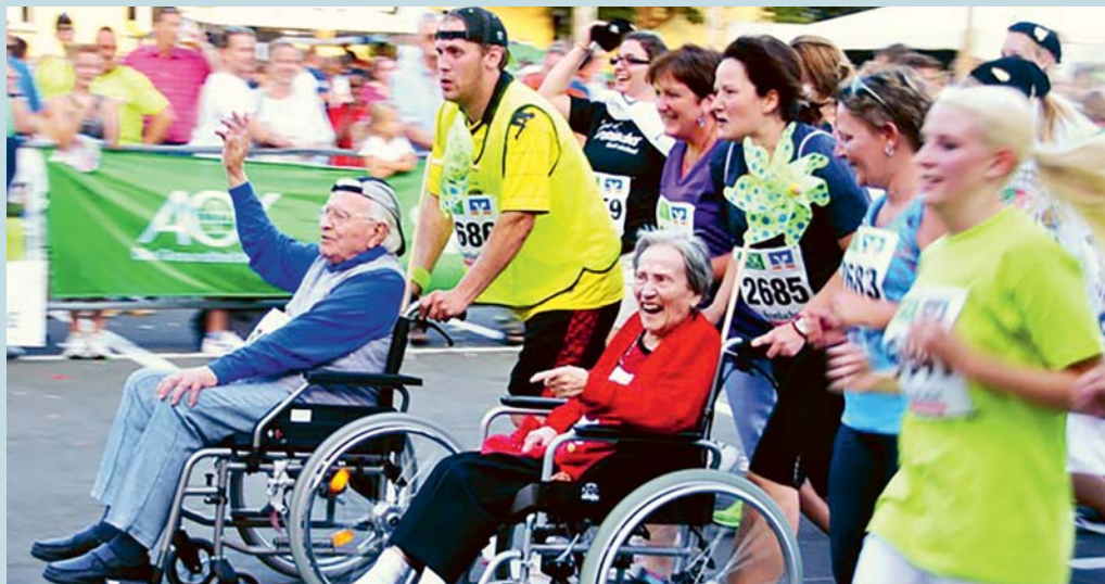
Regelmässige ehrenamtliche Arbeit bringt Vorteile für die eigene Gesundheit und das persönliche Wohlbefinden.

Mit dem Lockdown im letzten Jahr entstand eine grosse Solidaritätswelle – auch in unserem Dorf. In den Familien und in der Nachbarschaft wurde unser Blick für die Mitmenschen, die durch die Coronapandemie besonders gefährdet waren, geschärft. Es sind diverse Hilfsangebote entstanden. In der Zwischenzeit ist jedoch nicht allzu viel davon übrig geblieben.