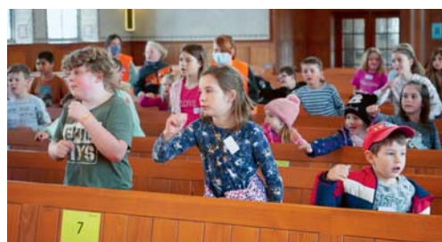
Auch die diesjährige Kinderwoche bereitete den Kindern viel Spass.

die Zuhörerschaft in die Geschehnisse rund um die biblische Figur Nehemia mitgenommen, der zu seiner Lebzeit ein Bauprojekt anleitete, nämlich den Wiederaufbau der zerstörten Stadtmauer rund um Israel. Auch heute noch kann man aus dieser Geschichte vieles lernen: Wer zusammensteht, kommt weiter; auf Gott vertrauen hilft; ich werde gebraucht, so wie ich bin; ich kann mutig mit Gottes Hilfe etwas anpacken. Neben all dem Bauen, Singen und Erzählen wurden verschiedene Workshops und Spiele angeboten – einmal mehr ein gelungener Anlass! Auf der Website der Reformierten Kirche Degersheim finden sich Einblicke in die Kinderwoche. Brigitte Widmer