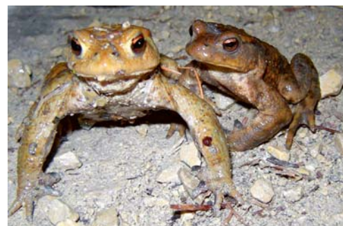
Krötenwanderung im Girenmoos.

VEREIN Werner Gehrig vom Naturschutzverein Flawil berichtet von seinem nächtlichen Einsatz für die Kröten: «Freitag, 26. März 2021, 22 Uhr, etwa 12 Grad Celsius, es ist dunkel, Regen ist in den nächsten Stunden zu erwarten. Ideale Bedingungen für die Wanderung der Amphibien zum «Liebesbad» im Laichgewässer. Ich mache mich auf für einen Kontrollgang ums Girenmoos. Die Wege sind von der Gemeinde mit Verbotstafeln signalisiert worden: Fahrverbot 19 Uhr bis 6.30 Uhr. Ich zähle an diesem Abend auf den Wegen rund um den Weiher 481 Erdkröten, 2 Grasfrösche und 15 Bergmolche. Die Erdkröten kommen aus den umliegenden Wiesen, Hecken und Wäldern. Die Männchen sitzen während der Frühlingwanderung oft in aufrechter Haltung an übersichtlichen Stellen, also Wegen und Plätzen. Sie halten nach Weibchen Ausschau, die sie bereits beim Anmarsch zu umklammern versuchen. Die Weibchen, die grösser sind als die Männchen, legen ihren Laich in bis zu fünf Meter langen Schnüren am Ufer ins Wasser. Meist überleben über neunzig Prozent der Eier und Larven nicht bis zur Metamorphose. In den Sommerlebensräumen halten sich die Erdkröten tagsüber unter Steinen, in Holzhaufen, in Erdlöchern oder in dichter, verfilzter Altgrasvegetation versteckt. Erdkröten sind nachtaktiv.» eing.