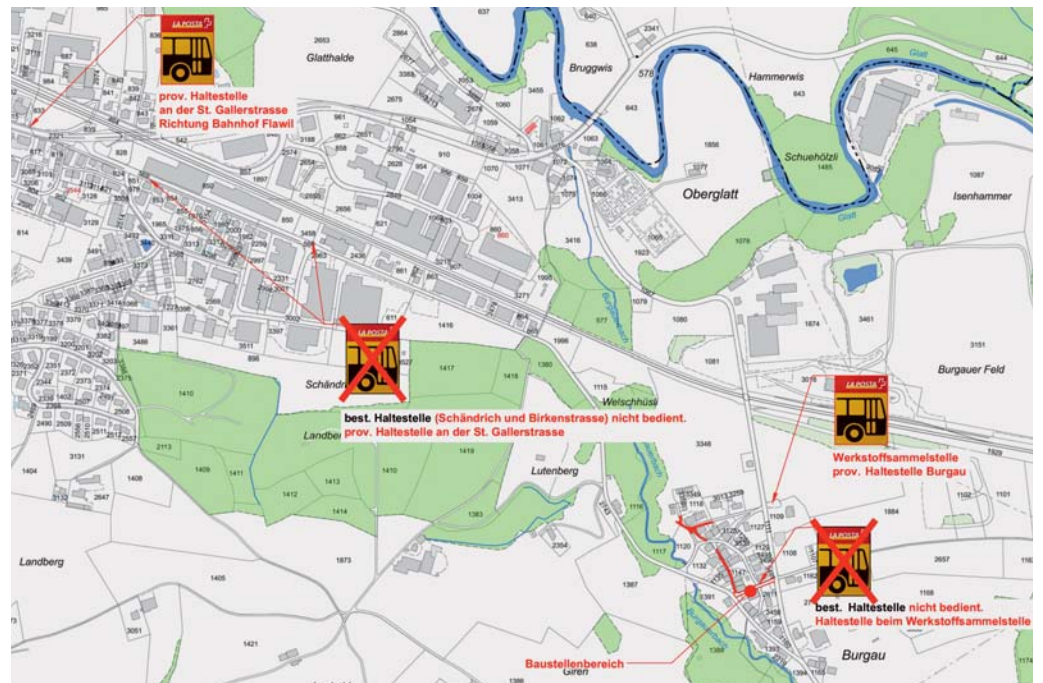
Der Deckbelageinbau hat auch Auswirkungen auf den Regionalbusverkehr.

Der Deckbelageinbau hat auch Auswirkungen auf den Regionalbusverkehr. Die Haltestelle Burgau wird vorübergehend zum Schulhaus Burgau verschoben. Dort wendet der Regionalbus und fährt zurück zum Bahnhof. Die Haltestellen Schändrich und Birkenstrasse werden während der Bauarbeiten nicht bedient. Stattdessen wird bei der Rückfahrt zum Bahnhof auf der St.Gallerstrasse ein zusätzlicher Halt eingeplant.