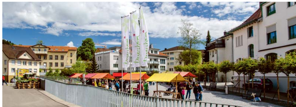
Saisoneröffnung des Degersheimer Wochenmarkts.

Auch geht es vielen so, dass die ganze Familie, Verwandtschaft und der Freundeskreis wissen, welch einzigartige Kunstwerke und Leckereien man herstellt. Zeigen Sie doch auch einem breiteren Publikum Ihre selbstgemachten Schätze. Wir freuen uns auf Sie, geschätzter Marktfahrer, geschätzte Marktfahrerin in spe.