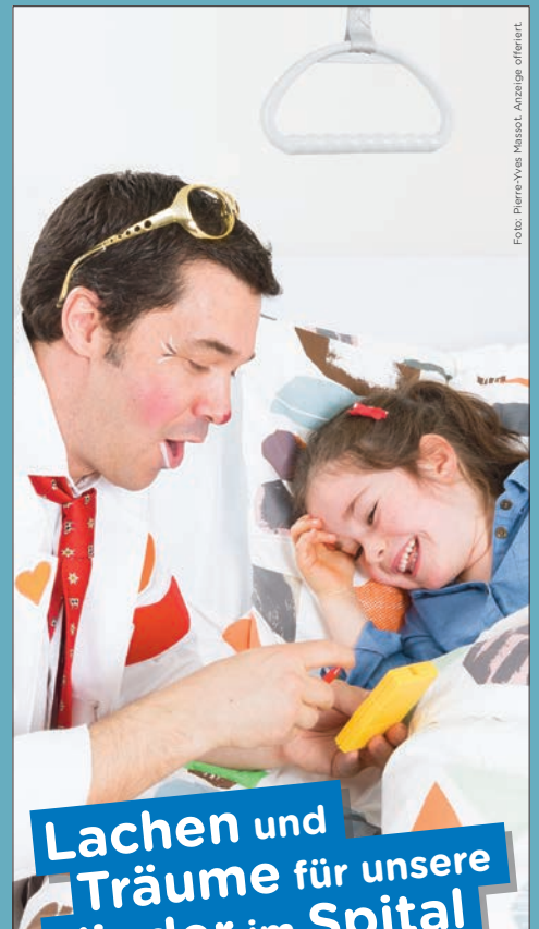
Anzeige offeriert.

Ortsbürgergemeinde Flawil Haupteingang Gemeindehaus (Urnenstandort), 11.00 bis 12.00 Uhr