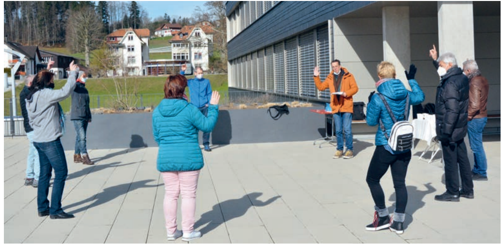
Am 13. März 2021 wurde die Solargenossenschaft Degersheim gegründet.

guten Start und hoffentlich ganz viele Mitglieder. Weitere Informationen finden sich unter www.solargenossenschaftdegersheim.ch