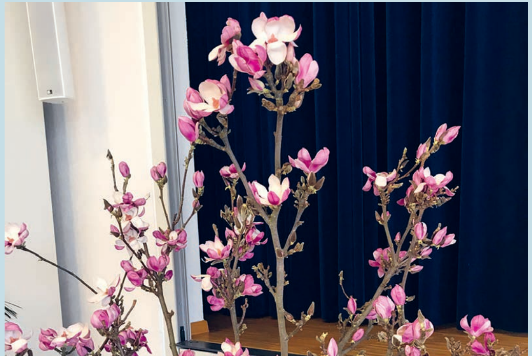
Blühender Magnolienzweig: Sinnbild für das, was in der Coronazeit «Trotz allem» zum Blühen kommen kann.

«Trotz allem!» hatten diese Leute keinen Erfolg, seine Frohbotschaft ist milliardenfach neu aufgeblüht über 2000 Jahre. Sie gäbe «Trotz allem!» auch einiges an wertvoller Orientierung gerade in einer so komplexen Situation wie der Pandemie.