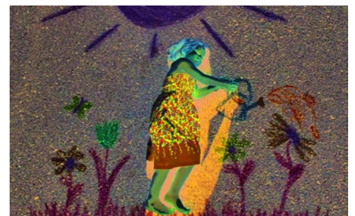
Ferienplauschaktion des Elternvereins Flawil: «Mach die Strasse zum Kino».