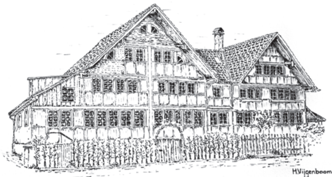
Bachstrasse 6/4 Flawil 2021

Marianne Bargagna | www.spitex-flawil.ch