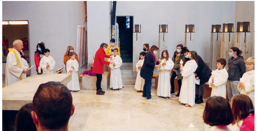
Auf dem Weg zur Erstkommunion.

KIRCHE Auf Wunsch der Erstkommunikanten-Eltern wird der Weisse Sonntag der Pfarrei St.Laurentius Flawil dieses Jahr auf den 12./13.Juni 2021 verschoben. Die Verschiebung ist verbunden mit der Hoffnung, dass so mit der Erstkommunion auch ein gebührieliches Familienfest stattfinden kann und die Restaurants dann wieder offen haben dürfen. Am eigentlichen Weissen Sonntag, am 11. April 2021, werden die Erstkommunionkinder um 10.15 Uhr zu einem «Erklärungs-Gottesdienst» in der katholischen Kirche Flawil eingeladen, wo