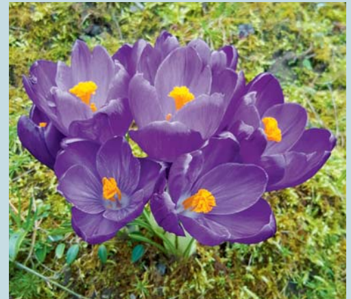
Frühlingsboten erinnern uns daran, dass das Leben stärker ist.