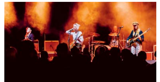
Solche Bilder vom Festival am Gleis werden erst 2022 wieder möglich sein.

VEREIN In den letzten Monaten waren die Veranstalter des Festivals am Gleis in engem Kontakt mit befreundeten Veranstaltern, haben die Entwicklungen verfolgt und ihre Möglichkeiten abgewogen. Auch sie können leider nur über die Situation im Sommer spekulieren und sind sich bewusst, dass dies in der Eventbranche leider noch länger so sein wird. Daher hat sich das OK dazu entschieden, das Festival am Gleis am 14. August 2021 nicht durchzuführen. Das OK bedauert dies sehr. Gerne hätte es diesen Anlass mit all seinen Besuchern, motivierten Helfern, Bands und stets unterstützenden Partnern realisiert. Die Hoffnungen liegen nun auf dem Festival 2022. eing.