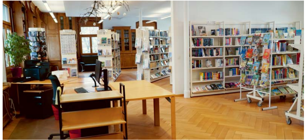
Die Bibliothek Ludothek Degersheim kehrt wieder zu den gewohnten Öffnungszeiten zurück.

hat. Gespannt sein darf man auch auf einen weiteren Krimi aus der Serie «Elbmarsch» von Romy Fölck oder das neueste Buch des aufstrebenden Schriftstellers Benedict Wells.