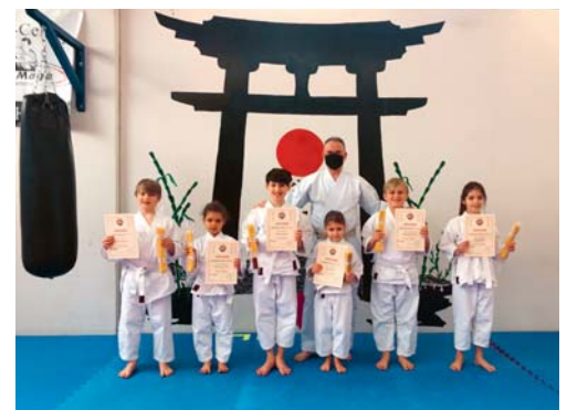
Die sechs Karatekas dürfen sich über die bestandene Prüfung freuen.