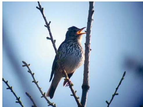
Die Singdrossel erfreut mit ihrem melodischen Gesang.