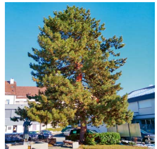
Die Föhre im Postpärkli wird durch einen einheimischen Baum ersetzt.

DEGERSHEIM Die grosse Schwarzföhre im Postpärkli ist für den Standort zu gross. Auch hat der nicht einheimische Nadelbaum einen sehr beschränkten Wert für die Biodiversität. Um die Biodiversität und die Attraktivität des Postpärklis zu steigern, werden die Mitarbeiter des Werkhofs die Schwarzföhre fällen und neue blumenreiche Rabatten anstelle der Kirschlorbeerflächen erstellen. Die Schwarzföhre wird durch einen einheimischen Baum ersetzt, der für den Standort gut geeignet ist.