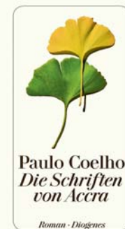
Ein Werk voller Weisheit

Treffpunkt ist jeweils von 20 bis 21.30 Uhr im Unterkapellenraum der Kirche St.Laurentius in Flawil. Anmeldung bitte bis 10. April 2021 an karin.reinli@se-ma.ch . Weitere Informationen sind zu finden unter www.se-ma.ch .