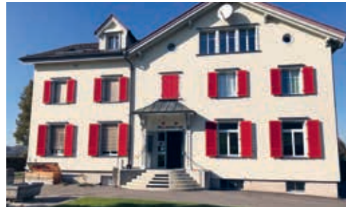
Im Schulhaus Alterschwil wird im kommenden Jahr eine zusätzliche Klasse geführt.

für den Umbau des Schulhauses Alterschwil liegt vom 22. März 2021 bis 6. April 2021 öffentlich auf.