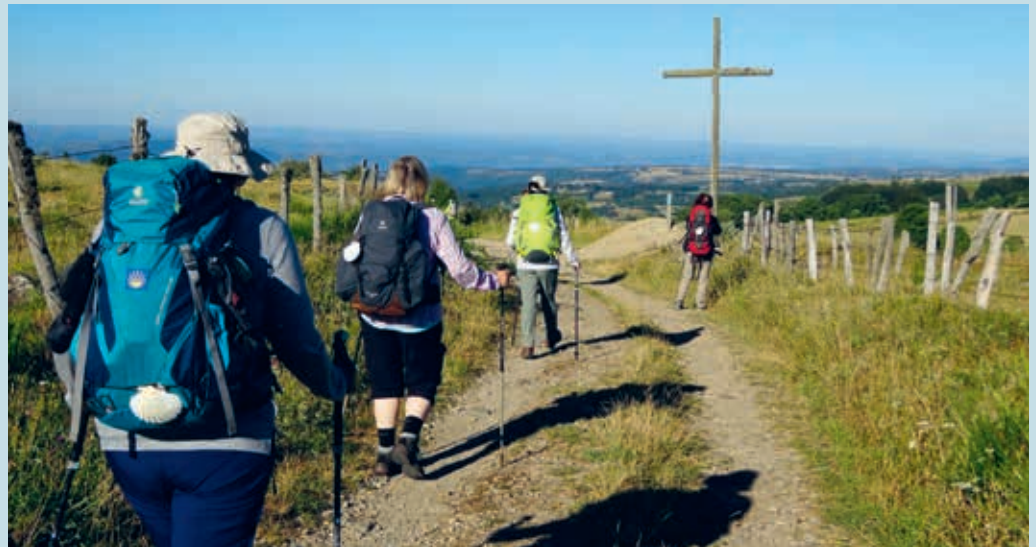
Auf dem Jakobsweg zwischen Le Puy-en-Velay und Conques.