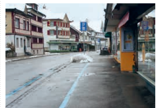
Nach der Sanierung bleibt die Parkdauer auf den Parkplätzen entlang der Hauptstrasse unverändert.

Ein Bewerbungsformular kann unter: www.tagesfamilien-region-uzwil.ch heruntergeladen werden.