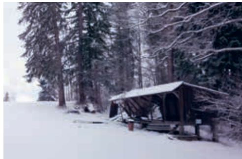
Der Wiederaufbau des Unterstandes im Herrenluftbad setzt die Einwilligung des Grundeigentümers voraus.

Bedingungen für eine öffentliche Nutzung des Unterstandes und der Feuerstelle zu klären, haben die Gemeinde und der Verkehrsverein das Gespräch mit dem Grundeigentümer gesucht. Der Gemeinderat hat den vorliegenden Tauschvorschlag daraufhin geprüft. Er stellt fest, dass dieser in einem Missverhältnis zum Bedürfnis einer öffentlichen Nutzung des Herrenluftbades steht, sind doch zahlreiche weitere Möglichkeiten für die Freizeitnutzung in unserer Gemeinde vorhanden.