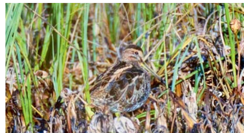
Die Bekassinen pendeln zwischen Girenmoos und Botsberger Riet.