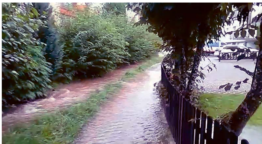
Das letzte Hochwasser gab es Ende August 2020: Der Tüfibach überschwemmt Teile des Siedlungsgebiets.

FLAWIL Am 7. März 2021 lässt der Gemeinderat nicht nur über den Neubau einer Turnhalle als Dreifachhalle mit Musikschulzentrum und über die Neugestaltung des Marktplatzes abstimmen, sondern auch über das Hochwasserschutzprojekt Dorf- und Tüfibach. Im Jahr 2012 hat der Kanton St.Gallen die Gemeinde Flawil verpflichtet, ein Hochwasserschutzprojekt für den Tüfibach zu erstellen. Deshalb bietet sich dem Gemeinderat nur wenig Spielraum. Mit dem nun vorliegenden Projekt kann für einen grossen Teil des Flawiler Dorfzentrums die Hochwassergefahr gebannt werden. Der Gemeinderat beantragt der Bürgerschaft für das Hochwasserschutzprojekt Dorf- und Tüfibach (Büelwisweg–Gupfengasse) einen Bruttokredit von 9,861 Millionen Franken.