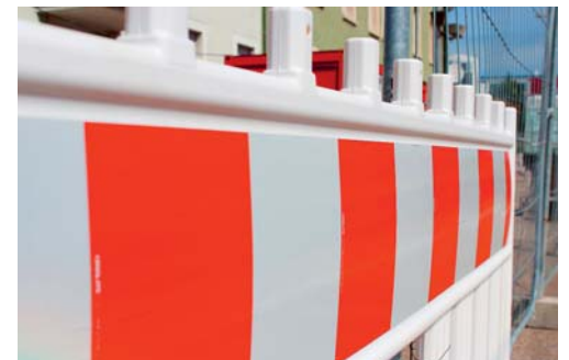
Dieselbachstrasse infolge Holzschlag gesperrt.

DEGERSHEIM Vom 15. Februar 2021 bis 19. Februar 2021 und vom 22. Februar 2021 bis 26. Februar 2021 jeweils von 07.30 bis 17.00 Uhr ist die Durchfahrt Dieselbachstrasse ab Verzweigung Eichstrasse infolge Holzschlag gesperrt. Wir danken für Ihr Verständnis.