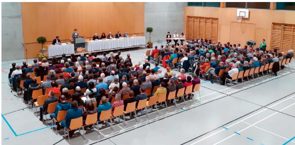
Über die Geschäfte der Bürgerversammlung wird dieses Jahr an der Urne abgestimmt.

Gemäss heutigem Stand könnte eine Bürgerversammlung unter Schutzvorkehrungen stattfinden. Wie sich die Lage in den kommenden