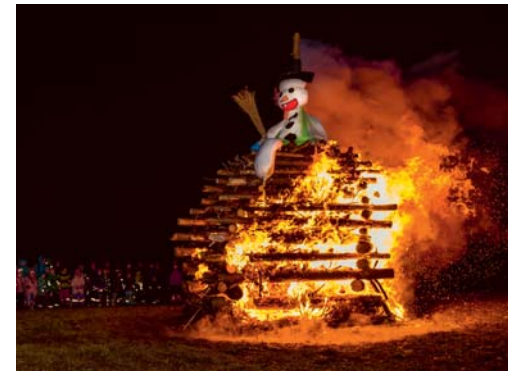
Der Funkensonntag findet nicht statt.

DEGERSHEIM Aufgrund der aktuellen Corona-Situation hat der Verkehrsverein Degersheim beschlossen, am Funkensonntag, 21. Februar 2021, keine Veranstaltung durchzuführen. Der traditionelle Lichterumzug sowie das Funkenabrennen finden nicht statt. Es bleibt zu hoffen, dass trotz ausbleibendem Böggorakel ein schöner Sommer folgen wird, in welchem der eine oder andere Anlass wieder möglich ist.