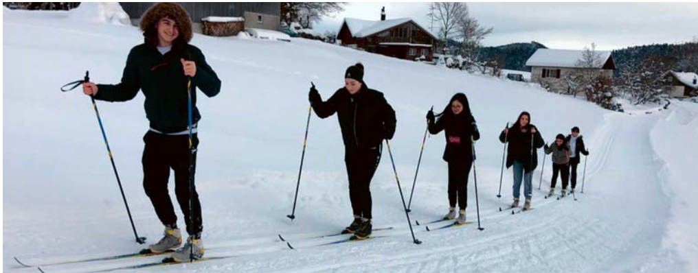
Während der Schneesportwoche galt es neben dem Skifahren auch andere Wintersportarten kennenzulernen.

boten. Da in der momentanen Situation weder Eisbahn- noch Hallenbadbesuche möglich sind, vergnügten sich die Polysportiven beim Langlaufen, Spielen im Schulhaus und bei Wanderungen in der näheren Umgebung.