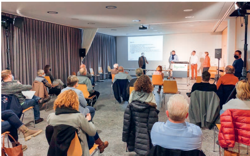
An einer Informationsveranstaltung stellt der Kanton das Projekt zur Sanierung der Hauptstrasse vor.

Die Hauptstrasse in Degersheim ist eine Kantonsstrasse. Entsprechend liegt auch die Verantwortung für die Sanierung beim Kanton. Dennoch ist es dem Gemeinderat wichtig, dass die Bevölkerung gut über das Projekt informiert ist, weshalb er zu einer Informationsveranstaltung einlud. Vertreter des Tiefbauamtes und der verantwortliche Ingenieur stellten das Projekt vor und erläuterten es. Im Anschluss daran beantworteten sie zahlreiche Fragen. Aufgrund der Einschränkungen im Zusammenhang mit der Corona-Pandemie konnten nur Anstösserinnen und Anstösser der Hauptstrasse zur Veranstaltung zugelassen werden. Allen anderen Interessierten stand die Möglichkeit offen, sich via Livestream zu informieren und via Chatfunktion Fragen zu stellen. Dieses Angebot wurde rege ge-