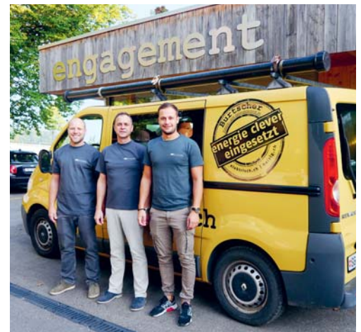
Die Burtscher Elektro- und Gebäudetechnik AG bietet Wärme und Strom aus einer Hand.

sung für die Energieversorgung der Liegenschaft und bewerkstelligt deren Umsetzung – Wärme und Strom aus einer Hand. «Wir sind stolz, eine innovative Firma mit hervorragenden Mitarbeitern und einem treuen Kundenstamm weiterentwickeln und ausbauen zu dürfen», sagt das neue Führungsteam. Ria Eisenhut