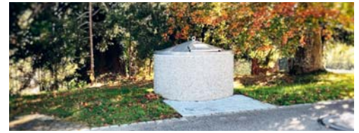
Das neue Abfallreglement ist seit dem 1. Oktober in Kraft.

DEGERSHEIM Da in der Gemeinde Degersheim mittlerweile überall Unterflurbehälter in Betrieb sind, hat der Gemeinderat Degersheim am 11. August ein neues Abfallreglement erlassen. Dieses war vom 28. August bis zum 26. September dem fakultativen Referendum unterstellt. Die Referendumsfrist ist ungenutzt abgelaufen. Das Abfallreglement ist seit dem 1. Oktober 2020 in Kraft.