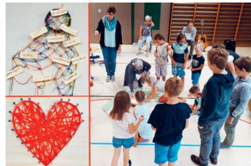
Der Familientag der Pfarrei Wolfertswil war ein Erlebnis für Gross und Klein.

KIRCHE Am Magdenauer Weiher trafen sich kürzlich knapp 30 Eltern und Kinder, um zusammen am Netz der Gemeinschaft zu knüpfen. Die «FamilienImpuls»-Gruppe der Pfarrei Wolfertswil hatte zum Feiern, Spielen, Basteln, Singen und Geniessen eingeladen. Zuerst hörten alle die Geschichte vom Dorf Farbenfroh, das mit einem farbigen glitzernden Netz überspannt ist, das alles Böse vom Dorf fernhält. Gemeinschaftliche Erlebnisse rundeten das Thema des ersten Teils des Familientages ab, die Kinder meisterten ihre Aufgabe mit Bravour. Im zweiten Teil widmeten sich die Eltern in der Impulsrunde dem Thema «Vertrauen» und die Kinder spannen beim Basteln farbige Fäden und tobten sich bei den Netzspielen aus. Der gemeinsame Zmittag bei schönstem Wetter lud ein, den Anlass gemütlich ausklingen zu lassen. Das in der Familienfeier geknüpfte Netz kann nun in der Kirche Wolfertswil bestaunt werden. Wer mehr über das Dorf Farbenfroh erfahren möchte, findet daneben die Geschichte zum Mitnehmen. Ein herzliches Dankeschön gilt den fleissigen Helfern, ohne die ein solcher Anlass nicht möglich wäre. Dunja Dux