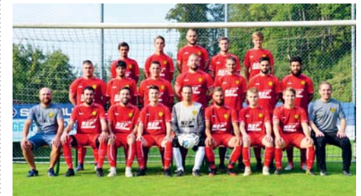
Der FC Neckertal-Degersheim freut sich über die neuen Trikots.

VEREIN Die Firma Nef Metallbau von Mogelsberg sponserte der 2. Mannschaft vom FC Neckertal-Degersheim neue Trikots. Die neue rote Farbe brachte den Sportlern schon beim ersten Spiel Glück – sie konnten einen Sieg verbuchen! Der FC Neckertal-Degersheim bedankt sich ganz herzlich beim Sponsor. eing.