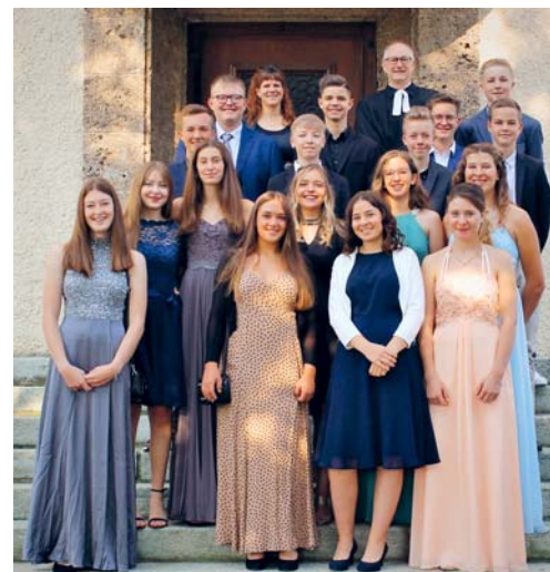
Die Konfirmandinnen und Konfirmanden wählten das Thema «Zukunft» aus.