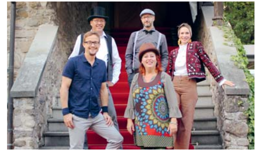
Die Kofferband bietet ein abwechslungsreiches Mundart-Acoustic-Comedy-Programm mit viel Witz.