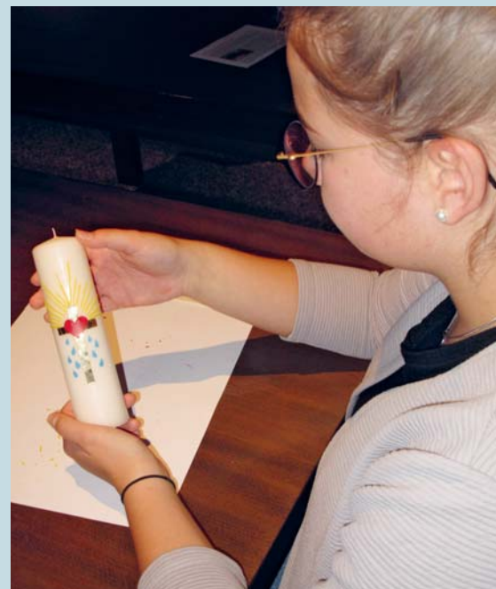
Die Firmwegkerze bringt zum Ausdruck: «Ich bin auf dieser Erde gewollt.»