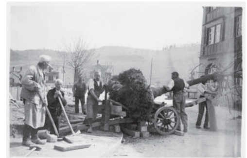
Die Dorfchronisten haben ein Schaufenster zum Thema «Bäume» gestaltet.