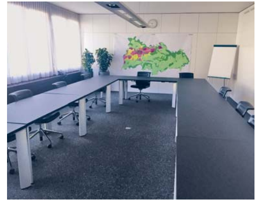
Zweiter Wahlgang: Sowohl im Schulrat, als auch in der GPK ist noch je ein Sitz nicht besetzt.

Der zweite Wahlgang für die noch nicht besetzten Sitze im Schulrat und in der Geschäftsprüfungskommission findet am Sonntag, 29. November 2020, statt. Die Wahlvorschläge dafür sind bis