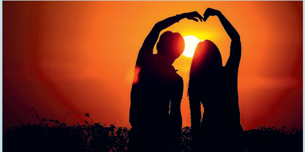
Der Konfirmationsgottesdienst vom 13. September 2020 steht unter dem Zeichen «Zukunft».

Umso schöner ist es, dass wir diese jungen Menschen am Sonntag, 13. September 2020, in der Kirche Feld um 10 Uhr zu ihrer Konfirmation begrüßen und ihnen diese Worte mit auf den Weg geben dürfen: «Seid mutig und stark. Gott wird euch nicht vergessen und nicht verlassen.» Mit der Konfirmation setzen die jungen Menschen ein Zeichen. Sie bestätigen damit, dass sie Mitglieder der kirchlichen Gemeinschaft sind.