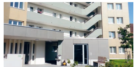
46 Prozent Energieersparnis dank Sanierung der Aussenhülle des Hauses Feld.