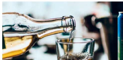
In den kommenden Wochen werden in Degersheim Alkoholtestkäufe durchgeführt.

sich an die gesetzlichen Vorgaben halten, desto eher können wir den Schutz unserer Jugend gewährleisten.