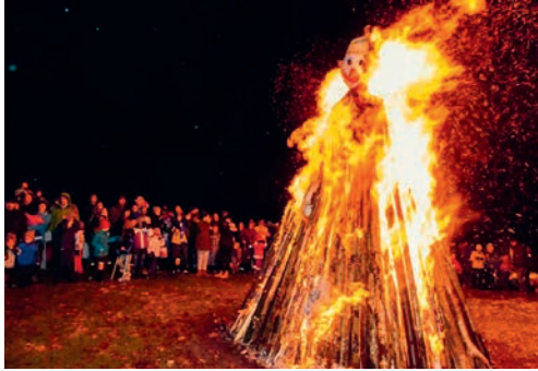
Die HV des Verkehrsvereins Degersheim findet am 24. September 2020 statt.

DEGERSHEIM Die Hauptversammlung, die im Frühjahr verschoben wurde, findet nun am Donnerstag, 24. September 2020, um 20 Uhr im Hotel Wolfensberg statt. Der Verkehrsverein freut sich auf viele Teilnehmende.