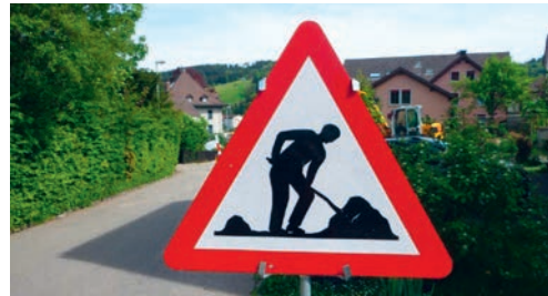
Die Deckbelagsarbeiten auf der Hauptstrasse führen im Bereich Wolfhag zu Verkehrsbehinderungen.

Die Bauherrschaft und das beauftragte Unternehmen setzen alles daran, die Behinderungen auf ein Minimum zu beschränken, und bitten die betroffene Anwohnerschaft und die Verkehrsteilnehmerinnen und Verkehrsteilnehmer um Verständnis.