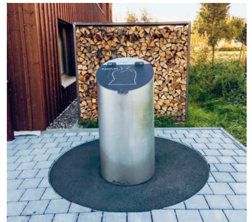
An der Oberdorfstrasse 17 wurde ein neuer Unterflurbehälter in Betrieb genommen.

DEGERSHEIM Im Zusammenhang mit dem Neubau des Mehrfamilienhauses an der Oberdorfstrasse 17 in Wolfertswil wurde ein neuer Unterflurbehälter gesetzt. Der UFB ist ab sofort in Betrieb und darf auch von den umliegenden Bewohnern benutzt werden.