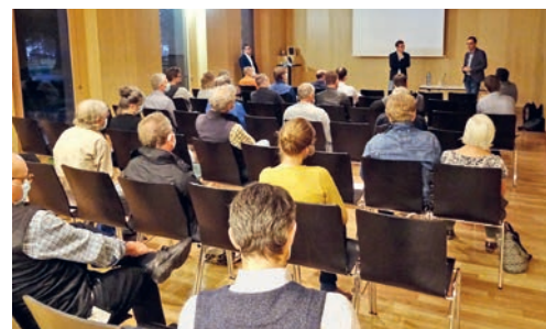
Reges Interesse bei der Infoveranstaltung «Heizen mit Eis» im ZwingliSaal Flawil.

und die Vorreiterrolle einer Energiestadt für eine konsequente, CO 2 -neutrale Warmwasseraufbereitung. Dani Müller