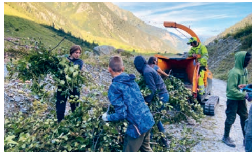
Die Schüler der 3. Oberstufe verrichteten während ihrem Klassenlager Umwelteinsätze.

Sträucher schneiden, Äste aus dem Weg räumen und somit Wanderwege wieder begehbar machen, das war die Aufgabe der dritten Realklasse. Mit vorbildlichem Einsatz und grossem Engagement half die Klasse den Gemeindearbeitern im Guttannental. Die dritte Sekundarklasse setzte sich für die Umwelt in Chamoson VS ein. Während diesen Umwelteinsätzen ist es immer wieder schön, zu beobachten, wie sich die Jugendlichen auch gegenseitig von einer anderen Seite kennenlernen und stolz auf die geleistete Arbeit sind. Ausserdem ist es für manche von ihnen auch eine gute Vorbereitung für den kommenden Berufsalltag.