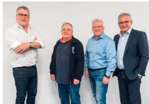
Die Nominierten für die Gemeindewahlen.