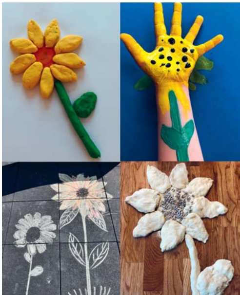
Sonnenblumen der Kita Kieselstein.

DEGERSHEIM Die Gemeinde Degersheim hofft, dass die im Rahmen ihres Wettbewerbs gesäten Sonnenblumen wachsen und gedeihen. Bis sie blühen, wird noch einige Zeit vergehen. Die Kinder der Kita Kieselstein konnten nicht mehr warten und haben sich kreativ ans Werk gemacht, Sonnenblumen jetzt schon zum Blühen zu bringen. Wir würden uns freuen, wenn auch Sie Sonnenblumen gestalten und damit Ihre Häuser und Gärten schmücken. Gerne können Sie uns Bilder davon per Whatsapp (078 923 09 65) oder E-Mail (gemeinde@degersheim.ch) zusenden.