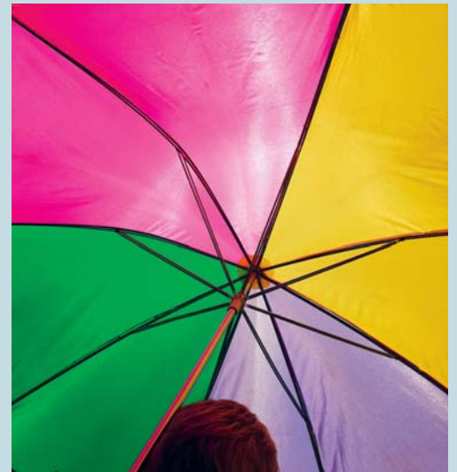
Im Familiengottesdienst «Unter Gottes Schirm» vom kommenden Sonntag wird um Gottes Segen für die Lager von Blauring und Pfadi sowie für alle Ferienreisenden gebeten.