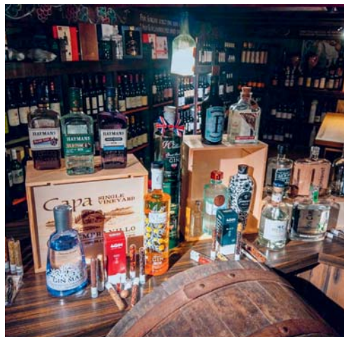
Breite Geschmackspalette für den Sommerdrink zu Hause.