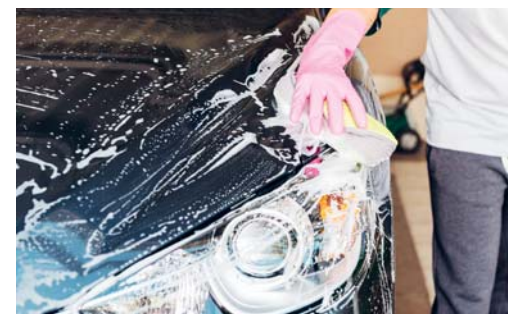
Autowäsche auf Privatparkplatz ist nicht mehr zeitgemäss.

ser wird gereinigt und anschliessend wiederverwendet. Im gebrauchten Waschwasser enthaltene Schmutzpartikel und Chemie-Rückstände (Reinigungsmittel, Lackschutz usw.) werden herausgefiltert und ordnungsgemäss entsorgt. Sie gelangen also gar nicht erst in die Umwelt. Die Recyclingquote der professionellen Waschanlagen liegt bereits bei 90 Prozent – mit weiter steigender Tendenz. Es ist daher aus vielerlei Hinsicht zu empfehlen, die Autos nur in dafür vorgesehenen Anlagen zu waschen.