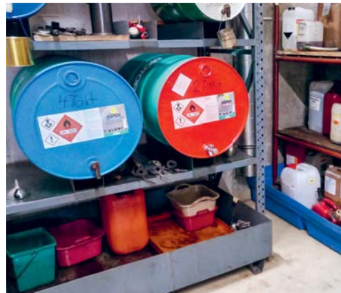
Der Gemeindewerkhof wurde vom Kontrolleur vorbehaltlos abgenommen. Die Vorschriften aller Kontrollbereiche wurden erfüllt.

Die sogenannten UWI-Kontrollen werden vom Amt für Umwelt und Energie vorgeschrieben und von durch den Kanton St.Gallen vorgeschlagenen Firmen durchgeführt. Bei den vor Ort durchgeführten Kontrollen werden die Bereiche Abwasser, Abfall sowie die Lagerung von wassergefährdenden Flüssigkeiten und Lacken geprüft. Die Inspektion im Werkhof Degersheim wurde am 25. Mai durchgeführt und förderte keine Mängel zutage.