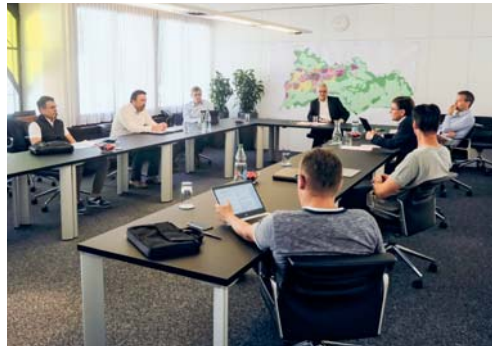
An der Corona-Konferenz wurden Unterstützungsformen in Ergänzung zu den bereits bestehenden Angeboten von Bund und Kanton diskutiert.