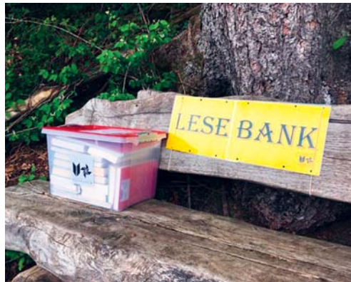
Auf verschiedenen Ruhebänken in Degersheim befinden sich wieder Kisten mit Lesematerial.

Das Team der Bibliothek Ludothek freut sich, wenn diese Leseanimation Anklang findet. Suchen Sie noch mehr Lesestoff? Oder ein spannendes Spiel? Dann bietet Ihnen die Bibliothek