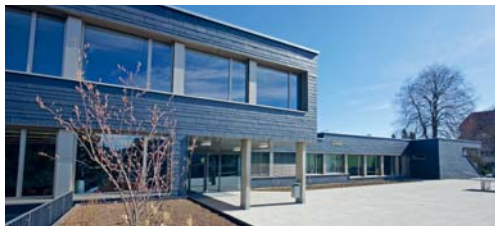
Das überarbeitete Urlaubsreglement der Gemeinde Degersheim tritt per 1. Mai 2020 in Kraft.

DEGERSHEIM Am 10. März 2020 hat der Gemeinderat das neue Reglement über Absenzen, Urlaub und Dispensation für Schülerinnen und Schüler erlassen und dem fakultativen Referendum unterstellt. Die Referendumsfrist ist in der Zwischenzeit unbenutzt abgelaufen. Das Urlaubsreglement tritt per 1. Mai 2020 in Kraft.