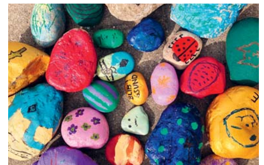
Die Kindertagesstätte Kieselstein hat bunte Steine verteilt und wünscht viel Spass beim Suchen.

9.30 Uhr sowie 15.30 Uhr und 17.00 Uhr in der Kita Kieselstein abgeholt werden kann. Die Überraschung gibt es im Austausch mit dem Stein.